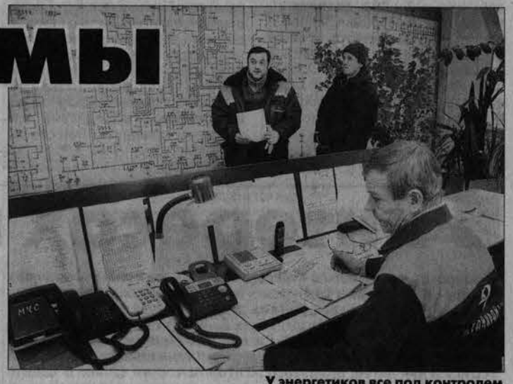
У энергетиков все под контролем.

Несмотря на уже выпавшие энергетикам сложности с погодными аномалиями, зима еще не окончена. Ветра и метели, типичные для февраля и марта, к сожалению, еще не раз заставят их работать в экстренном режиме. Но в сетевой компании «Алтайэнерго» к этому готовы. На складе есть весь необходимый аварийный запас материалов, в круглосуточном режиме работает диспетчерская служба, в боевой готовности передвигаются дизель-электростанции, налажен контакт со смежными организациями и экстренными службами. Поэтому жители края могут быть спокойны: сегодня энергетиков все под контролем. На днях журналистам краевых СМИ на деле показали, как по-современному тянут электричество для новостроек в Новоалтайске. Район города, отведенный под малоэтажное строительство, будет запитан через новую ЛЭП. При замене отслуживших свое проводов энергокомпания все чаще применяет самонесущий изолированный провод (СИП). Кстати, производитель гарантирует, что он прослужит минимум 40 лет. По словам энергетиков, это очень важно в наших погодных условиях: такой монтаж более устойчив к воздействию штормовых ветров и образования льда. Если даже на провод вдруг упадет дерево, то подерживающие СИП устройства размыкаются и тот просто провисает, а не обрывается. Соответственно, снабжение электроэнергией не прерывается. Еще один момент: в случае применения самонесущего изолированного провода кражи электро-