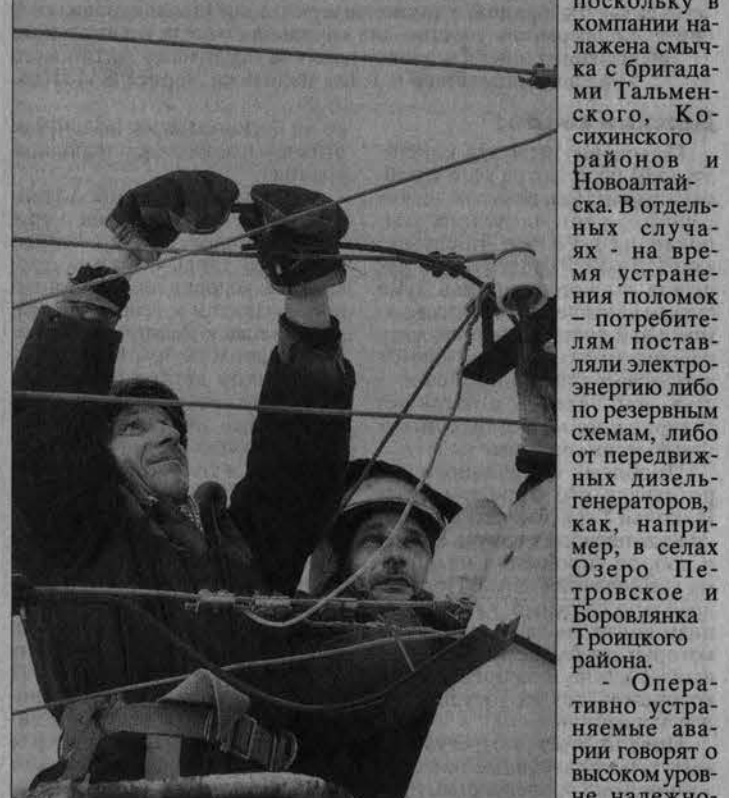
Самонесущий изолированный провод более надёжен.

энергии с помощью набросов попросту исключены. В беседе сплели припомнили, как в зимнюю непогоду аварийно-восстановительные бригады СК «Алтайэнерго» в большинстве случаев быстро ликвидировали повреждение в электрических сетях. По словам главного инженера Новоалтайских МЭС Виктора Юленкова, энергетикам оперативно, социально значимых объектов и населения, – сказал Виктор Юленков. – Для его повышения в 2012 году филиал сетевой компании «Алтайэнерго» Новоалтайские межрайонные электрические сети построил 11 новых объектов. Кроме того, в зоне ответственности этого подразделения заменили четыре силовых трансформатора. Денис СТРЕЛЦОВ, Сергей БАШЛЫЧЕВ (фото).