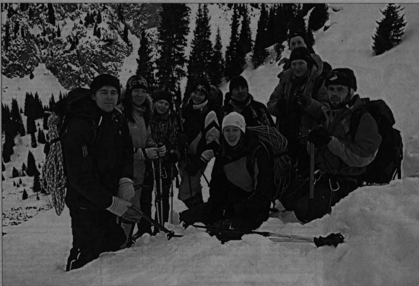
Наши альпинисты на восхождении.