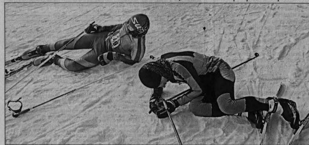
Ребята отдали борьбе все силы без остатка.

— Впервые выступала за свой вуз, жаль, что не выиграли в «абсолютке», — сказала она. — Помню, как в детстве мы с нетерпением ждали эти гонки, настраивались на них, волновались безумно. А сейчас, конечно, воспринимать уже совсем другое. Но всё равно небольшое волнение присутствует, как и на любых соревнованиях.