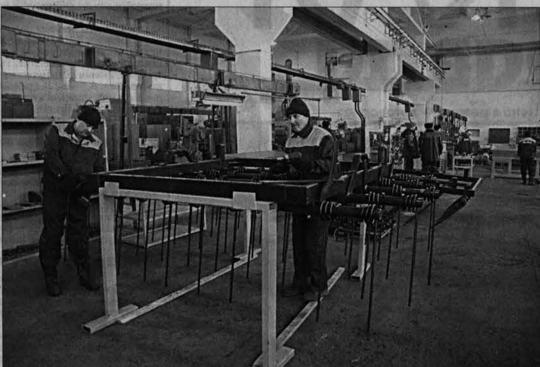
В производственном цехе АНИТИМа. Разработали и сделали.