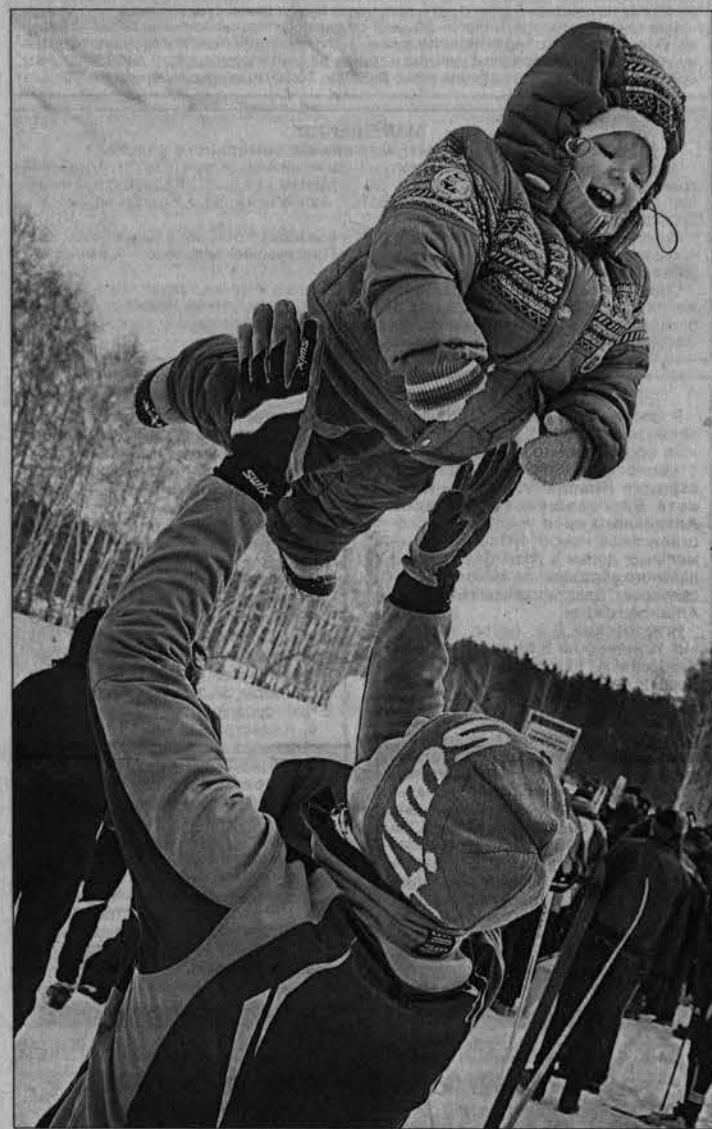
Сверху смотреть на папу веселее.

дительница молодежного первенства страны прошлого года Ярослава Черданцева.