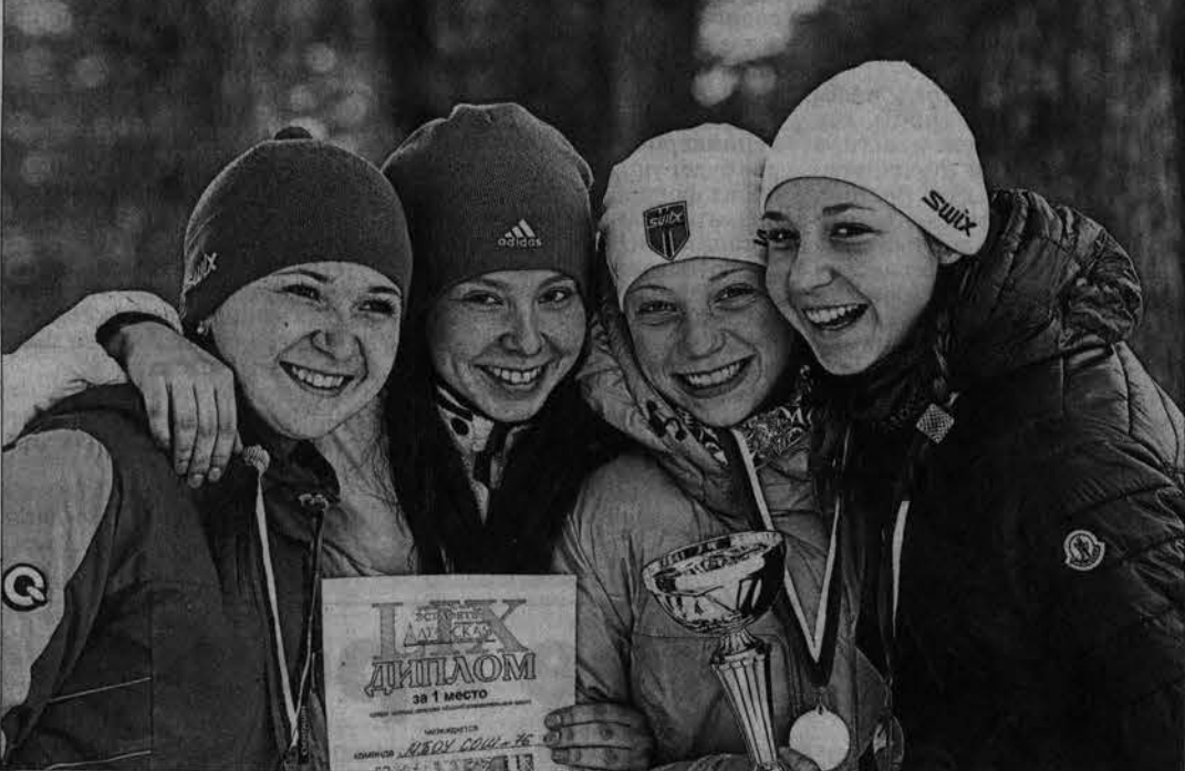
Победители - учащиеся школы №76 г. Барнаула среди девочек.

Декабрьские морозы отодвинули старты традиционных эстафет с традиционным декабрьским дат. Дня не было, чтобы кто-то не позанимался: «Ну когда же наконец?» С одной стороны, такая заинтересованность радовала. С другой - и мы опасались: не устанут ли жидать?