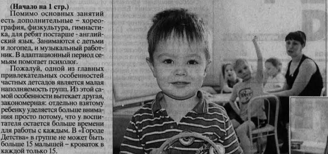
«А что это вы тут делаете?»

(Начало на 1 стр.) Помимо основных занятий есть дополнительные – хореография, физкультура, гимнастика, для ребят постарше – английский язык. Занимаются с детьми и логопеды, и музыкальные работники. В адаптационный период семьям помогает психолог. Пожалуй, одной из главных привлекательных особенностей частных детских садов является малая наполняемость групп. Из этой самой особенности вытекает другая, закономерная: отдельно взятому ребенку уделяется больше внимания, просто потому, что у воспитателя остается больше времени для работы с каждым. В «Городе Детства» в группе не может быть больше 15 малышей – кроваток в каждой только 15. У этого центра есть и свое особое преимущество. Из того, что он находится на базе школы, в дальнейшем, когда дети подрастут, сама собой вытекает возможность привлечения учителей для подготовки детей к школе. Хотя центр работает всего несколько месяцев, добрая молва сделала свое дело: детей привозят родители не только из других кварталов города, но и из Санникова, из Южного, из Калманки.