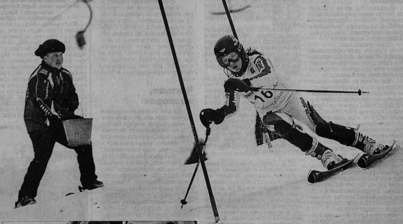
Организаторам удалось сохранить трассу в хорошем состоянии, несмотря на не самые лучшие погодные условия. После каждого спуска трассу посыпали солью.

Зрители могли наблюдать и досадные ошибки и скользкие трассы, и бурю эмоций на финише.