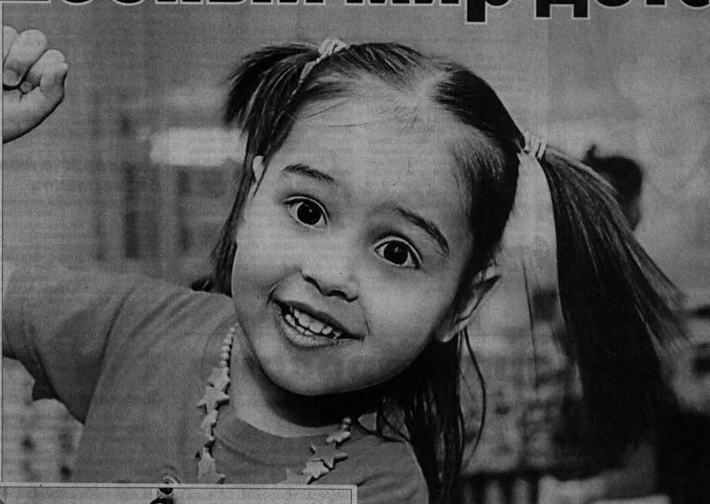
Вспомним детство золотое и звездное?

— А вы зачем к нам приехали? — этот вопрос малыши задавали не раз представителям СМИ, побывавшим в ходе пресс-тура в трех детсадах. Что из себя представляет частный детский сад, как живет его воспитанникам, какие образовательные программы для детей могут выбрать в подобных учреждениях родители? На эти и многие другие вопросы получили ответ журналисты.