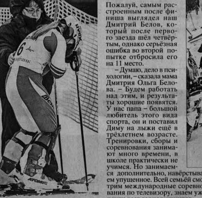
Зрители могли наблюдать и досадные ошибки и скользкие трассы, и бурю эмоций на финише.