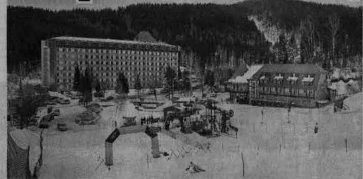
Вид с горы Благодать радует глаз в любую погоду.