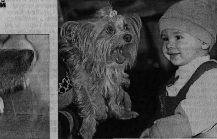
Я хороший, возьмите меня, пожалуйста.