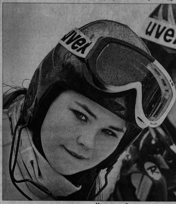
Начинавшийся дождь не слишком благоприятствовал спортсменам.