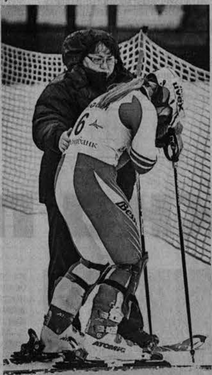
Зрители могли наблюдать и досадные ошибки и скользкие трассы, и бурю эмоций на финише.