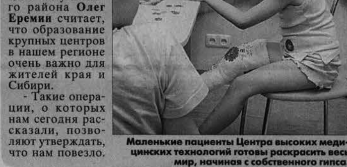
Маленькие пациенты Центра высоких медицинских технологий готовы раскрыть весь мир, начиная с собственного гипса.

Такие операции, о которых нам сегодня рассказали, позволяют утверждать, что нам повезло.