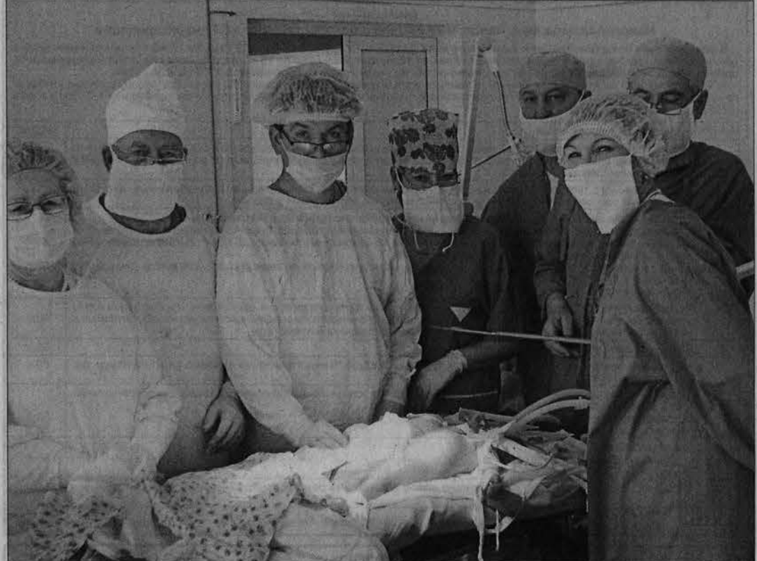
После операции: «Все получилось»