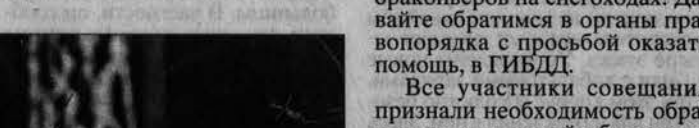
Сохраним такую красоту!