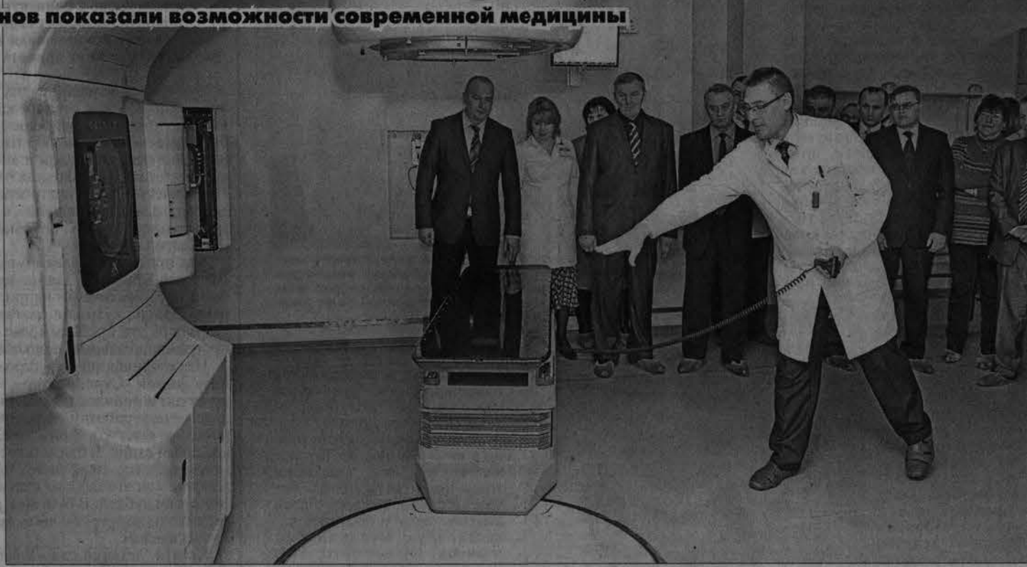
Главам администраций районов показали на примере, как работает новейшая аппаратура.

Здесь и уточняющая диагностика: ультразвуковая и изотопная, так называемая атомная медицина, и другие виды исследований. Мы предоставляем уникальное лечение на мощном линейном ускорителе, который занимает четыре этажа. Установлены новые пушки с кобальтовыми зарядами. При этом корпус абсолютно безопасен для нахождения в нем. Здесь есть отличная вентиляционная система, а сложная система защиты с дозиметрами, контроллерами не позволит включиться аппаратуре,