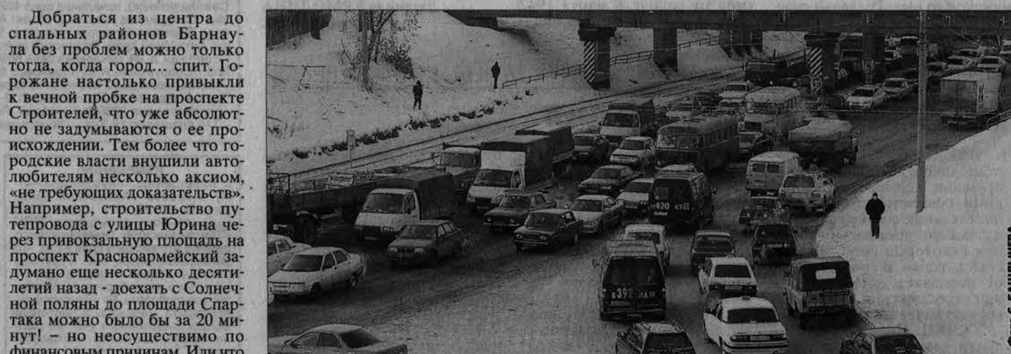
Для тысяч барнаульцев Павловский тракт - «дорога жизни».

Как ликвидировать пробки на проспекте Строителей?