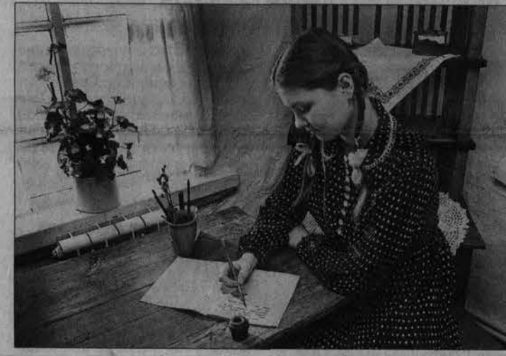
В музее воссоздана атмосфера крестьянского дома 1930-1940 годов.