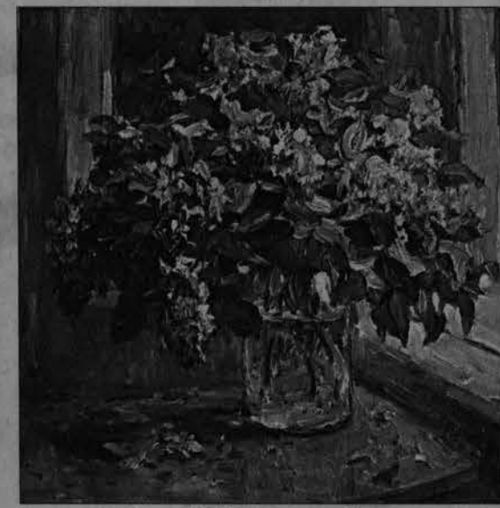
И. Хайрулинов. «Сирень на окне».