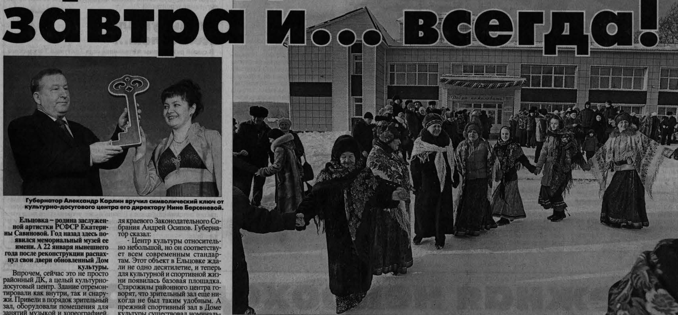
Обновленному Дому культуры рады все участники творческих коллективов и жители Ельцовки.

В Ельцовке после реконструкции открылся культурно-досуговый центр