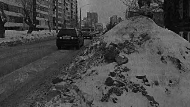
Ул. Партизанская. Почему снег не вывозится?