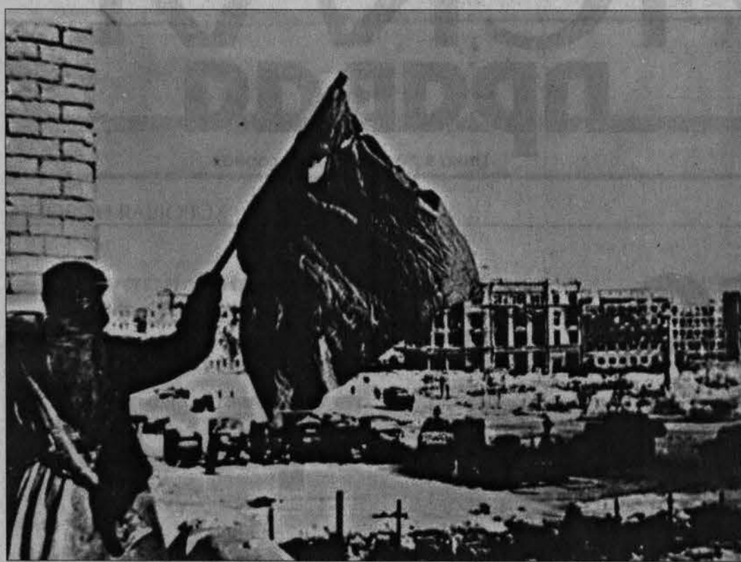
Сталинград, февраль 1943 года.

– Когда слушаю песню «Соловьи, соловьи, не тревожьте солдат, пусть солдаты немного поспят», у меня спазм в горле, я всю войну на кашке спал! В 1943 году к нам привезли молодых ребят (1925 года рождения), они говорят: «Как так, вы пилы и снаряды не боитесь?» И мы учили их тоже не бояться», – рас-