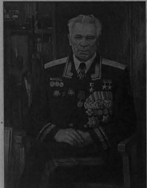
И. Хайрулинов. Портрет конструктора, генерал-лейтенанта М.Т. Калашникова.