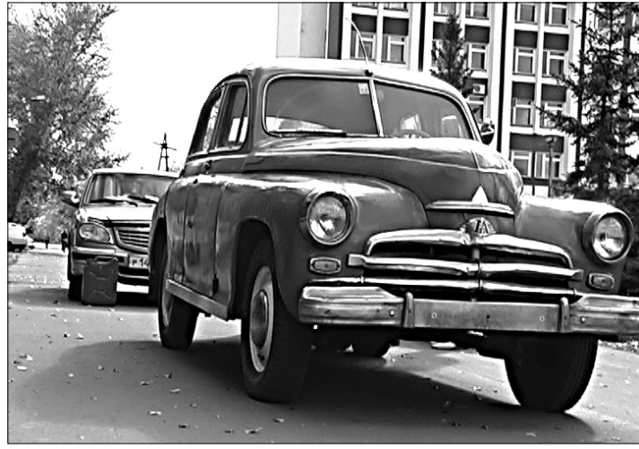
Новый экспонат Славгородского музея.

Автопарк Славгородского краеведческого музея пополнился легендарным советским автомобилем послевоенной поры.