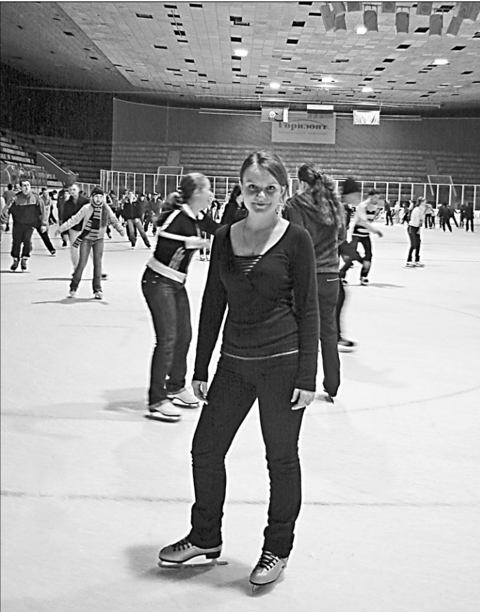
Здесь места хватит всем!

Чтобы летом вдохнуть глоток свежего воздуха, а ранней осенью или поздней весной постоять на льду, совсем не обязательно уезжать на Северный полюс. У барнаульцев он прямо под боком. Круглый год во Дворце эреции и спорта работает кружок массового катания на коньках.