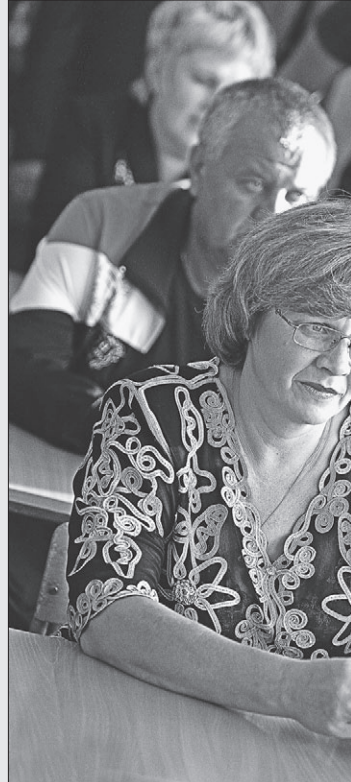
Разговор с учителями.

Сегодня здесь 163 ученика. Учителя с гордостью подчеркивают, что с 2001 по 2011 год школу окончили 9 - с золотыми