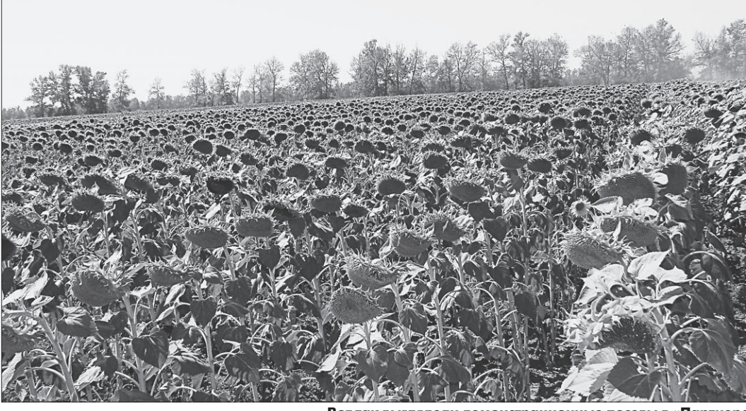
Вот так выглядели демонстрационные посева в «Партнере».

Страны, которые достигли выхода продукции 60-80 центнеров с гектара, все усилия направляют на снижение затрат. У нас в крае ресурсосбережение надо связывать с интенсификацией производства. Но его суть