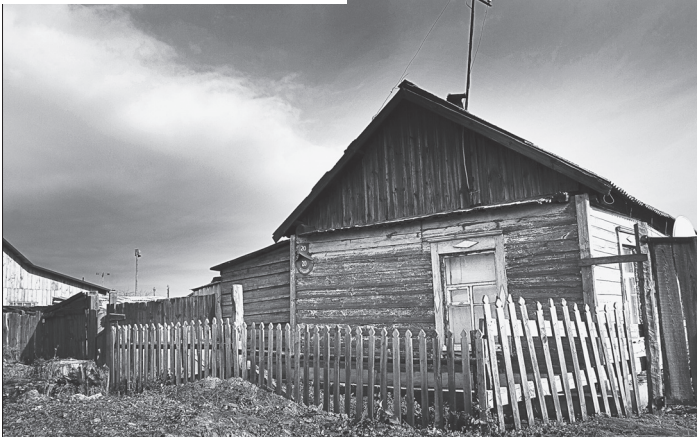
Долгие годы пожилая женщина жила в этом доме.

СПРАВКА "АП" По данным Главсоцзащиты, в крае уже получили жилье 3817 ветеранов. В очереди стоят более 1600 человек.