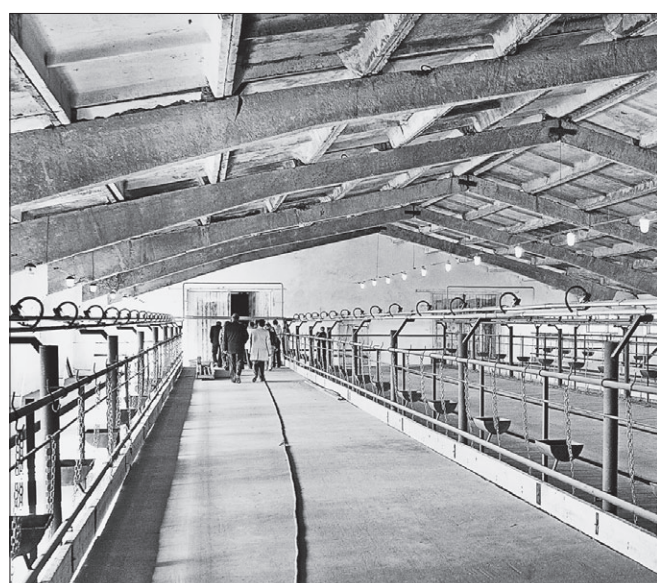
В новом коровнике всем будет уютно.