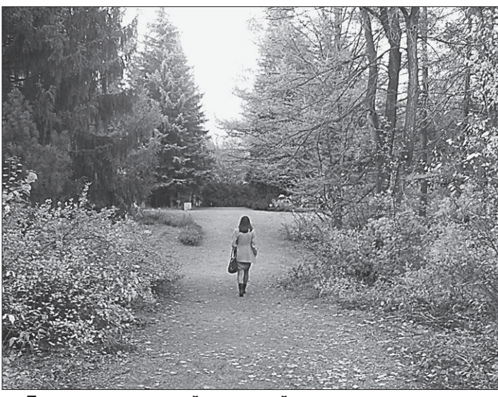
Приходите в дендрарий за красотой и раздумьями в одиночестве. Где еще найдешь такое место?