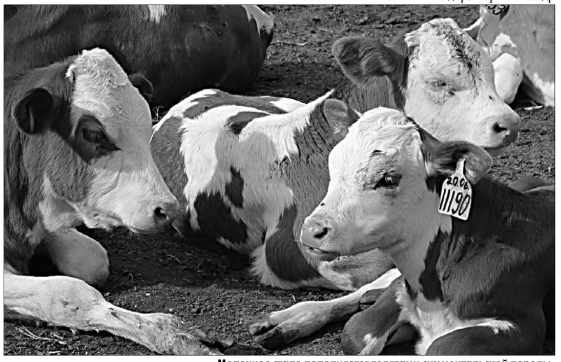
Молочное стадо пополняется телочками симментальской породы.