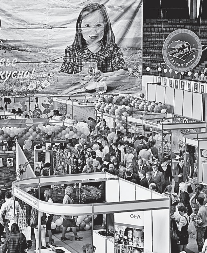
Международный фестиваль «Праздник сыра» собирает тысячи людей.

невозможно получить без качественного молока.