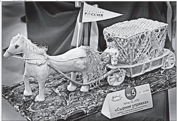
Сырная лошадка на выставке очень понравилась малышам. Всем так и хотелось с ней поиграть.

приняли участие представители оптовых и розничных компаний Москвы, Новосибирска, Красноярска, Кемерово. Кроме деловых переговоров с производителями за «круглым столом» они обсудили актуальные профессиональные вопросы и перспективы сотрудничества.