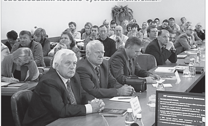
В рамках научно-практической конференции более 200 врачей лучевой и ультразвуковой диагностики, рентгенологов, травматологов-ортопедов смогли познакомиться с самыми современными научными и практическими разработками в области лучевой диагностики заболеваний костно-суставного аппарата различного генеза.