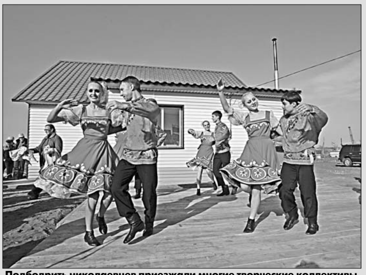
Подобрать николаевцев приехали многие творческие коллективы.

18 сентября. Полностью сооружены и утеплены фундаменты трех первых домов. Накануне работники «Стройгаза» провели кладку их стен из газобетона. Расчищено уже около 120 площадок. Этим же днем отмечен старт обновления инженерной инфраструктуры. Проектировщиком водопровода, водозабора, двух напорных башен определили институт «Алтайводпроект». Реконструкцию котельной и тепловых сетей поручили разработать «Сибгипросельхозмашпроект». Теплоснабжение. В кратчайшие сроки построено почти 20 км магистральных и разводящих теплосетей. Если до пожара центральным отоплением пользовались хозяева не более 60 квартир, то потом их число увеличилось до 270. 20 сентября. Разбивка под застройку идет на 170 площадках. Ежедневно здесь дежурит кто-либо из вице-губернаторов - сроки! Восточная улица (она растет быстрее всех). Тут на домовые коробки положили первые потолочные плиты... Руководство «Стройгаза» перечисляет на восстановление села