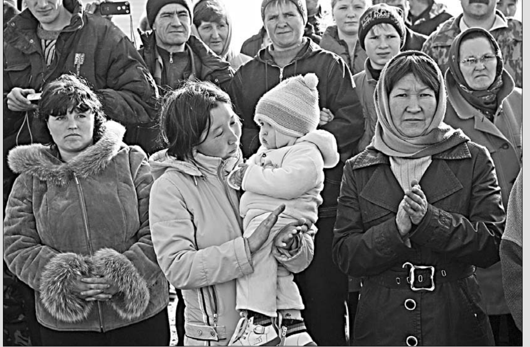
Нам помогли, и мы выстояли!