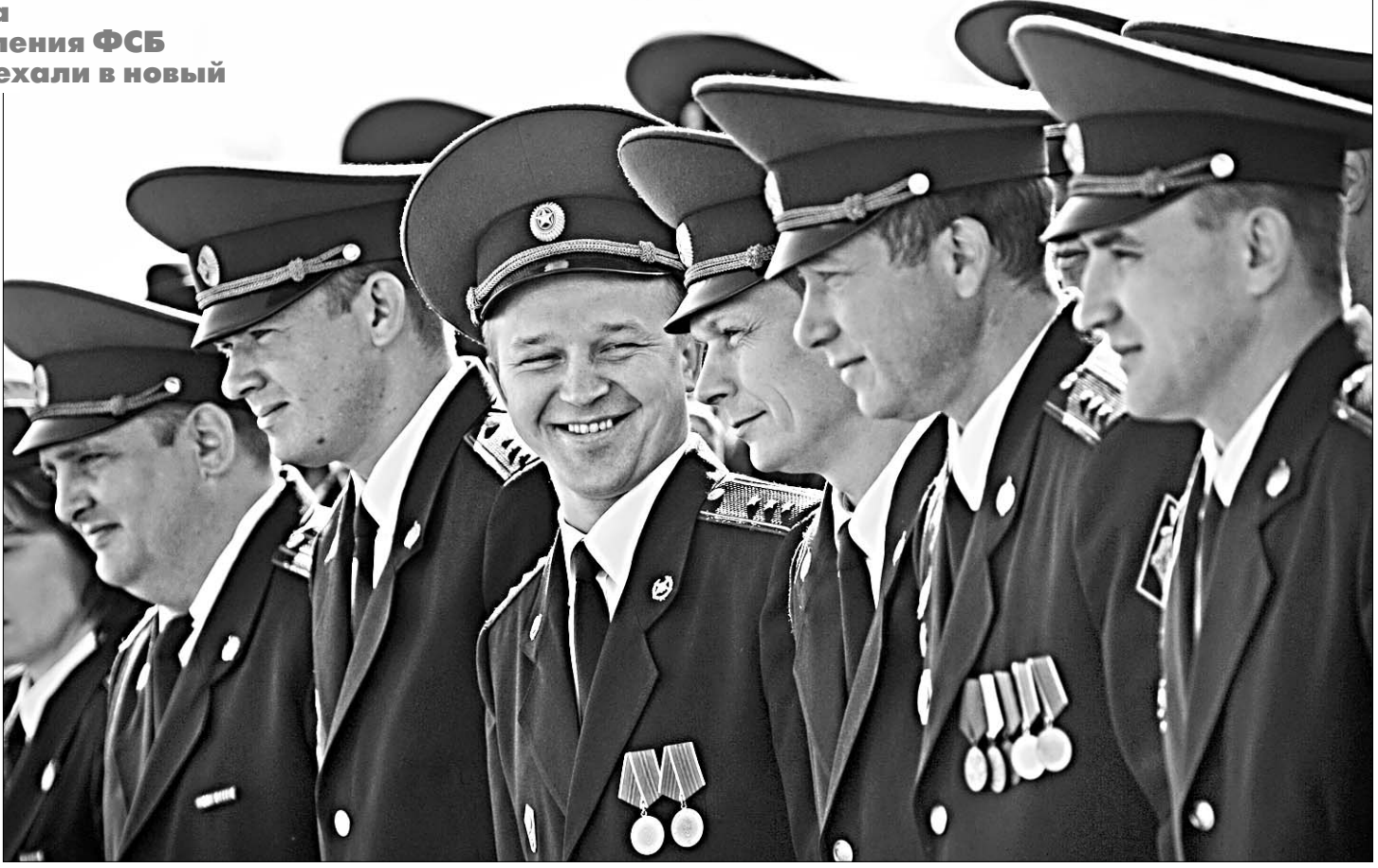
Защитники рубежей страны рады новоселью.

Комплекс включает в себя административно-хозяйственную и спортивную зоны, где можно не только работать, но и поддерживать свою физическую форму, занимаясь спортом, отдыхать. В административной части - просторные кабинеты с современным оборудованием, ситуационный зал, оснащенный высокотехнологическими системами управления, связи, которые помогут отслеживать и контролировать обстановку на границе. Есть и система биометрического сканирования, а также центр сбора и обработки информации, комната боевой славы, складские и технические помещения. Новый гаражный бокс для 25 автомобилей, которые тоже поступили в распоряжение пограничников.