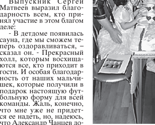
Торт - «книга» - хороший подарок к чаепитию.