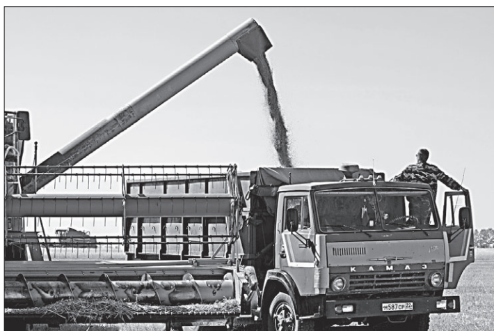
По 70 тысяч гектаров зерновых ежедневно обмолачивают хозяйства края.