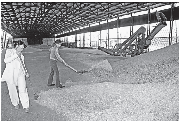
На мехтоку всегда порядок.

В Топчихинском районе убрано две трети зерновых культур. Один из лидеров жатвы - племрепродуктор «Чистонский».