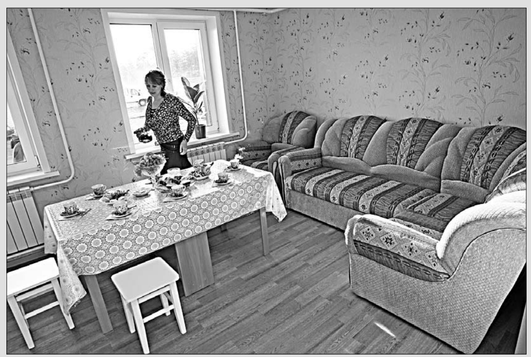
Хозяйкам сейчас одна забота – обихаживать.