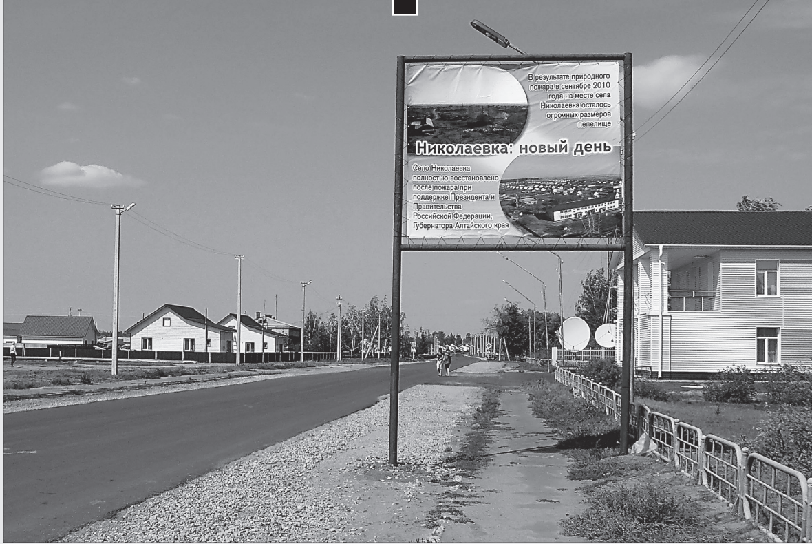
Вот подрастут деревья, и будет совсем ладно.

Вы должны знать, что мы не бросим вас в беде, - сказал Александр Богданович. - Поможем отстроиться либо переселиться. Кроме того, в ближайшие дни на каждого пострадавшего откроют счет в банке. Туда поступят 200 тысяч рублей - по 100 тысяч из федерального и краевого бюджетов. С 11 сентября начнут работать строители. Ключи от новых до-