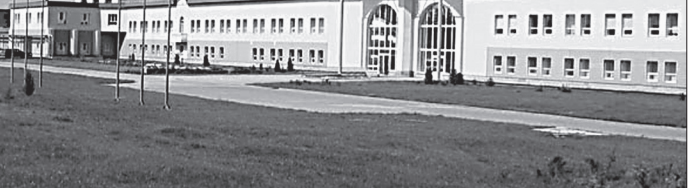
1991-й год. Развал СССР, экономику лихорадит, царствует бартер... В этом хаосе, в последние дни существования Советского Союза, выходит приказ № 341 Министерства автомобильного и сельскохозяйственного машиностроения СССР о создании в г. Барнауле завода прецизионных изделий.