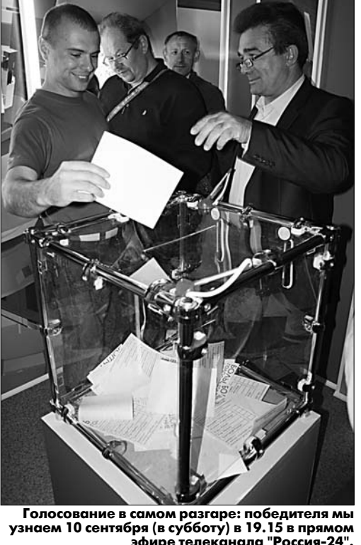
Голосование в самом разгаре: победителя мы узнаем 10 сентября (в субботу) в 19.15 в прямом эфире телеканала «Россия-24».