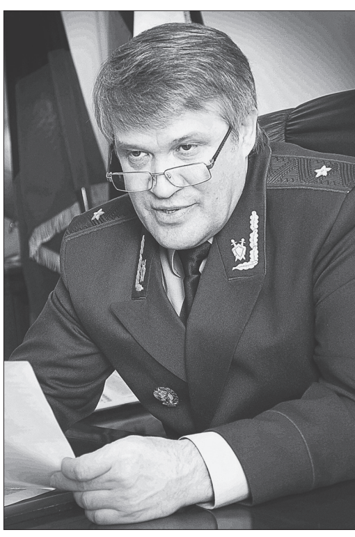
Яков Хорошев, прокурор Алтайского края

- Добрый день, я хочу узнать о судьбе производственного объединения «Алмаз» в Барнауле. Когда там наконец наведут порядок с выплатой заработной платы? - В крае несколько крупных предприятий, которые нарастают долги по зарплате, но «Алмаз» - самое проблемное из них. На сегодняшний день здесь задерживают зарплату около пяти миллионов рублей. Причем уже по состоянию на 1 июня этого предприятия являлось одним из крупнейших должников Алтайского края с суммой долга перед