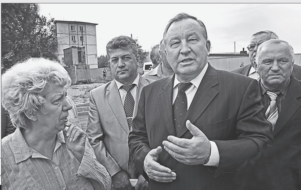
Программа помощи городу будет продолжена, — заверил рубцовчан Александр Карлин.

большинного объекта в другой. Эта печальная история насчитывает не много ни мало два десятка лет. Именно столько времени на территории одной из рубцовских больниц строится новый (хотя можно ли его теперь так называть?) корпус. Вначале предполагалось, что в нем разместится туберкулезное отделение. Но затем, наверное, тогдашние руководители поняли, что допустить ошибку, рядом с многоэтажным жильем строить такого рода объекты вряд ли разумно. Поэтому было принято решение разместить здесь так