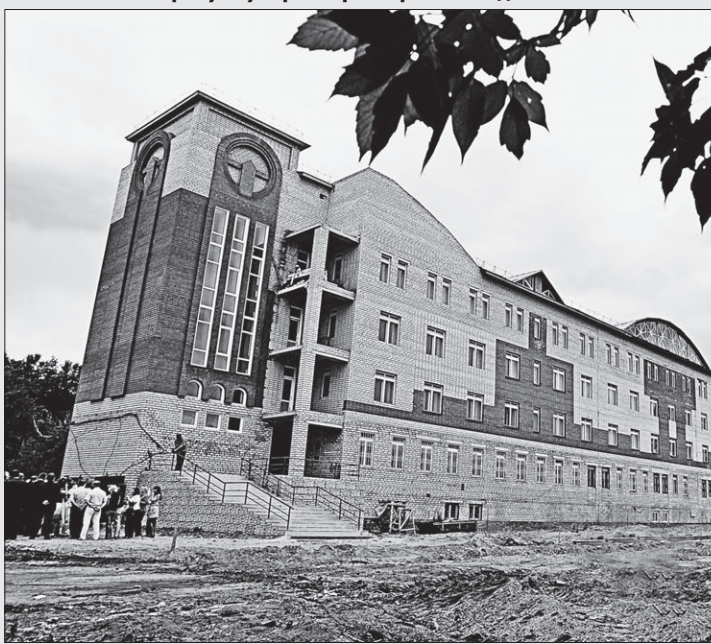
Строительство центра сердечно-сосудистой патологии явно затянулось.

других городах и районах края. Еще один плюс — при строительстве детского сада в Веселоярске используют в основном местные материалы. Обращаясь к строителям, губернатор особо подчеркнул, что деньги им краевой бюджет будет платить только за хороший результат.