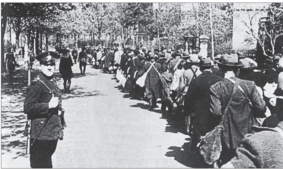
На сборы в дальнюю дорогу давалось лишь несколько часов.

28 августа вышел указ Президиума Верховного Совета СССР «О переселении немцев, проживающих в районах Поволжья». В нем, в частности, говорилось, что «по достоверным данным, полученным военными властями, среди немецкого населения, проживающего в районах Поволжья, имеются десятки и тысячи диверсантов и шпионов, которые по сигналу, данному из Германии, должны произвести взрывы в районах, населенных немцами Поволжья. О наличии такого большого количества диверсантов и шпионов среди немцев Поволжья никто из немцев, проживающих в районах Поволжья, советским властям не сообщил, следовательно, немецкое население районов Поволжья скрывает в своей среде врагов советского народа и Советской власти». Обвинения населения национальной автономии на Волге в поощрении шпионажа и недостоверности, выдвинутые против целого народа, были, конечно же, необоснованными и несправедливыми.