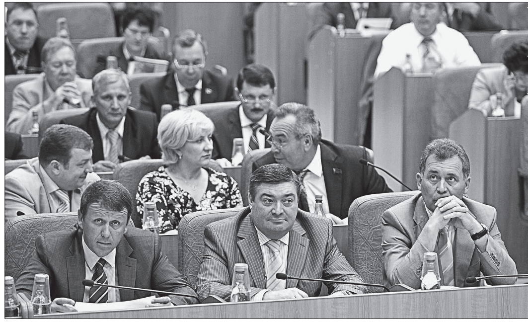
В зале, где проходила сессия.