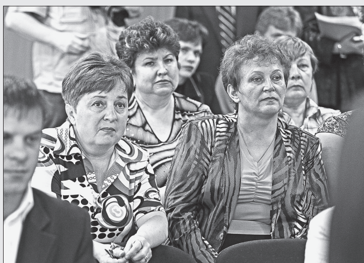
На встрече с губернатором пришли педагоги гимназии №3.