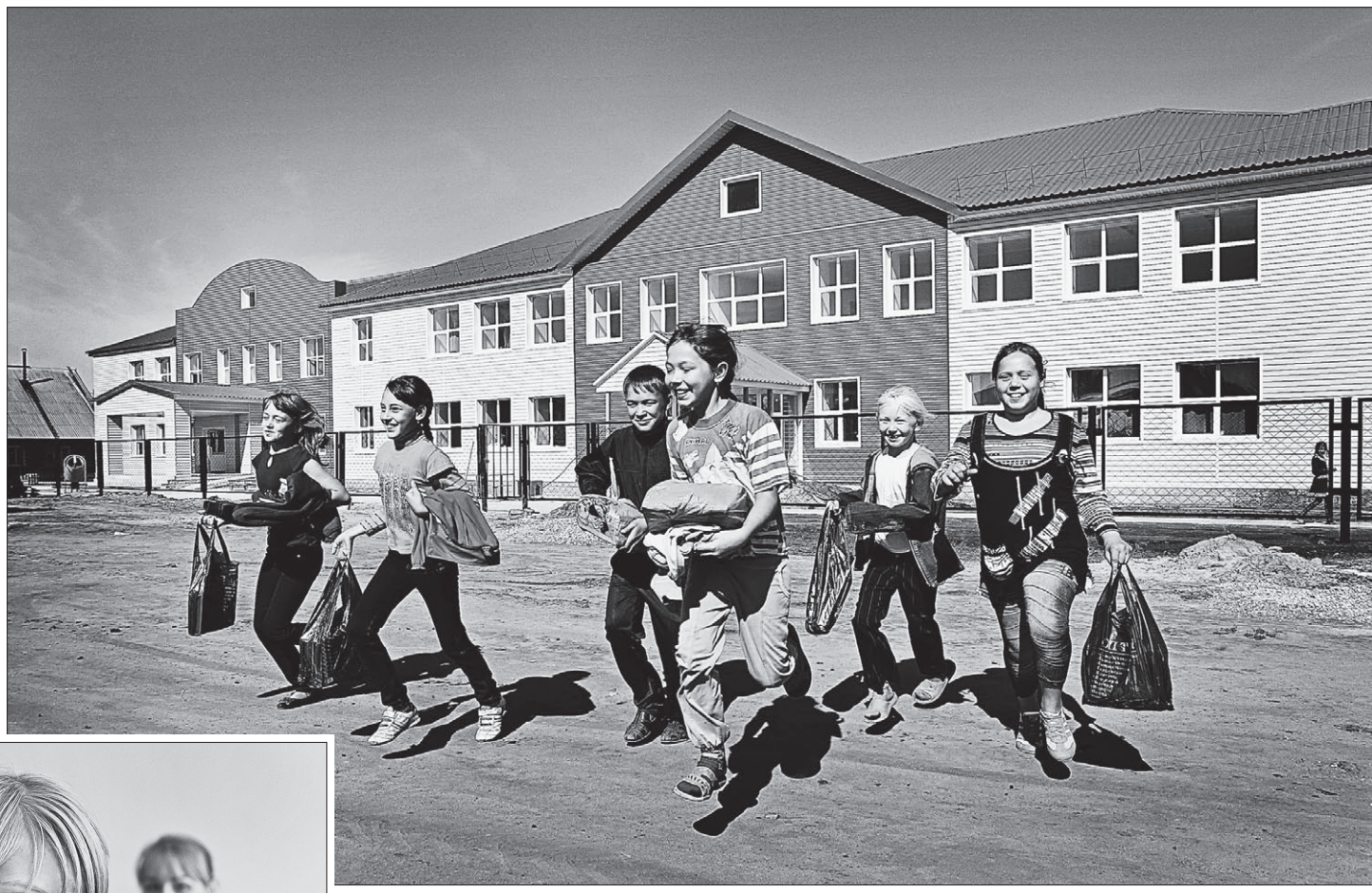
Им здесь учиться.

- У нас был выбор между этим образовательным учреждением и спорткомплексом в Тюменцево. Решили строить здесь. Ключи - перспективное село с развивающимся хозяйством. У ребят появится возможность учиться