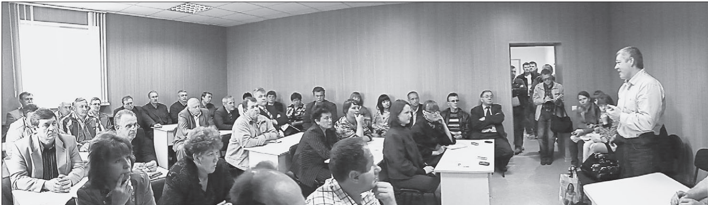
Участники «круглого стола» обсудили проблемы диверсификации сельхозпроизводства.

– Мы преследуем несколько целей. Во-первых, снижаем себестоимость ржаной муки. Дело в том, что наше производство ежемесячно потребляет чуть более 100 тонн такой муки, а пшеничной – более 1000. И нам дорого