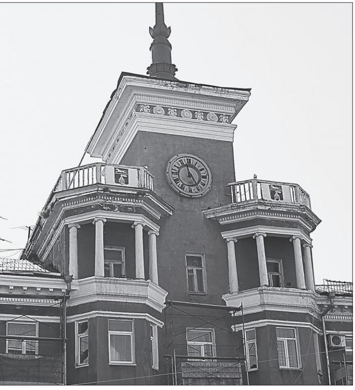
Дом под шпилем на площади Октября.

Некоторые часы в краевом центре показывают точное время только два раза в сутки