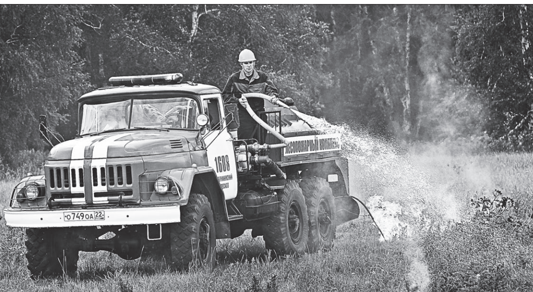
Еще одно изобретение: зажигательный аппарат, который создает встречный огонь, чтобы подавить верховой пожар.