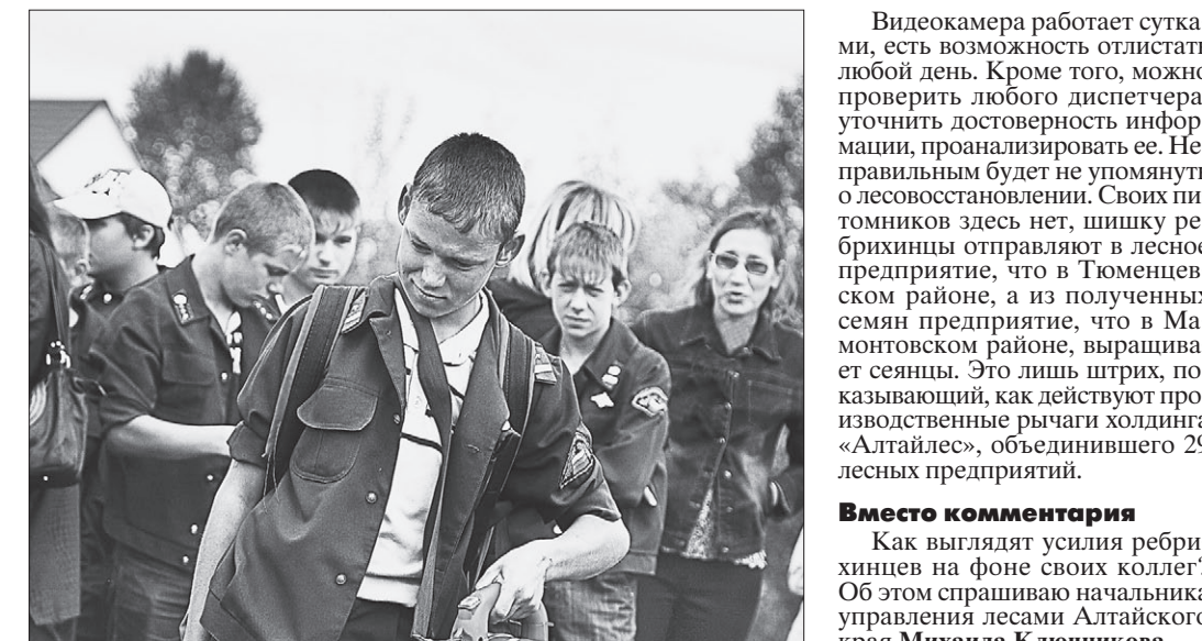
Юные лесоводы учатся обращаться с воздуходувкой.

Пожароопасный сезон длится с весны до самого снега. В арсенале предприятия – пожарно-химические станции первого и второго типов, где находится сразу порядка 10 автомобилей АРС-14. Они непосредственно работают на охрану леса: тяжелые трактора (они нужны для опашки очагов огня). Установлены две видеокамеры на наблюдательных вышках (их пять). Ноу-хау – видеонаблюдение, которое действует без кабеля на расстоянии. «Такого в крае наверху нет ни на одном предприятии отрасли», – слышу такую реплику от ребрихинцев. – У нас есть проблемный угол – левая сторона от стан-