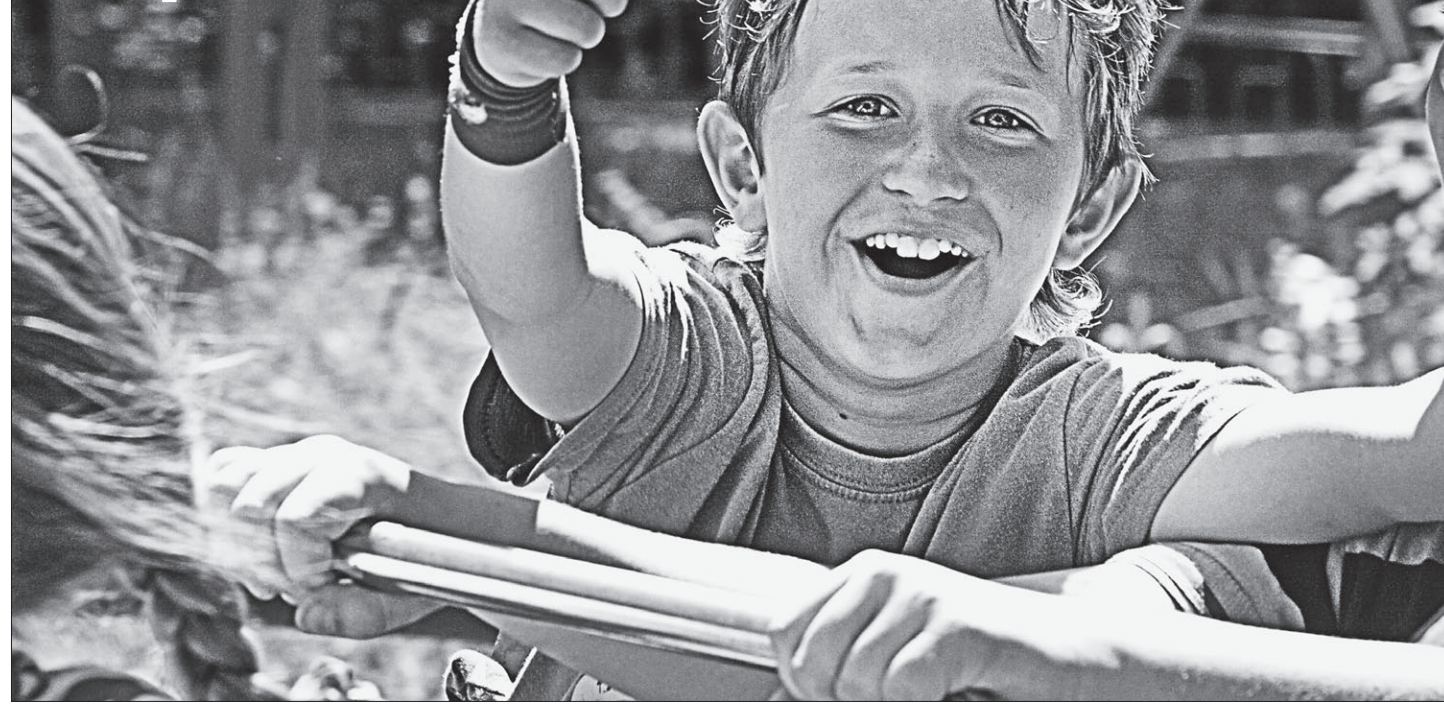
«Прокатился с ветерком!»

В Барнауле нуждающиеся ребятишки получают бесплатные билеты на аттракционы