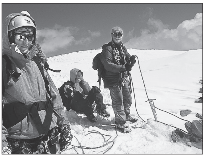
Короткий отдых альпинистов.

На сей раз объектом для восхождения была избрана вершина в районе устья Актру. Ранним утром 6 августа на автомобилях выехали из Барнаула. Чувский тракт сильно удивил ветеранов, ведь каких-то три десятилетия назад до альпинистов «Актру» добирались с двумя ночевками. А тут после обеда были в Курае, далее на вывешенной тропе дошли до «ЗИЛ» по