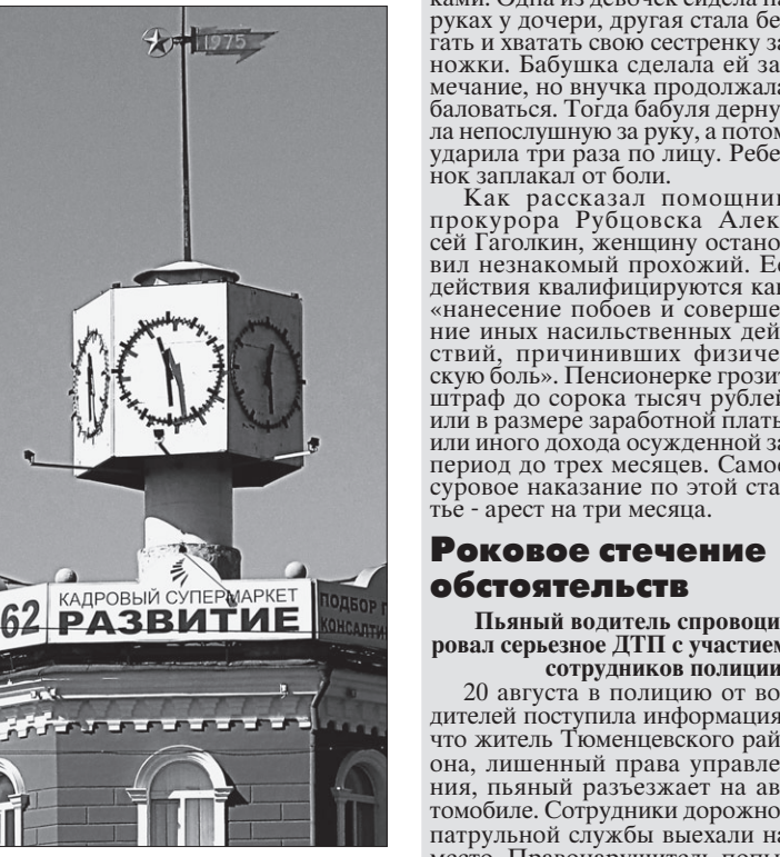
Площадь Победы: часы идут, но часы стоят.

Некоторые часы в краевом центре показывают точное время только два раза в сутки