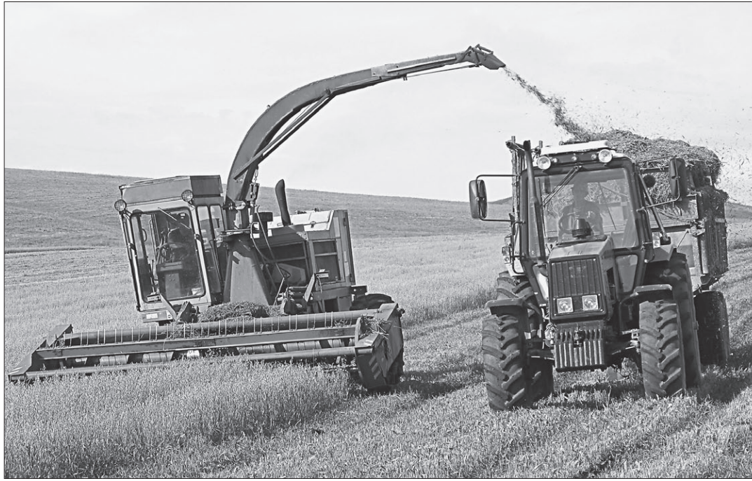
Посевы моносортов (смесь пшеницы, овса, ячменя и гороха) дают самую сочную зелень.

Чтобы добраться до механизаторов, ведущих косовицу зеленым косогорам, от центральной усадьбы села Маяк ехать пришлось почти до самого села Сосновка. По едва заметным в траве дорогам на директорской «Ниве» мы прыгали с горки на горку, пробивались низинной вдовь ручьев, пока не увидели вдали комбайн и трактор с тележкой. Они завершали жатву посевов моносортов. Когда сельхозтехника остановилась возле нас, кузов тележки уже был доверху наполнен сочной зеленой массой. Пока трактор отвозил ее к месту закладки сенажа, у комбайна его сменял грузовик «Урал» с не менее просторным кузовом.