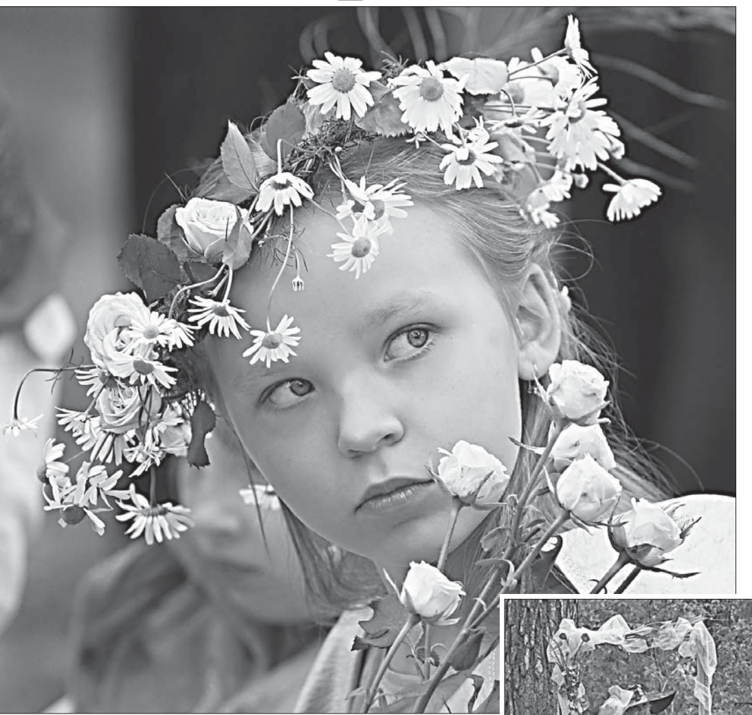
Венки из роз и ромашек пользовались популярностью среди участниц фестиваля.