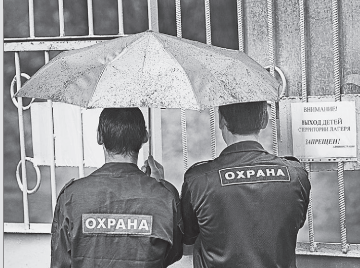
Охранники на территории лагеря следят за порядком круглосуточно.

в загородных учреждениях. Они расписывают программу на весь сезон, поэтому «пионером» скучать некогда. К примеру, утром в лагерь приезжали сотрудники ГИБДД и рассказывали, как вести себя на дорогах, а на вечер запланирован конный курс фотоклажей. Пролитый дождь не помешал ребятам сделать веселые снимки и соединить их в одну картинку.