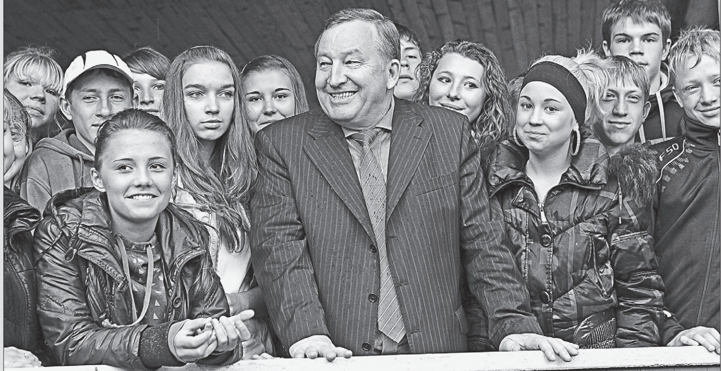
Ни губернатору, ни ребятам дождь не испортил настроение.

Новосибирска могут с пользой провести летние каникулы. За каждым отрядом, состоящим из сорока пяти человек, следят два воспитателя и два вожатых. В основном это учащиеся Барнаульского педагогического колледжа №1. С апреля студенты проходят шестимесячную подготовку по работе с детьми и успешно практикуются