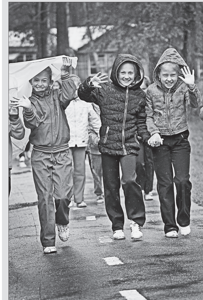
От улыбки в «Березке» становится светлей даже в непогоду.