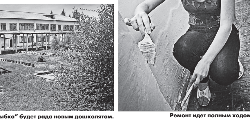
Ремонт идет полным ходом.