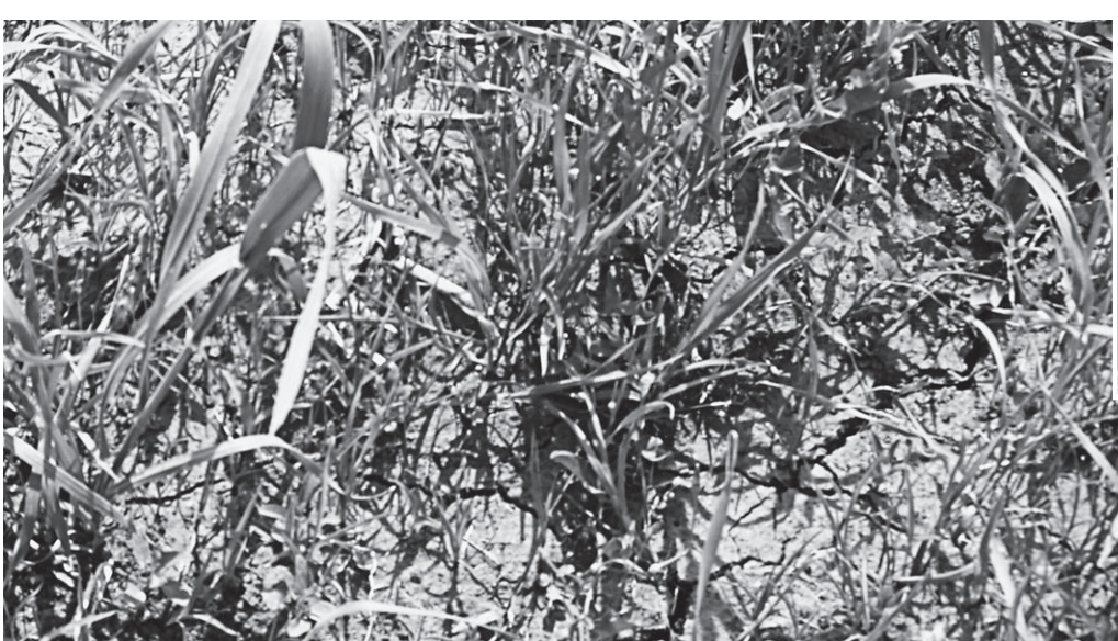
Суховой рвёт землю и уничтожает посевы.

В Шипуновском районе природа в очередной раз показала свой порок. В двух сёлах - Ильинка и Тугозново - за весну и два летних месяца не было дождей. К тому же земли здесь ушли в зимовку 2010-2011 гг. без влаги.