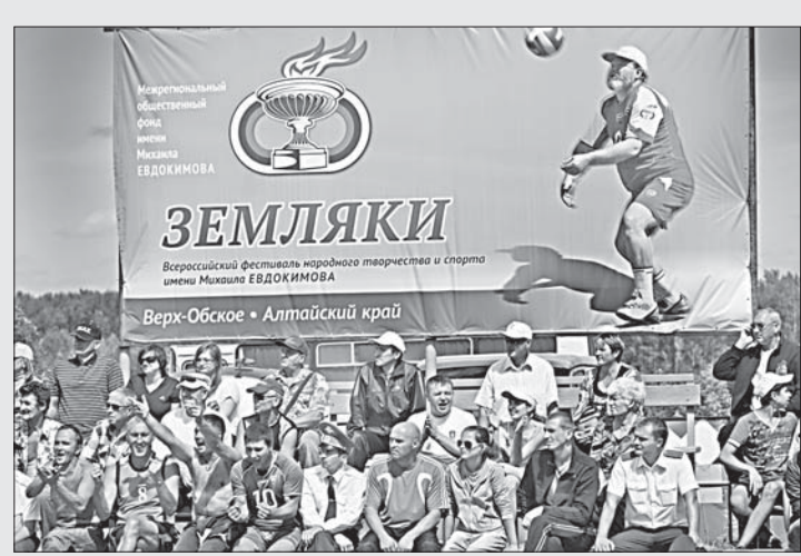
Фестиваль «Земляки» проводится уже в двадцатый раз.

Все победители получили награды, подарки, медали и кубки из рук почетных гостей фестиваля.