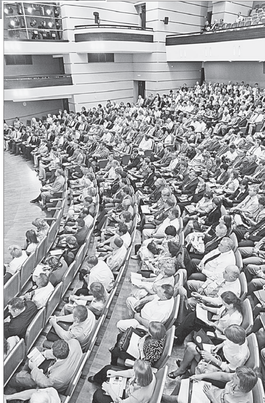
В зале – потомки переселенцев.