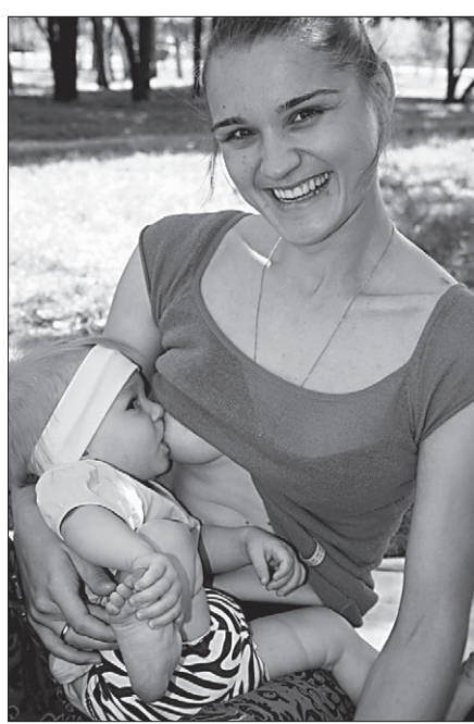
Вите скоро будет годик, но от мамино молока он пока отказывается не собирается.