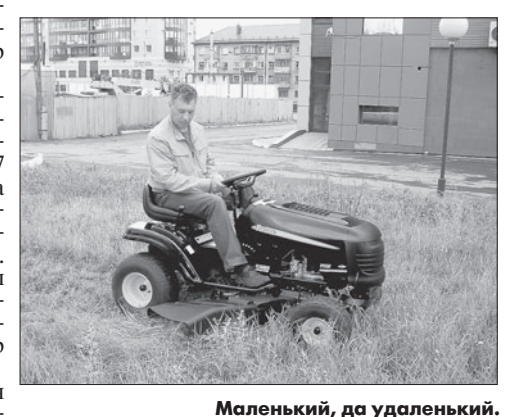
Маленький, да удаленький.