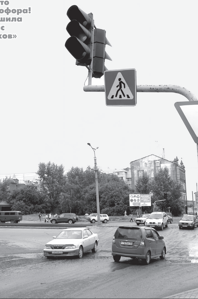
Один из самых бойких перекрестков в Барнауле - улицы Гоголя и пр. Красноармейский.