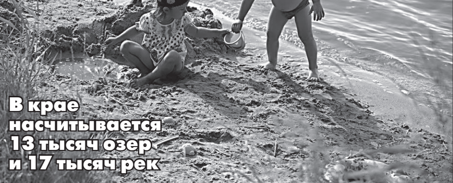
Взрослые, будьте внимательны: идиллия может обернуться бедой!