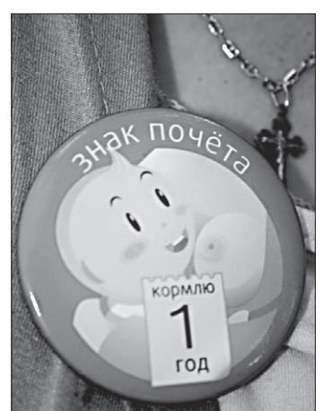
Многие мамочки пришли на акцию во с такими почетными значками.