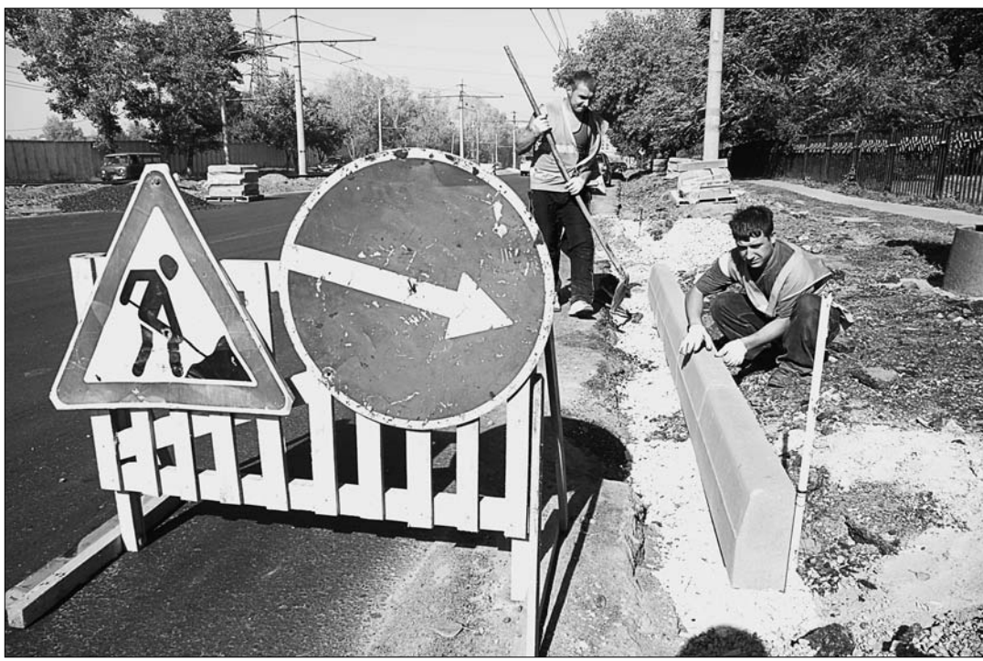
Дороги и внутридворовые территории в Барнауле преображаются на глазах.

— фирма известная. Взлетно-посадочная полоса Барнаульского аэропорта сегодня принимает самые большие самолеты в мире «Русланы» благодаря этой компании. И верхнее покрытие на ВПП — асфальтовое. Это совпадение меня радует: ведь можем!