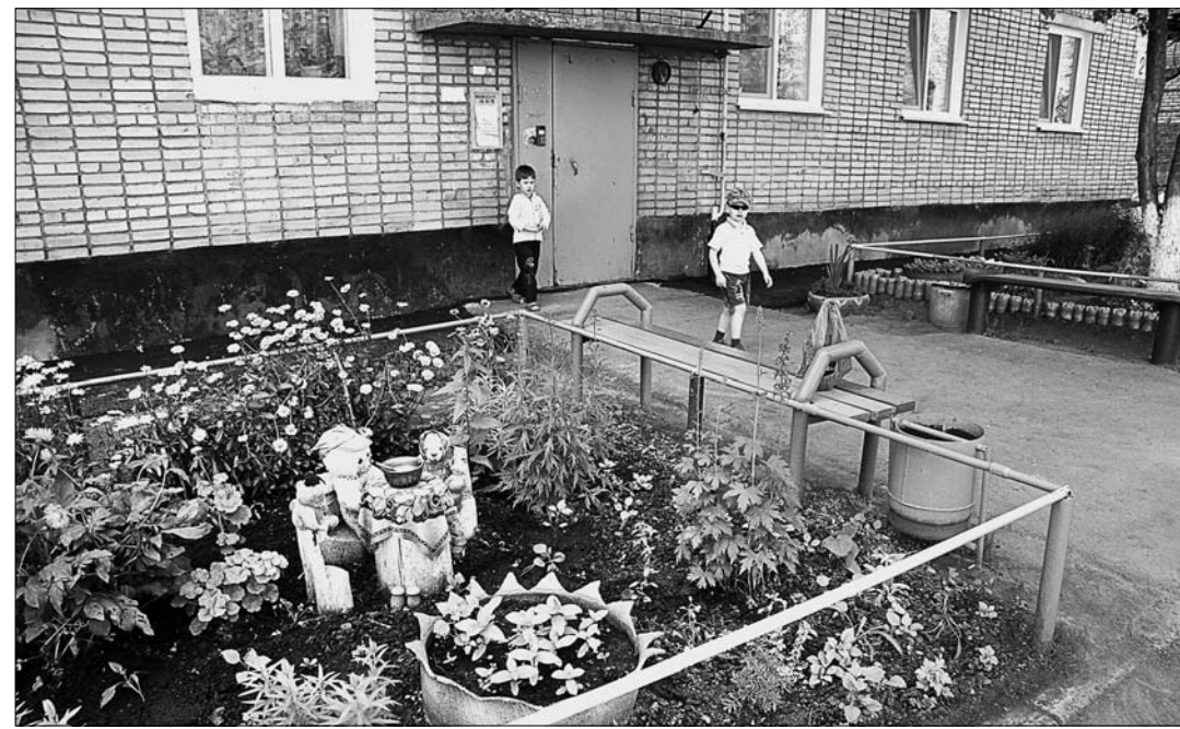
Покажи мне свой двор, и я скажу тебе, кто ты.

- А если сказать проще, по-человечески? - не отстаю от него. - Была бы жалоба, - соглашается он. - Одна. В прошлом году. Ее адресовали напрямую в крайуправление по ЖКХ. Граждане просили разобраться в том, что их дом не попал в программу капремонта.