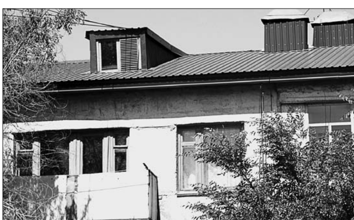
Добротная кровля - тоже великое дело. Особенно, когда лет 20-30 ремонта не было.