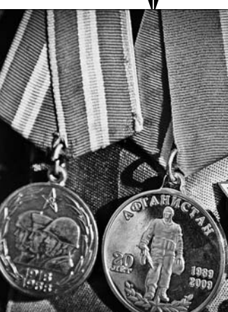
Боевые награды в мирное время.

тывается сто участников военных конфликтов, в том числе 24 «афганца».