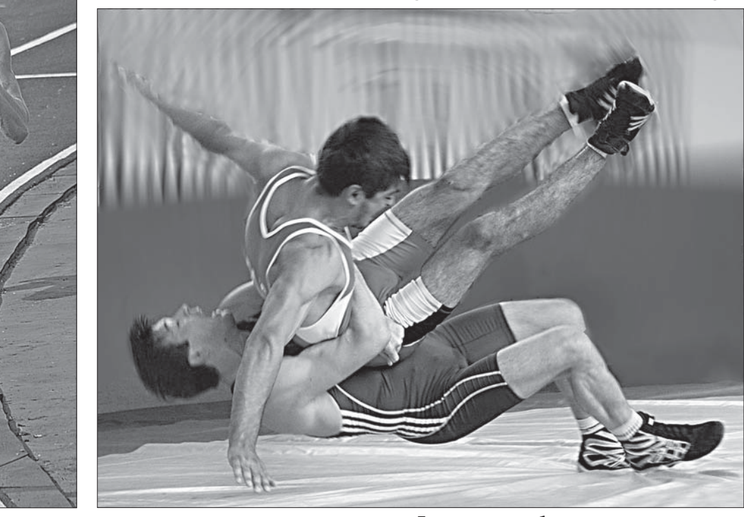
Борцы-классики блистали своим мастерством.

перехитил Пунич. На последних метрах забега Юрий вновь взвил темп и всего на одну секунду опередил своего конкурента. Увлекательной получилась противостояние двух бегунов и на 800-метровке, где камениский спортсмен уверенно взял реванш у славгородца.