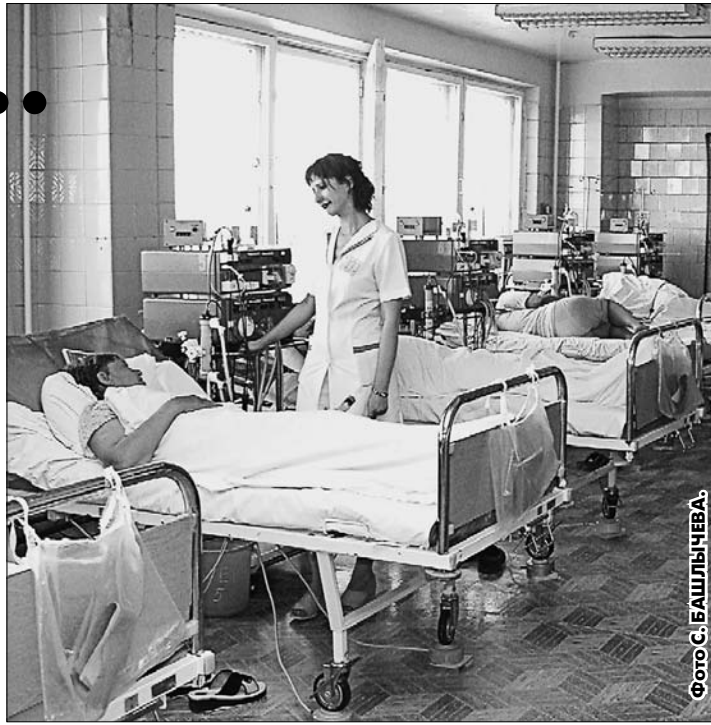
Число нуждающихся в гемодиализе сейчас больше, чем тех, кто лечится.

Еще один способ помочь таким людям - трансплантация органа. Не все знают, что с конца 80-х до 2002 года в Барнауле сделали более 300 операций по пересадке почек. Но противоречия в законодательстве на том этапе стали поводом для закрытия специализированного отделения. Теперь оно возобновило работу в строящемся корпусе краевой больницы. Для приобретения оборудования будут использованы в том числе 43 млн. руб. «семиплатиновых» средств. Специалисты обещают, что операции по пересадке начнутся через два года. Тем, кому поспешивать «пользоваться» чужой почкой, врачи обещают минимум 10 лет жизни, по международным стандартам, хорошего качества. Получить такой