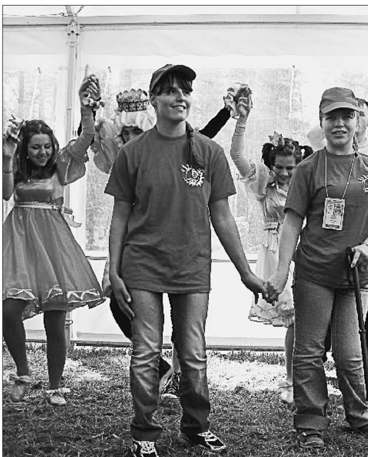
Концерт-выступление площадки «Парус».