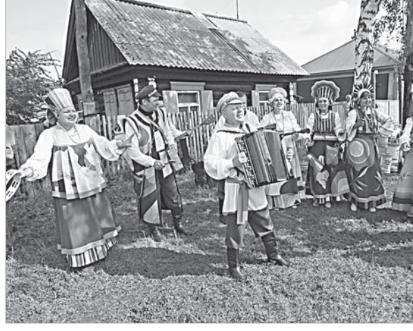
На празднике в Сrostках.

«Историй» осуществляется за счет средств губернатора в сфере культуры – спектакль покажут в Бийске и Сrostках. Также впервые в селе состоится концерт полубоившейся многим пермской группы «Земляки», прежде они выступили на празднике лишь с отдельными номерами.