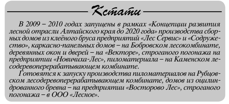
В 2009 - 2010 годах запущены в рамках «Концепции развития лесной отрасли Алтайского края до 2020 года» производственные сборные дома из клееного бруса предприятий «Лес Сервис» и «Содружество», каркасно-панельных домов - на Бобровском лесохозяйственном, деревянных окон и дверей - на «Векторе», строганого погонажа на предприятии «Новичиха-Лес», пиломатериала - на Каменском лесоперерабатывающем комбинате.