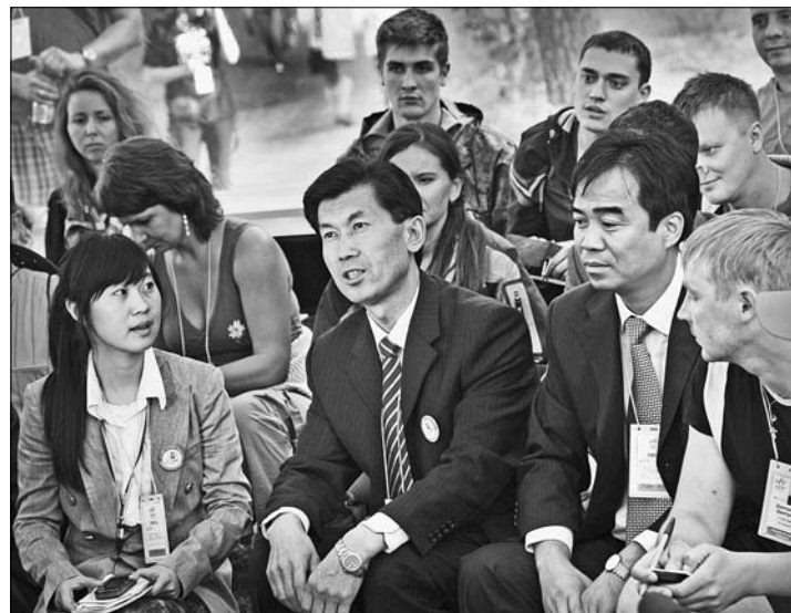
Делегатам КНР на форуме очень понравилось.