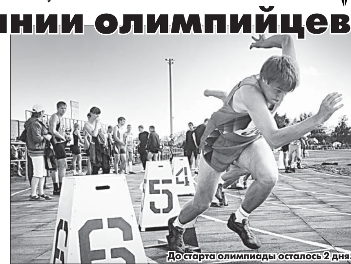
До старта олимпиады осталось 2 дня.