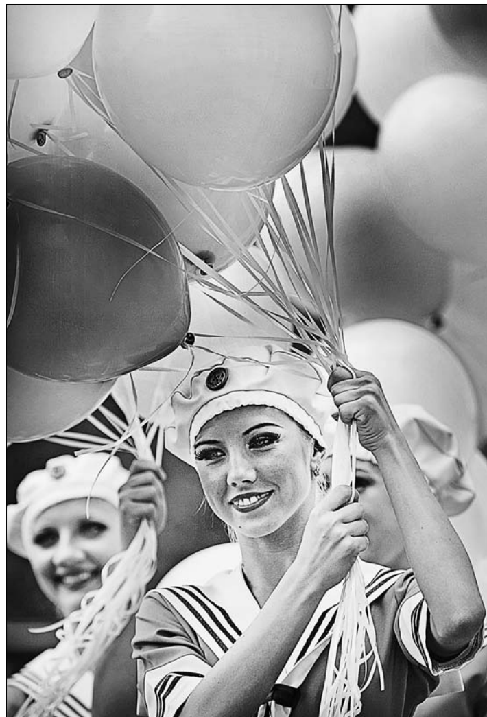
Через мгновение шарики под восторженные крики ребят взмыли в небо.

правильно и оперативно транслировать идеи, мысли, проекты, которые будут представлены на форуме как можно большему количеству молодых людей. Расчет на то, что все участники и все эксперты по приезде домой станут в каком-то смысле посланцами Алтайского края, представят наш регион в наилучшем свете. Этому должны способствовать и удивительное по красоте место проведения форума, и содержательная образовательная программа, которую обеспечили эксперты и тренеры самого высокого уровня, и нормальные бытовые условия.