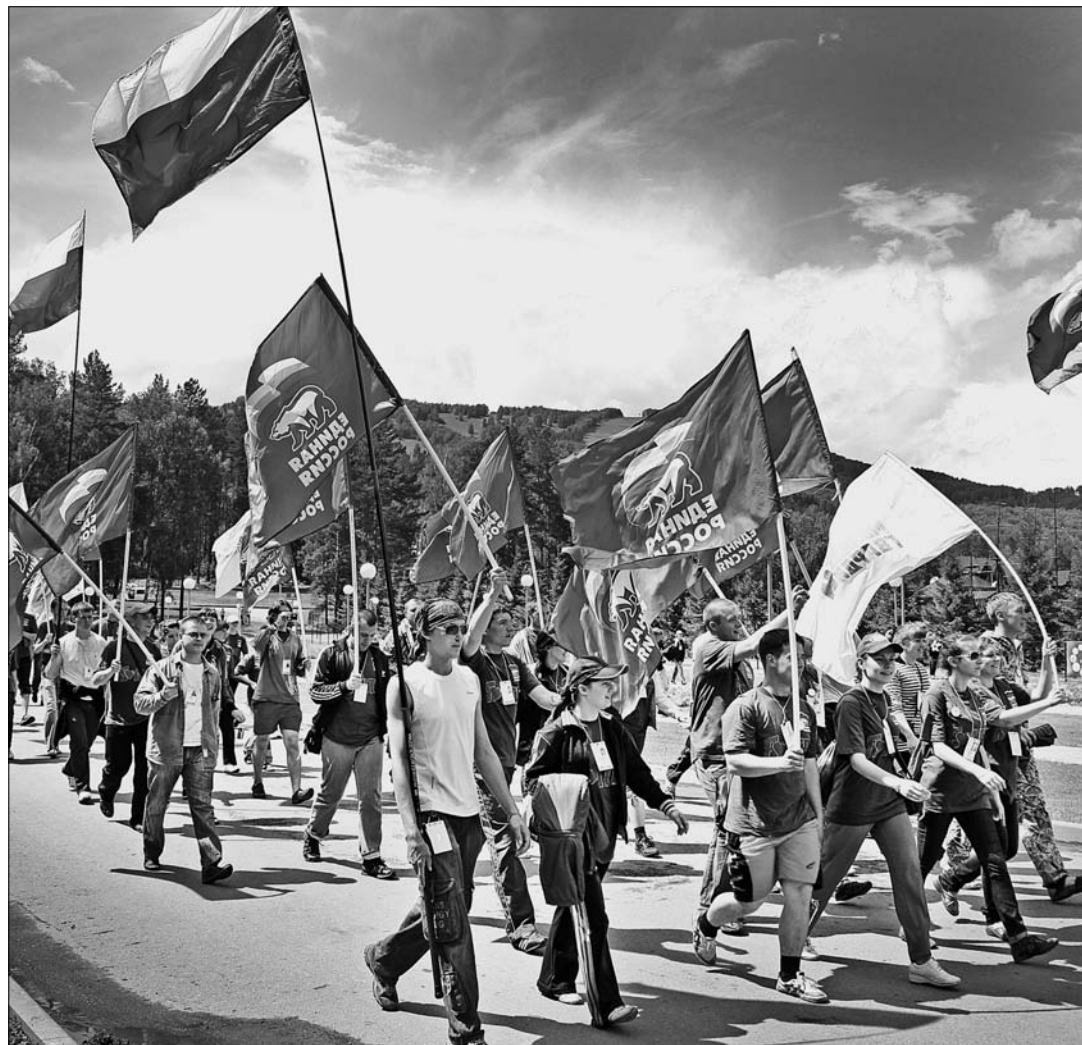
Все - на праздник!