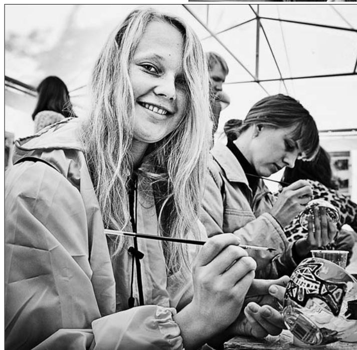
У участников форума была возможность заняться творчеством.