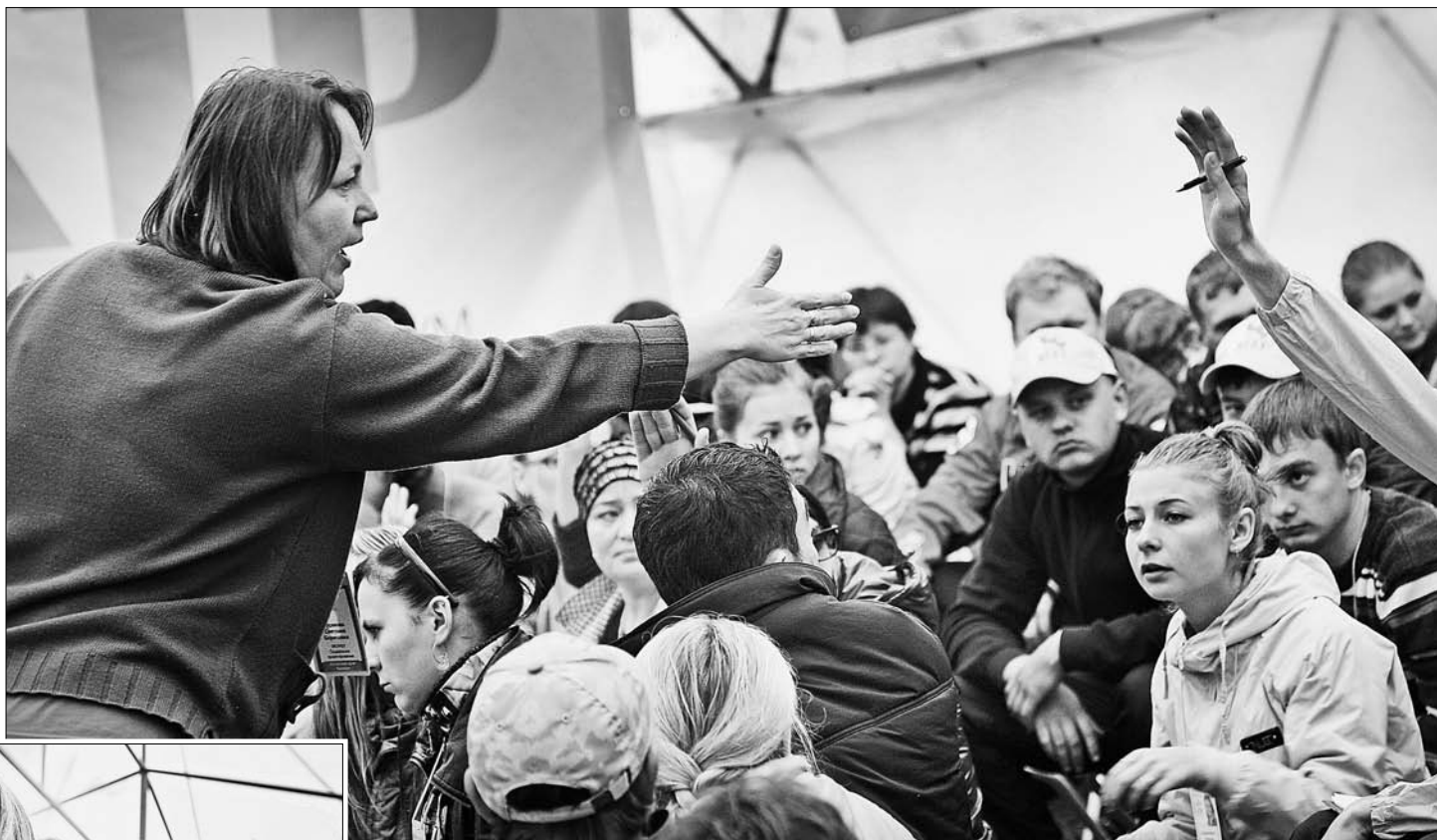
Вот так бурно проходили семинары по социальному проектированию.