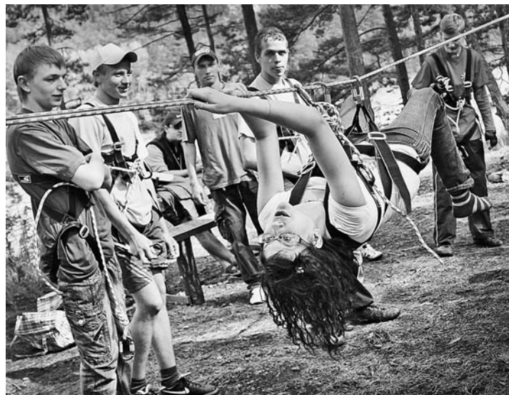
Туристы к тренировкам относились со всей серьезностью.

лей в рамках перечня инициатив «Мое предложение губернатору», но пока его судьба не определена.