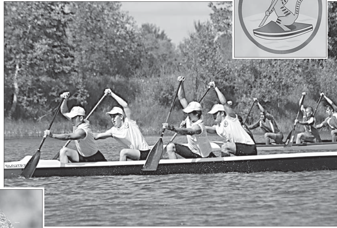
«Оп, оп, оп!»: в такт гребут каноеисты.