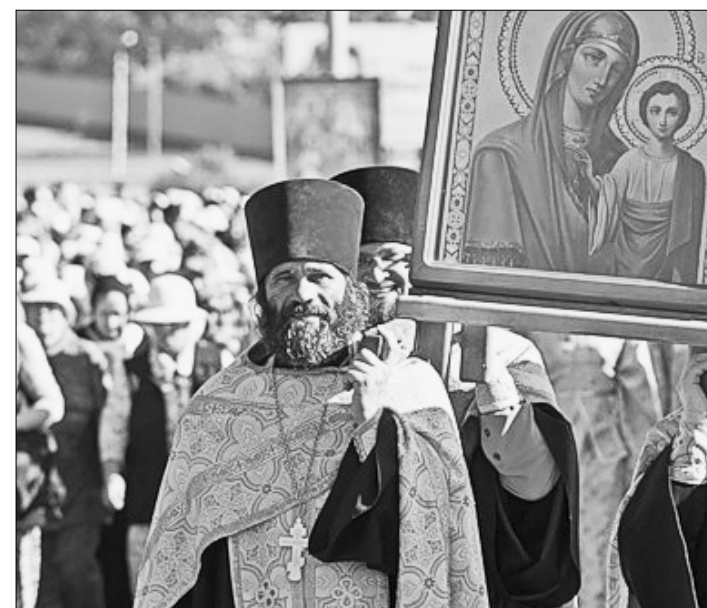
Крестный ход взял старт в Барнауле.

Как сообщили «Алтайской правде» в Барнаульской и Алтайской епархии, чудотворная икона из Коробейниково с 2002 года занесена в список для общего почитания в России. С 1906 года она находилась в православном храме этого старинного алтайского села. В советское время храм был превращен в зерносклад, а одна из больших икон - Казанская стала служить половой плахой. Священный лик был полностью испорчен, но чудесным образом восстановлен после того, как икону тайно перевезли в Барнаул, где она хранилась несколько десятилетий. В 1994 году святыню вернули в Коробейниково, паломниче-