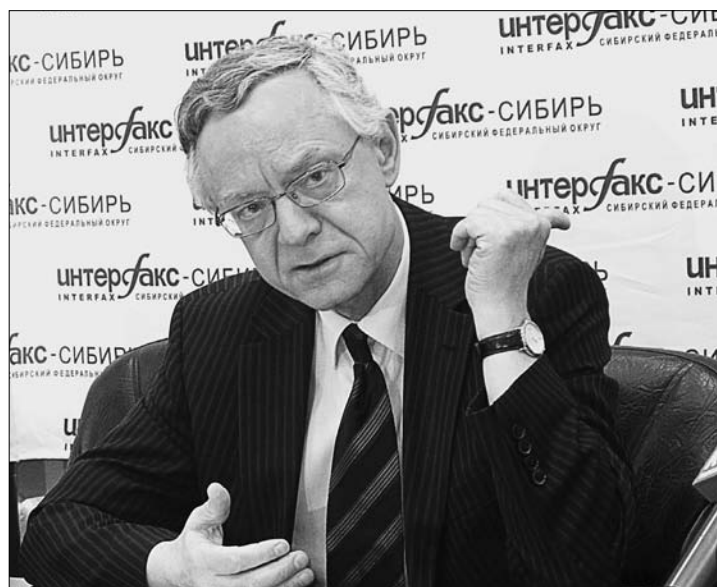
Непонимание между нами осталось позади.

- Если мы не будем бережно относиться к ним и эффективно использовать, то продолжим тратить огромные деньги впустую, в то время как могли бы потратить средства на новые технологии, развитие и стабилизацию нашей экономики, социальную сферу, поддержку проектов, которые принесут пользу обществу. Если компании затрачивают огромное количество энергии для производства той или иной продукции, то страдаем мы, потребители, и сколько переплачиваем за нее деньги. Наши страны могли бы найти здесь много общих точек для сотрудничества. В прошлом году во время визита Президента России Дмитрия Медведева в Данию вопросы энергоэффективности были приоритетными на всех встречах, а в апреле нынешнего года визита Председателя Правительства РФ Владимира Путина встречался с руководителями нескольких датских компаний, успешно сотрудничающих с Россией на протяжении последних лет, две из которых сегодня присутствуют на краевой конференции. В сентябре состоится визит в Москву ко-