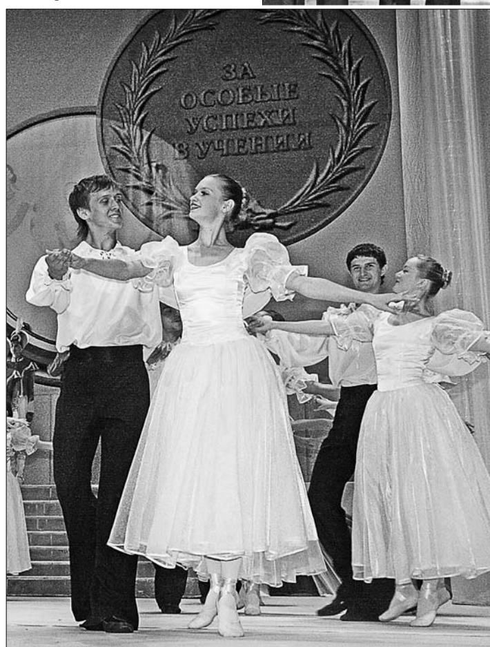
На балу все должно быть настоящим.

После торжественной части все выпускники вышли к знаку нулевого километра возле Главпочтамта. Там они отпустили в небо сотни воздушных шаров и загадали желания - обязательно поступить в вуз... ЦИФРА Более 12 тысяч человек окончили школы края в этом году.