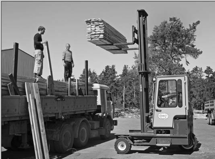
Лес не только рубят - его перерабатывают.