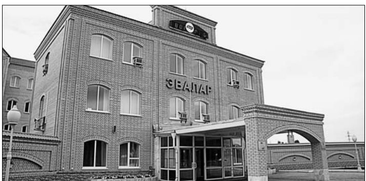
Продукция «Эвалар» известна всей стране.

Так было положено начало большому пути, пройденному за это время и администрацией края, и законодателями. Разработанный в нашем регионе проект «Комплексное развитие Алтайского Приобья» подвергся самому широкому общественному обсуждению и получил одобрение Комиссии правительства России по вопросам агропромышленного комплекса. И, несмотря на то, что федеральный закон еще только предстоит