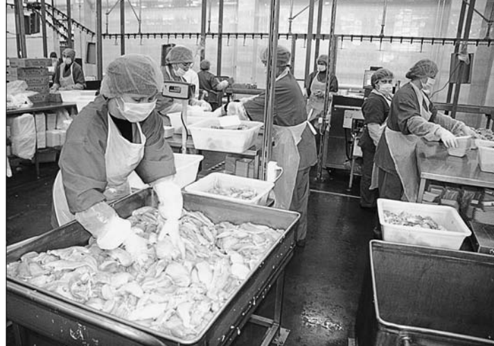
Сенаторы побывали в цехах «Алтайского бройлера».

принять, как минимум двадцать крупных сельскохозяйственных инвестиционных проектов уже находятся в стадии реализации, причем все это и происходит в рамках «Алтайского Приобья».