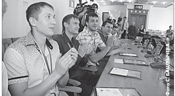
Игроки «АлтайБаскета» на приеме в администрации края.

Вчера в краевой администрации состоялось награждение барнаульской команды «АлтайБаскет», занявшей второе место в чемпионате России в высшей лиге.