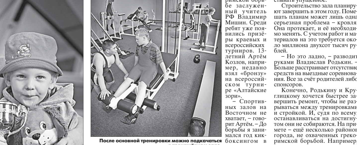
После основной тренировки можно подкачаться в тренажёрном зале.