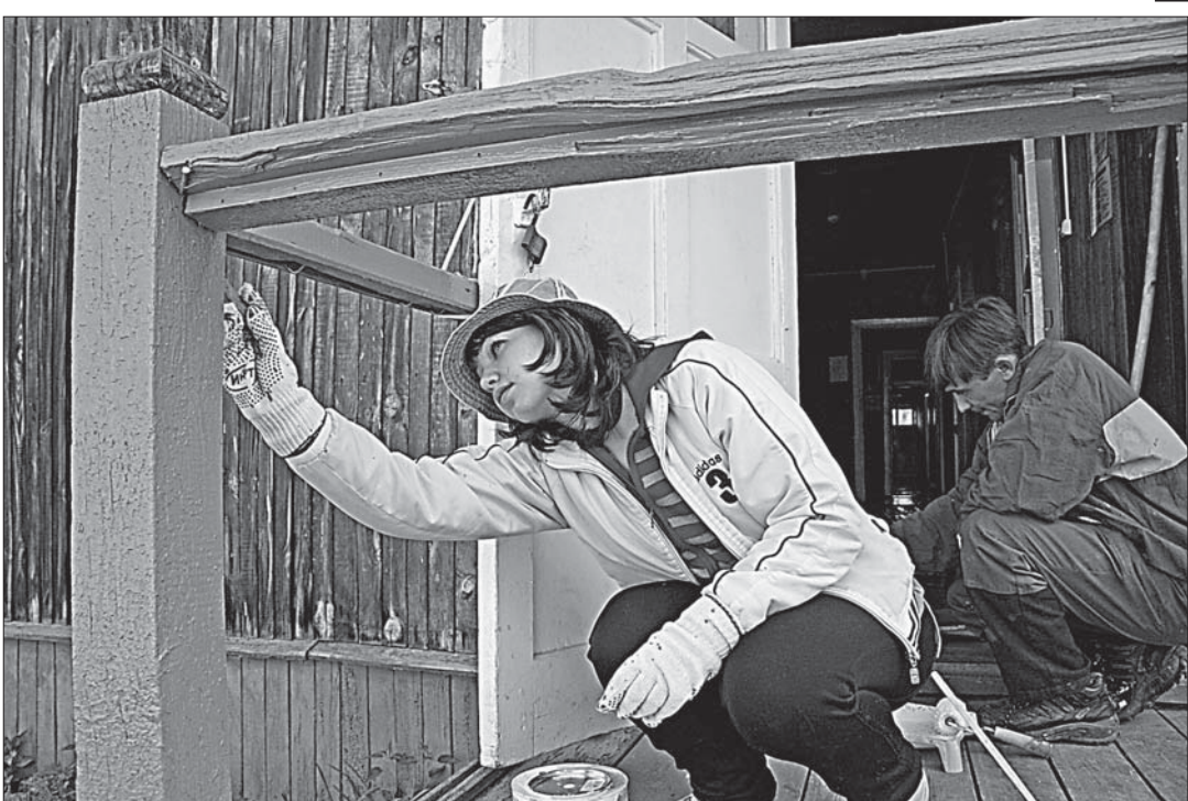
«Уже крылечко красим, до прищипки высохнет»

(Начало на 1 стр.) Автономная пожарная сигнализация установлена в каждом корпусе... Об этом сообщает РИА «Новости» со ссылкой на пресс-службу аэропорта.