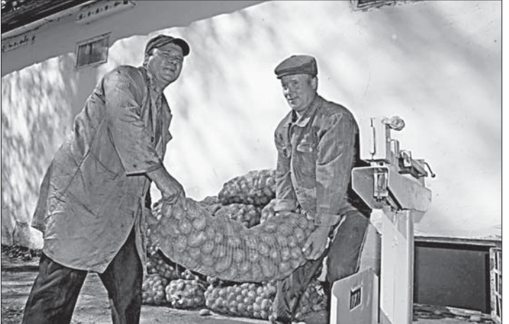
Раз картошка, два картошка и еще... мешков немножко! Заполняют закрома лагеря «Березки».

и делам молодежи разрешило проведение третьей, полноценной (21 день) оздоровительной смены. Не в ущерб профилем, которые будут объединены в одну: в лагере отдохнут и знатоки правил дорожного движения, и юные пожарные, и поклонники бардовской песни.