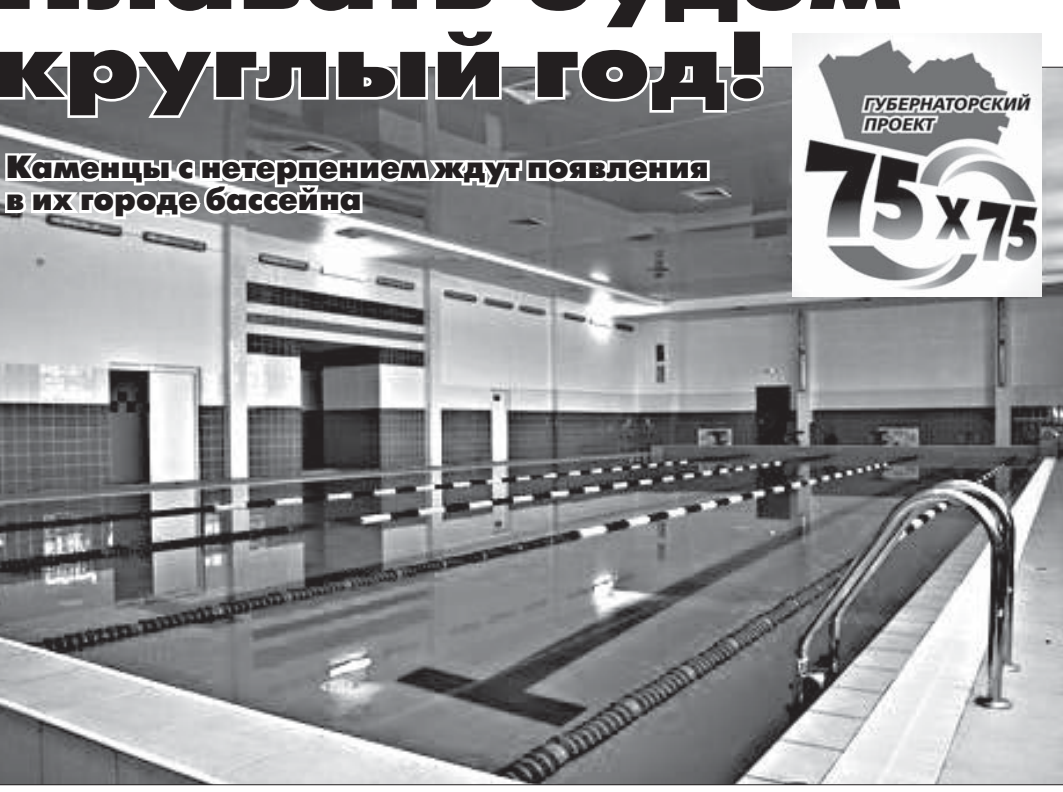
Бассейн спортивной школы Новосибирска, который строила компания «Водный мир». Точно такой же будет и в Камне.

В июне 2010 года в губернаторскую программу «75х75» было включено строительство в Камне-на-Оби спорткомплекса с плавательным бассейном. Сегодня работы уже ведутся, в декабре заказчики и подрядчики намерены ввести его в эксплуатацию.