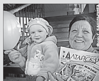
Будем рады нашей встрече!

Напоминаем, что в июне заканчивается подписная кампания на 2-е полугодие 2011 года. Приглашаем всех желающих оформить подписку в отделениях связи. 3 июня в Центральном отделении почтовой связи г. Барнаула - День подписчика с 10 до 14 часов. Всех подписавшихся в этот день на 2-е полугодие 2011 года ждут призы от газеты «Алтайская правда».