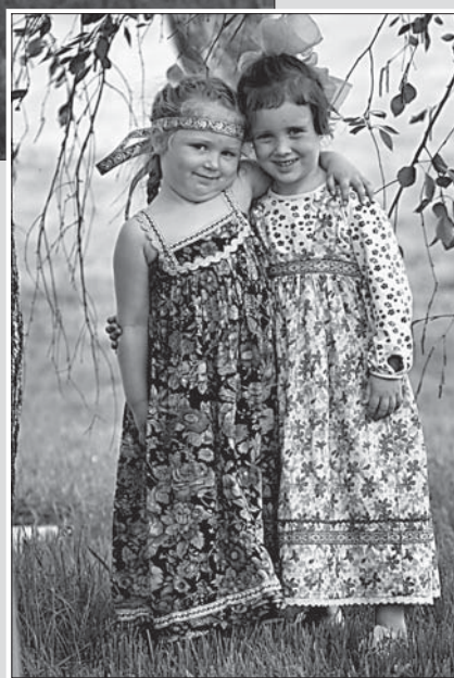
▲ Юные жительницы села Новотырышкино.

Есть и этномузей. В нем туристы могут увидеть старинные орудия труда и быта, которыми пользовались алтайцы, телеуты, кумандинцы. Весь музейный комплекс состоит из нескольких объектов: исторический тир, музей малочисленных коренных народов Алтая. Здесь же находится и главный бубен Алтая. С помощью