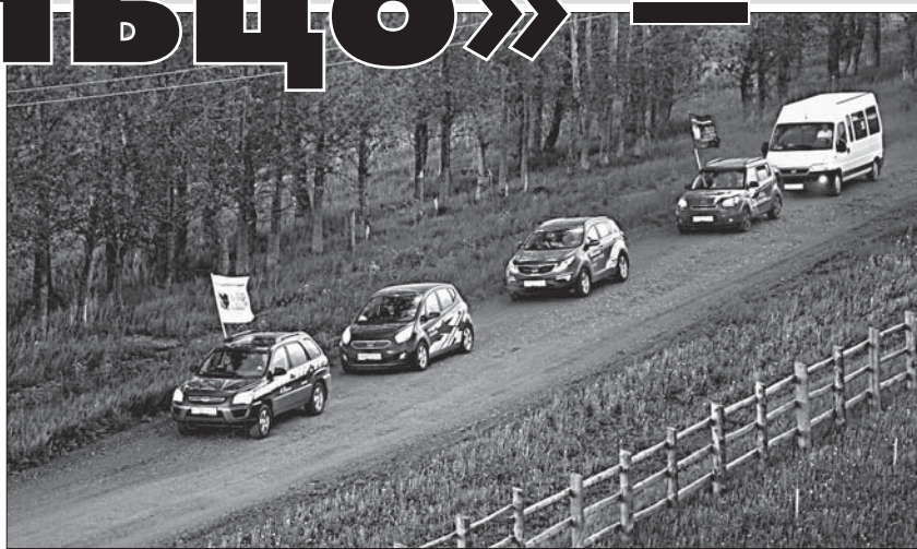
В пути участники автопробега.