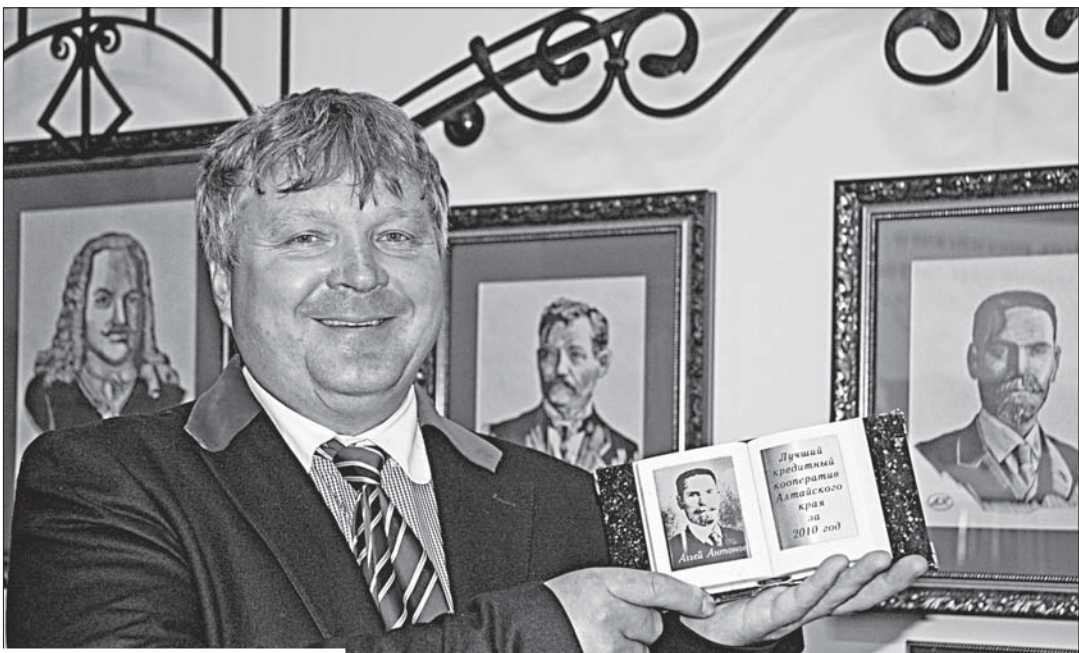
Среди кредитных потребительских кооперативов лучшим названа «Касса взаимного кредита» (г. Белокуриха).