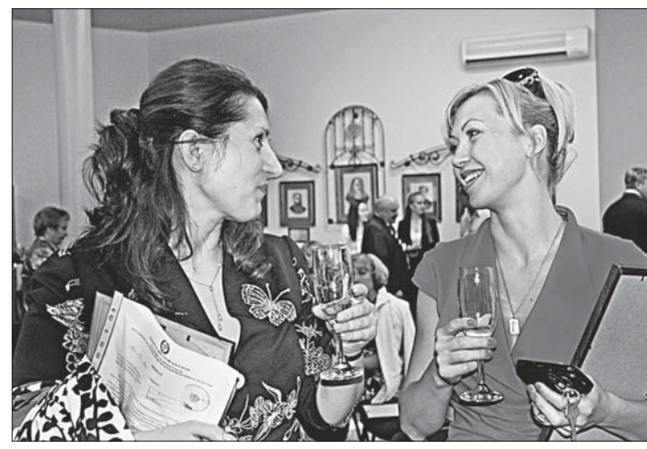
А это бизнес-леди из «Агрофирмы «Иван-3» и «Милстрой-Сибириня».