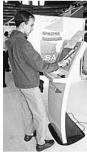
Большой популярностью пользуются информационные киоски службы занятости.

шении него определенные выводы, и в случае появления вакансии у «резервиста» больше шансов занять ее, чем у человека со стороны. Кроме того, по результатам работы мы даем рекомендации. Даже в том случае, если студент потом идет работать в другой банк.