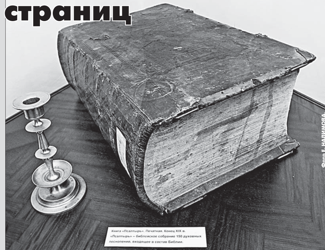
Книга «Псалтырь». Печатная. Конец XIX в. «Псалтырь» - Библийское собрание 150 духовных песен, входящее в состав Библии.

Это «Псалтырь» - одна из 29 наиболее редких книг XVII-XIX веков, выставленных в краеведческом музее Барнаула. Печатная книга насчитывает 2000 страниц (их специально пересчитали сотрудники музея), она была необходима в жизни православного человека, по ней учили детей в церковно-приходских школах, проводили все обряды и служения.