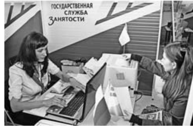
Одновременно ярмарки вакансий состоялись во всех центрах занятости населения региона, связанных в единое информационное пространство.

службой занятости. Очень довольны и программой стажировки молодых специалистов. Ведь требования у нас довольно серьезные, особенно на вакансии экономистов, бухгалтеров, менеджеров, технологов швейного производства.