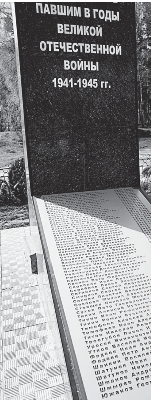
Галина Колесникова у обновленного мемориала. «Надо никого не забыть...»

Желтые листочки - это не фигура речи: так в деревне называют список, составленный лет 30-40 назад. Список отпечатан на машинке, бумага желтая, даты составления, фамилии или хотя бы подписи составителей - ничего нет. Единственное, что дает хоть какой-то ориентир, - Б. Ключи в нем отнесены к Первомайскому району. Так что список составлен как минимум после 1966 года - до него село входило в Косихинский район. На желтых листочках