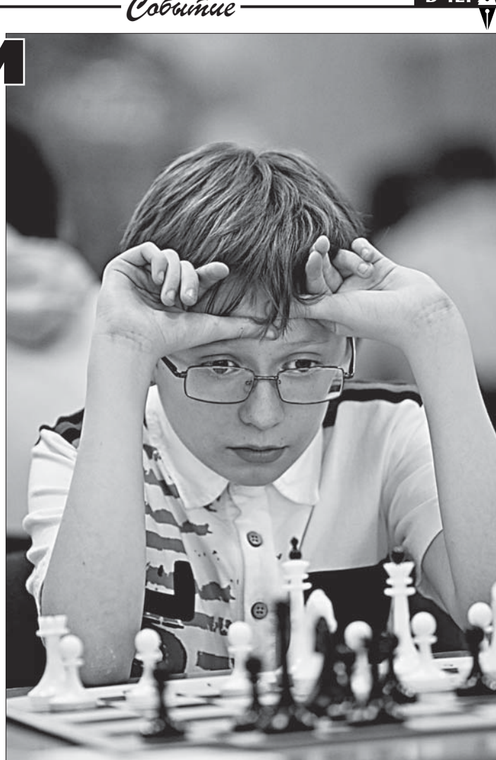
Куда же пойти?

ные!) электронные часы. Так что условия игры отличаются всем международным стандартам.