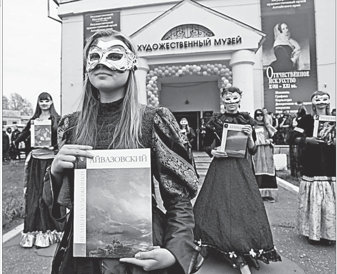
В духе карнавала. Торжественное открытие международной акции на Алтае.

Художественный музей, кажется, единственно умудрился объять все — и представил публике испанский и итальянский чаша. А выставка на космическую тему работает там уже около месяца и представляет советские