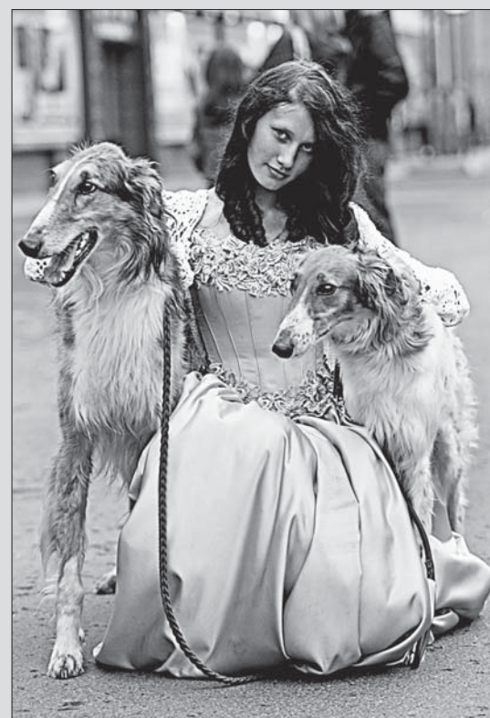
Выставка «Природа. Охота. Трофеи — 2011» открылась в музее «Горы».

— Одни провокации. Нет, это ненормально. Ужас.