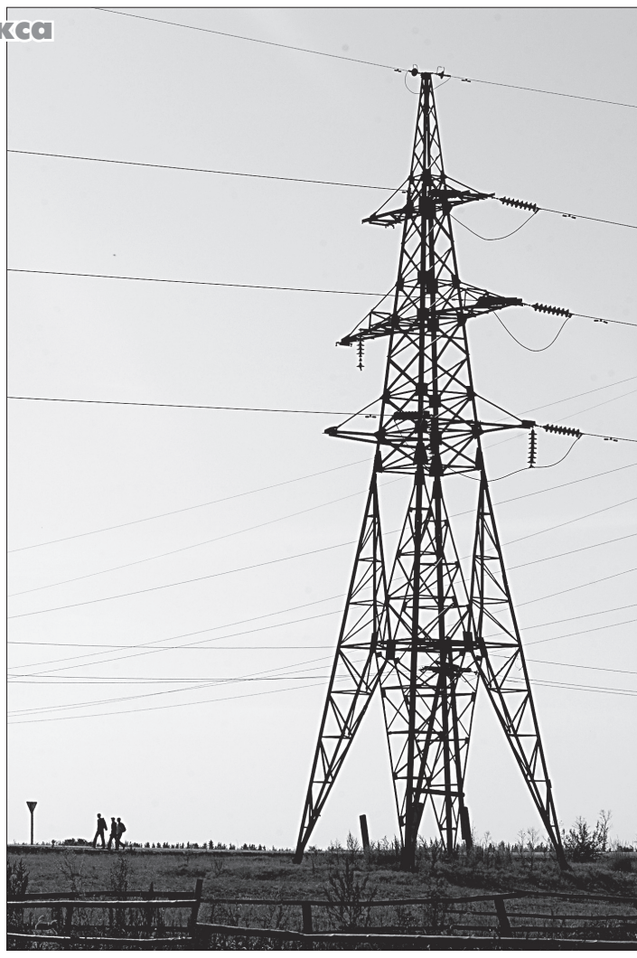
Рослые, однако, «ёлки» в хозяйстве у энергетиков!

«Будущее сибирской энергетики - за молодыми» - такими словами можно обозначить идею II конференции советов молодых специалистов (СМС). Она состоялась в Омске.