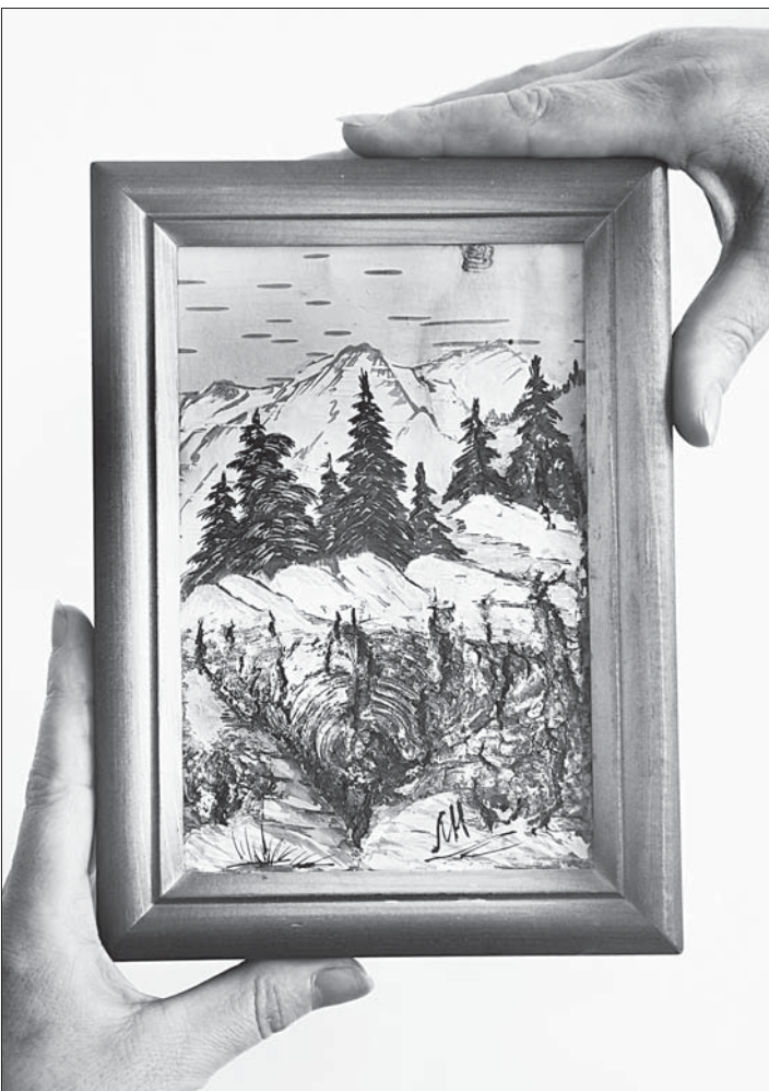
Горный пейзаж на бересте.

Известно, что березовая «одежда» на треть состоит из бетулина, который в народе называют березовой камфарой.