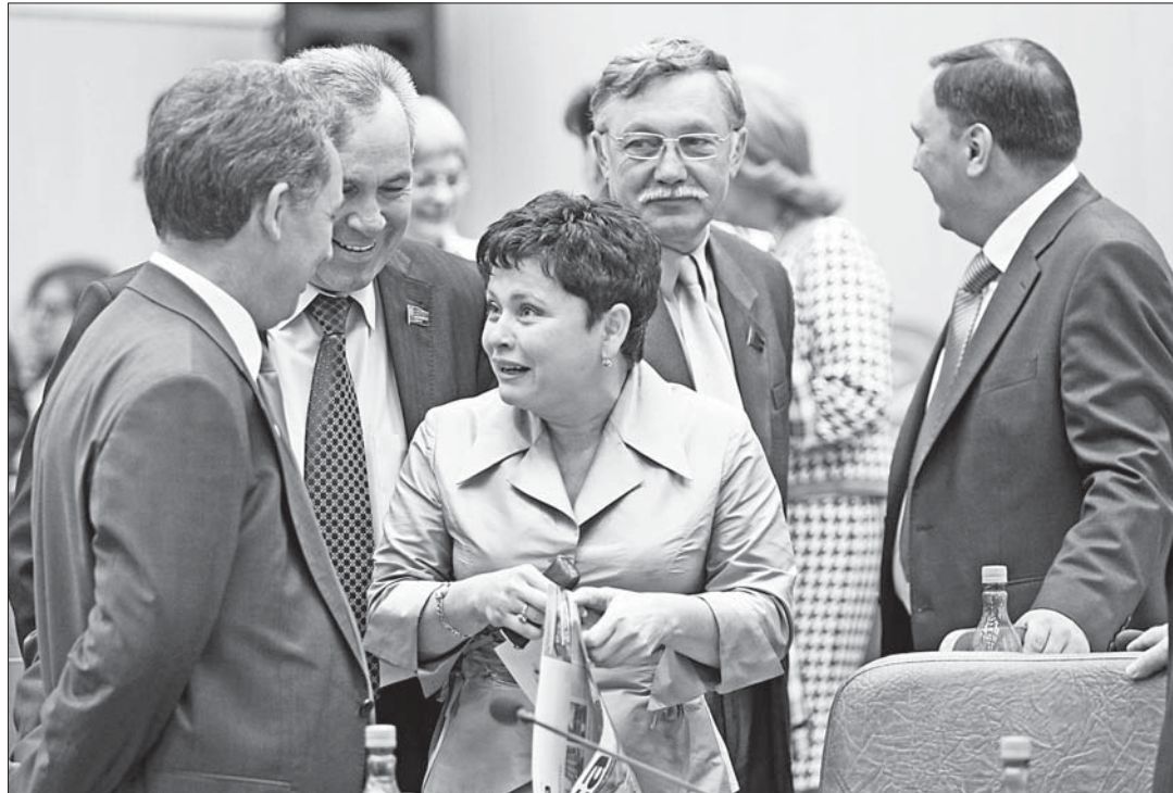
В кулуарах сессии.

тирует ситуацию председатель АКЗС. – Подобные проблемы надо решать не громкими пиар-кампаниями, а продуманной работой. Поэтому, посоветовавшись с председателями комитетов, руководителями фракций, мы приняли решение направить письмо на имя руководителя РЖД. А в том случае, если на это письмо придет отрицательный ответ, тогда на очередной сессии оформленным соответствующим образом постановлением мы обратимся к председателю правительства РФ.