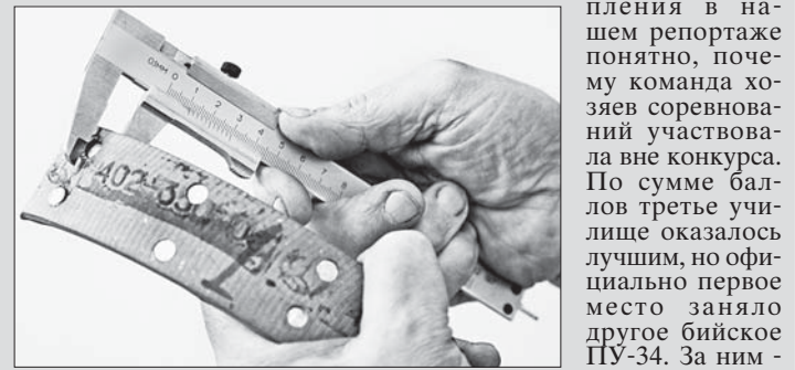
Тормозная колодка и штангенциркуль – старые друзья.