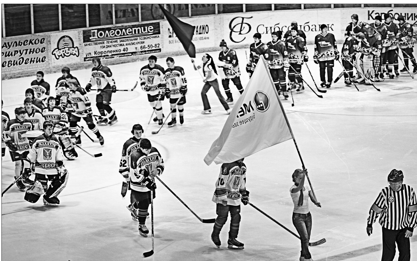
Приехавших на окружной турнир команд хоть отбавляй.

Наш регион представляют две барнаульские коман-