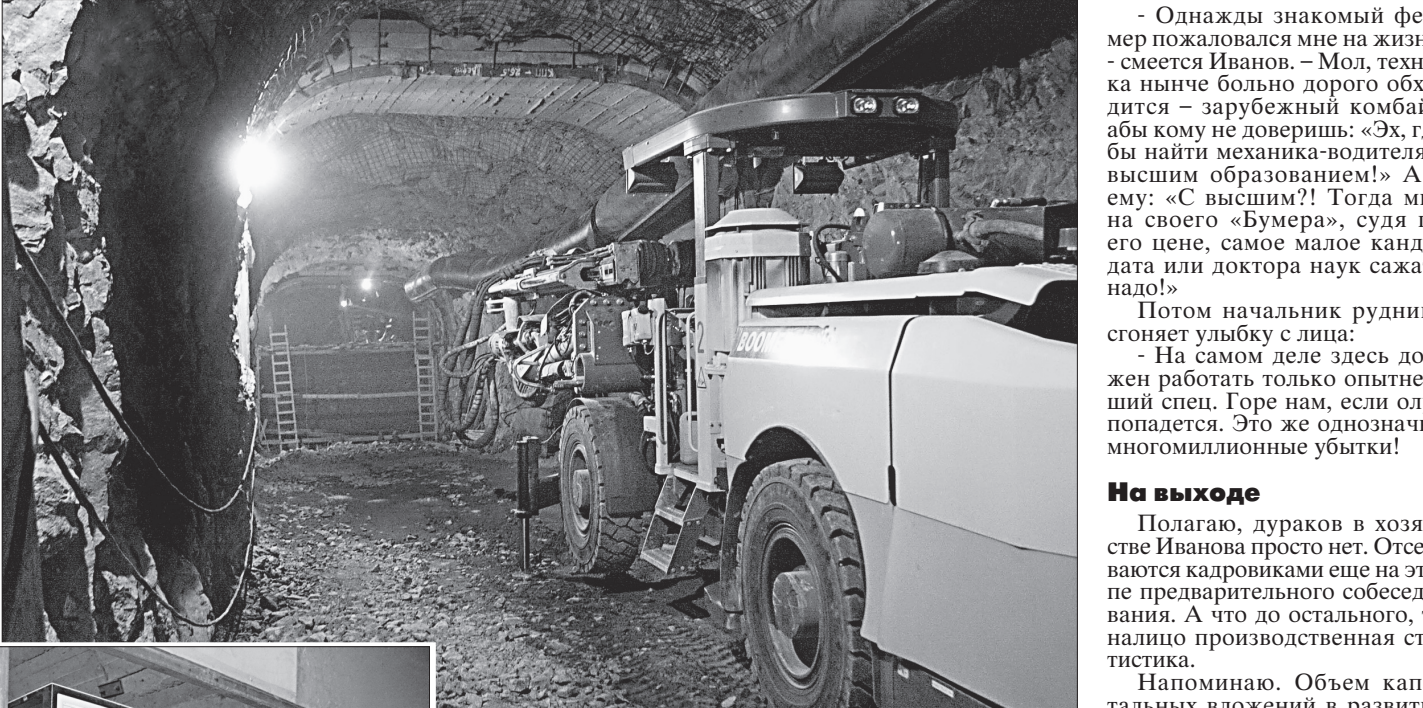
Тот самый желтый «Бумер» в горняцком интерьере. 2014 года и далее перейдем на добычу в 400-450 тысяч тонн.