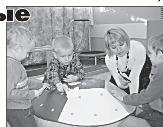
В комнате дневного пребывания.

В конце прошлой недели одна из них открыта в территориальном центре социальной помощи семье и детям Ленинского района, неделей ранее - в Индустриальном районе краевой столицы. Комнаты оснащены модульным игровым оборудованием для малышей до трех лет, лекотекой для детей до года. Предусмотрены безвозмездный прокат средств по уходу за детьми первого года жизни, а также массажа, хобби-клуб «Умный кроха» и мастерская развивающей игрушки, работа в сенсорной комнате для мам,