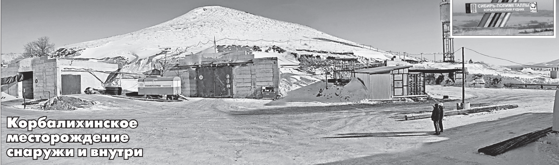
Корбалихинское месторождение снаружи и внутри