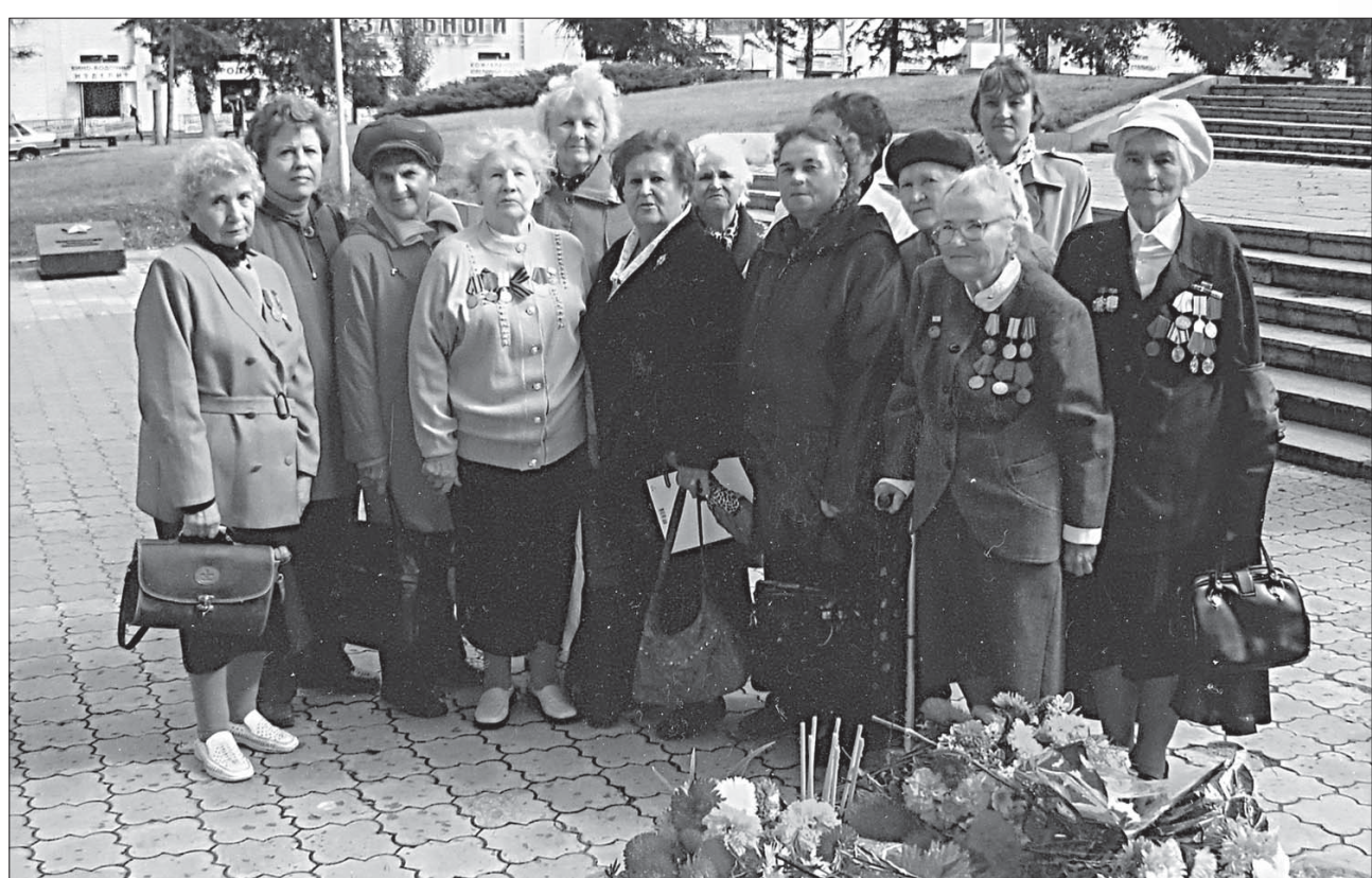
Дети блокады в День Победы на мемориале Славы в Барнауле.

67 лет назад, 27 января 1944 года, советские войска завершили снятие блокады Ленинграда