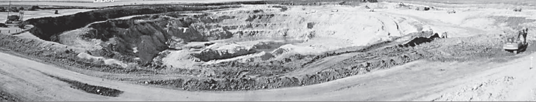
Если бы не люди и техника, то можно подумать, что здесь отлетела большая метеорит.

Один день из производственной жизни алтайских рудников