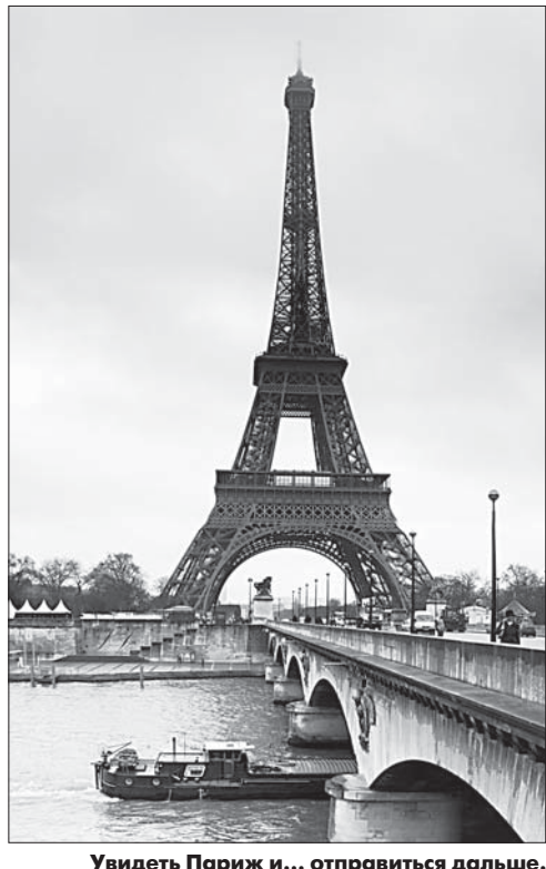
Увидеть Париж и... отправиться дальше.