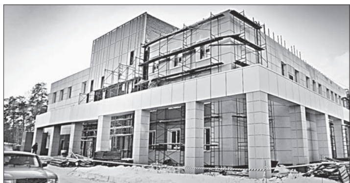
Здания радиологического корпуса (сверху) и аптеки.