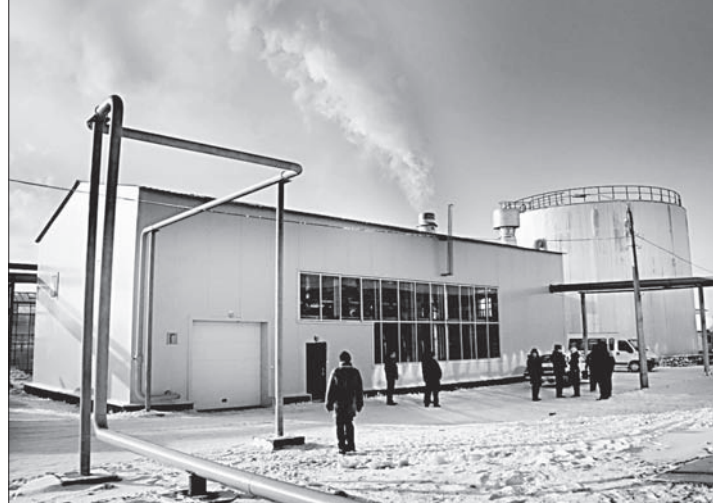
Новая котельная – компактная.