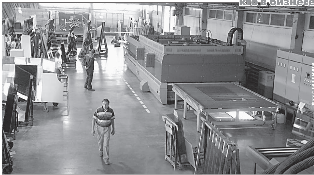
Стеклозное производство в Барнауле - очень перспективное дело.

СПРАВКА «АП». Сплошным наблюдением предполагается охватить более 390 средних, примерно 30 тыс. малых предприятий (включая микробизнес). В том числе около 3 тыс. крестьянских (фермерских) хозяйств. Отдельной строкой нужно упомянуть 58 тыс. коммерсантов-индивидуалов.