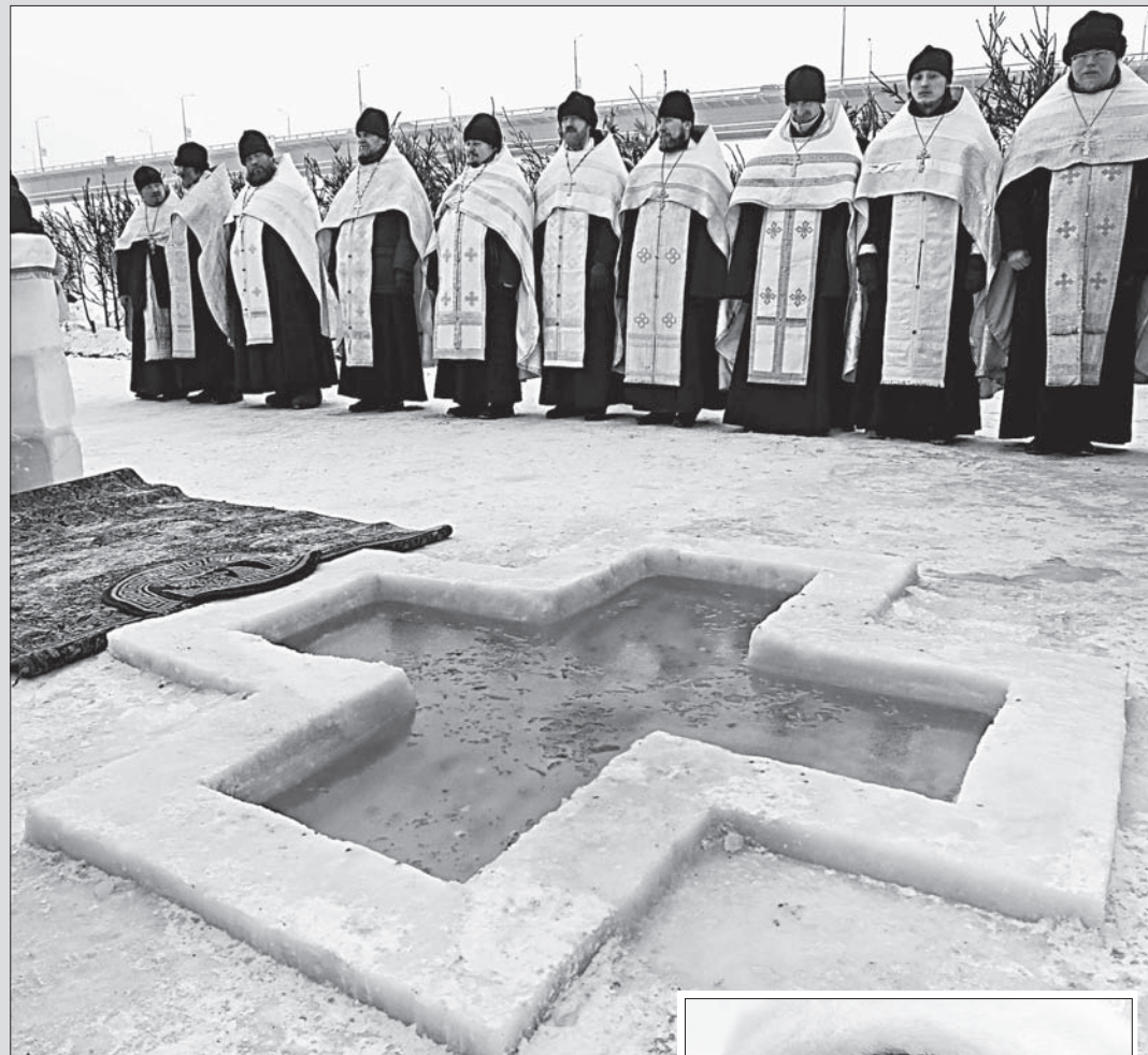
Из этой иордани верующие набирали воду.

19 января православные отметили Крещение