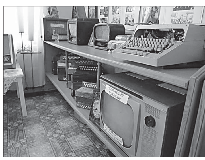
Здесь – предметы быта 50 – 60-х годов: лампы, первые телевизоры...

Теперь здесь несколько экспозиций. «Русская изба» до мелочей воссоздал крестьянский быт. В купеческой комнате за самоваром (и в окружении соответствующего интерьера и ста-