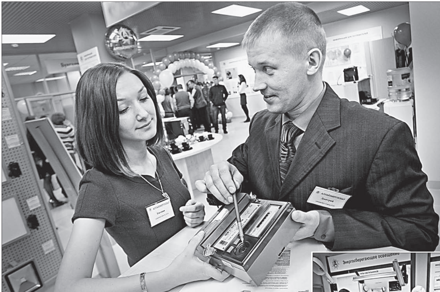
Специ центра энергосбережения растолкуют вам любую тонкость.

Новый энергосберегающий центр начал работать в краевом центре