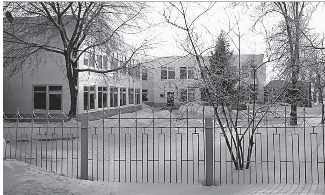
До ремонта это здание стояло с облупившейся штукатуркой, теперь радует глаз.