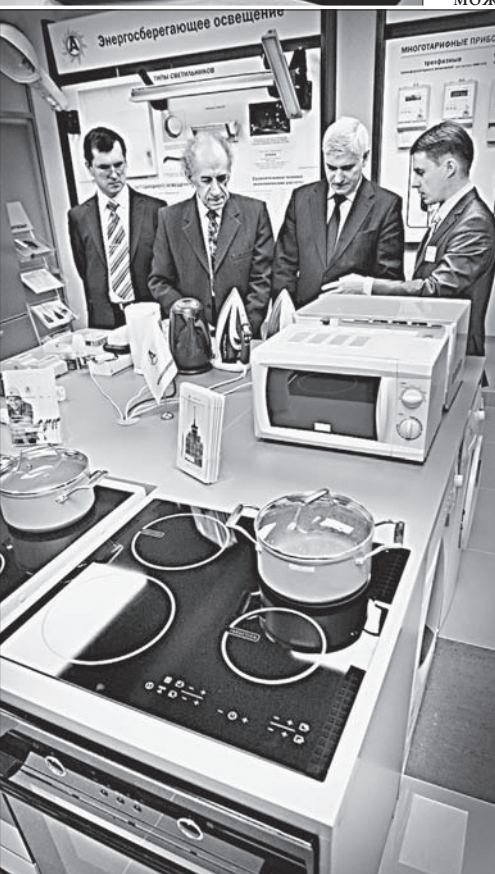
Экономить можно на всем - от «умной» электроплиты до прогрессивного утюга.