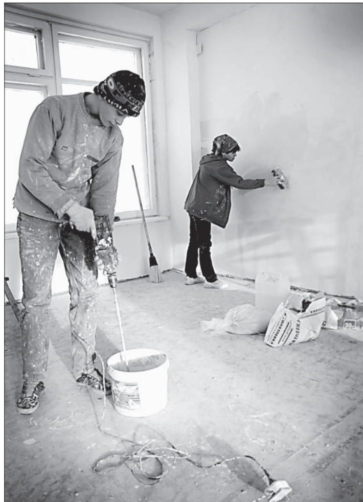
Отделочные работы близятся к завершению.

Как в Заринске решают проблему нехватки мест в дошкольных учреждениях