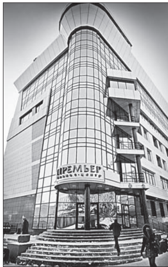
Ул. Мерзликина, 5. Бизнес-центр «Премьер».

чувством, и выразил благодарность энергетикам от имени губернатора Александра Карлина и администрации края. Так сказать, за известную трату средств и за нужную людям работу. На встрече 18 января специалисты «Алтайэнергосбыта» объяснили и показали гостям возможности современных технологий. Для сравнения демонстрировались самые обычные бытовые приборы. Получилось предметно, наглядно. Для студентов здесь подготовлены разнообразные графики со сравнительными характеристиками лампочек, утюгов, холодильников, пылесосов и прочего. Есть даже компьютерная графика стратегии «Энергомедведь». У представителей бизнеса несомненный интерес вызвал информация о передовых технологиях в области энергосбережения, консультации спонсов и возможности заключения энергосервисного контракта. В ближайших планах компании - созыв научно-технического совета по энергосбережению. В него войдут эксперты рынка, представители науки, органов государственной власти. Предполагается и создание единой базы данных по реализуемому проектам энергосбережения нашего региона и Республики Алтай.