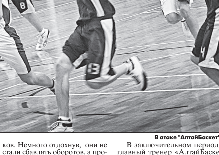
В атаке «АлтайБаскет».

Вышли, немного растерялись, все-таки они играют нечасто, тем более при заполненных трибунах, - сказал тренер. Тем не менее второй состав барнаульцев уверенно довел дело до победы - 89:62.