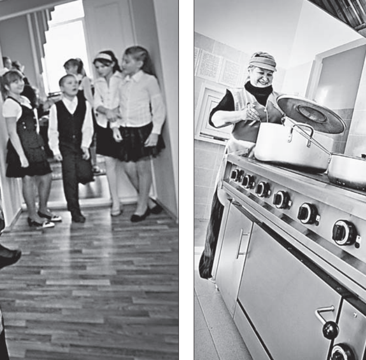
Теперь в школе есть своя столовая.