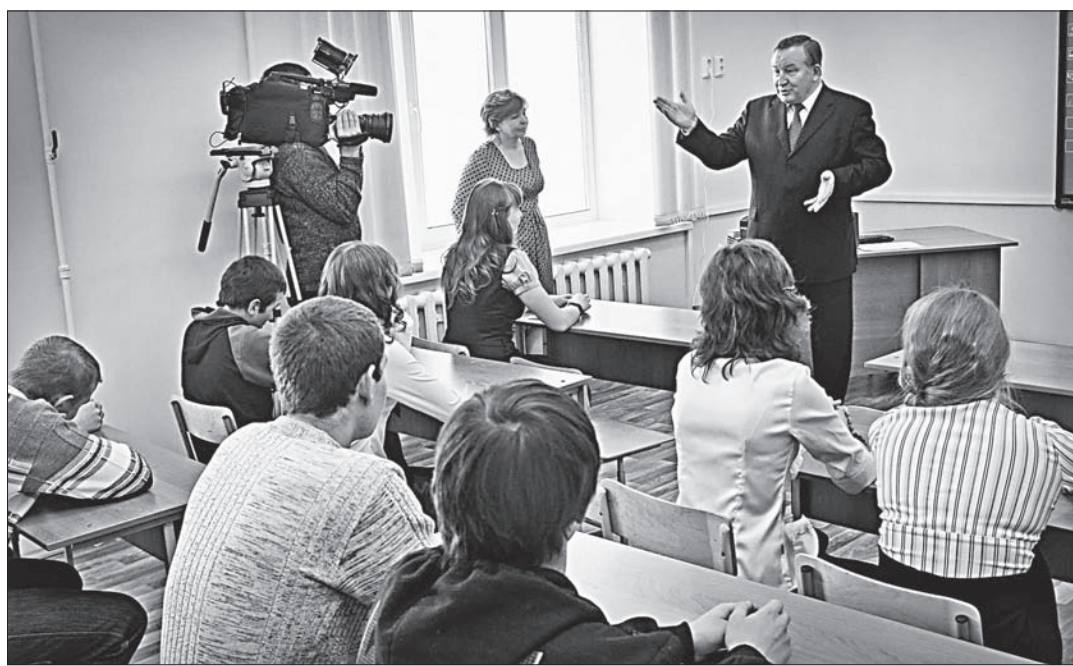
На вопросы ребят отвечает губернатор Александр Карлин.

системы отопления и водоснабжения. Оборудованы современная столовая и пищеблок. В кабинеты закуплена новая учени-