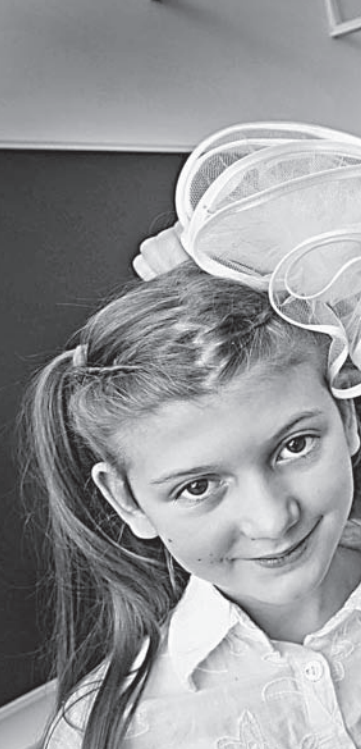
На работу, на учебу – как на праздник!