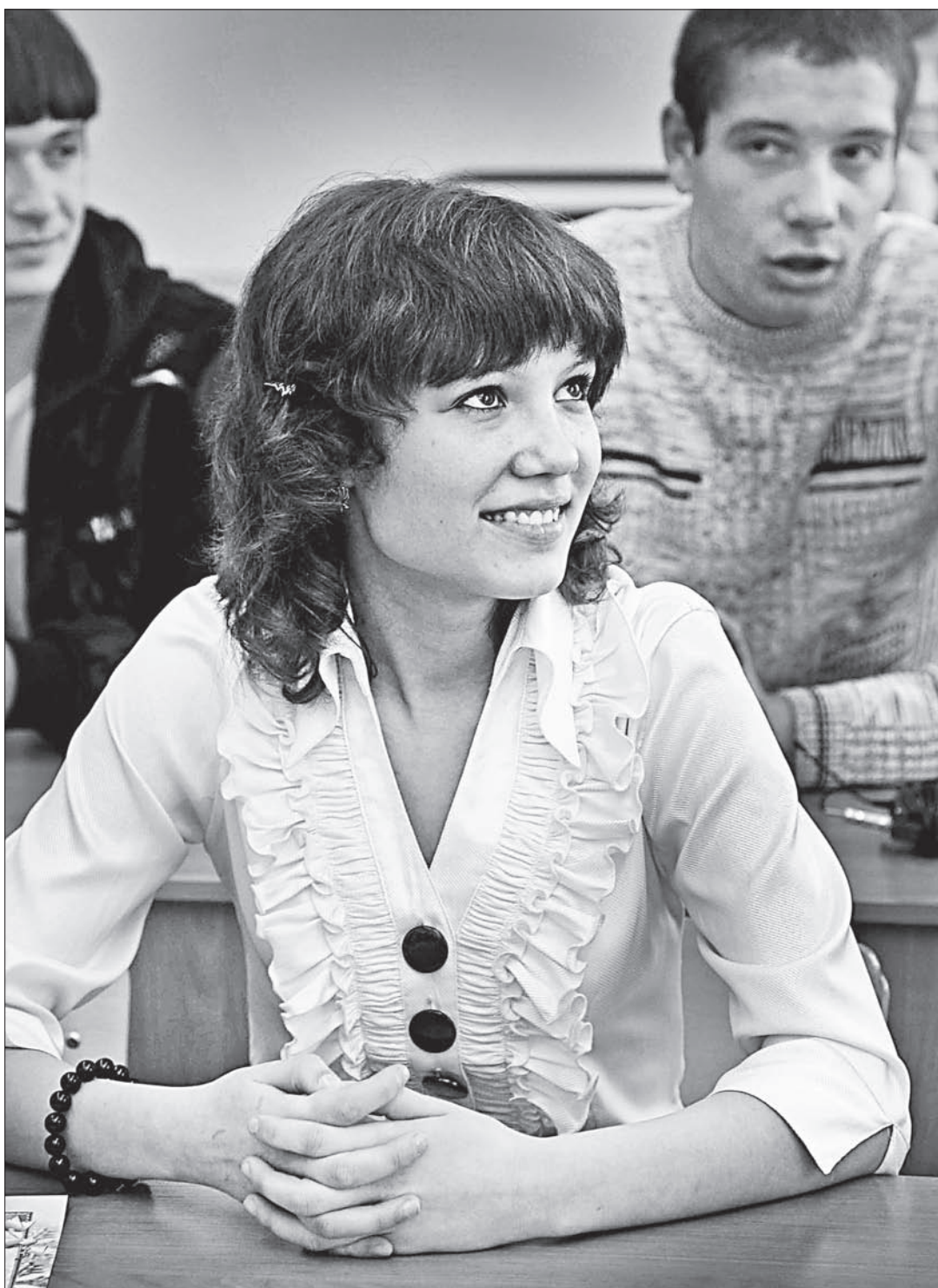
Ученики - будущее Дружки!

Уже сейчас школьники этого села строят жизнь собственным трудом. И заслуженным подарком для учеников и педагогов стала красавица-школа