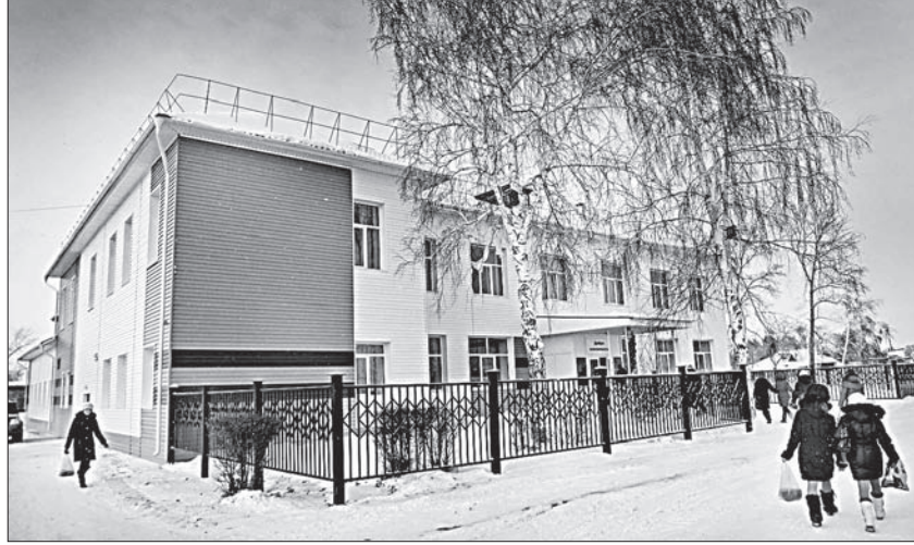
«Для нас всегда открыта в школе дверь».

ческая мебель». Таковы сухие строки отчетов о проделанной работе. Но кадры, ставшие теперь исторической хроникой, сбегут воспоминание о деревянных стропилах и крашеных масляной краской стенах. А бабушки-дедушки и родители нынешних первоклашек вспомнят, как бегали обедать в арендованную столовую. Весьма немаловажный - особенно в условиях сибирской зимы - пункт, обозначенный в отчете как «ремонты канализации», станет привычным для нынешних и будущих школьников-дружинцев, а подразумевает он появление в здании школы туалетов взамен деревянных «скворечников» во дворе.