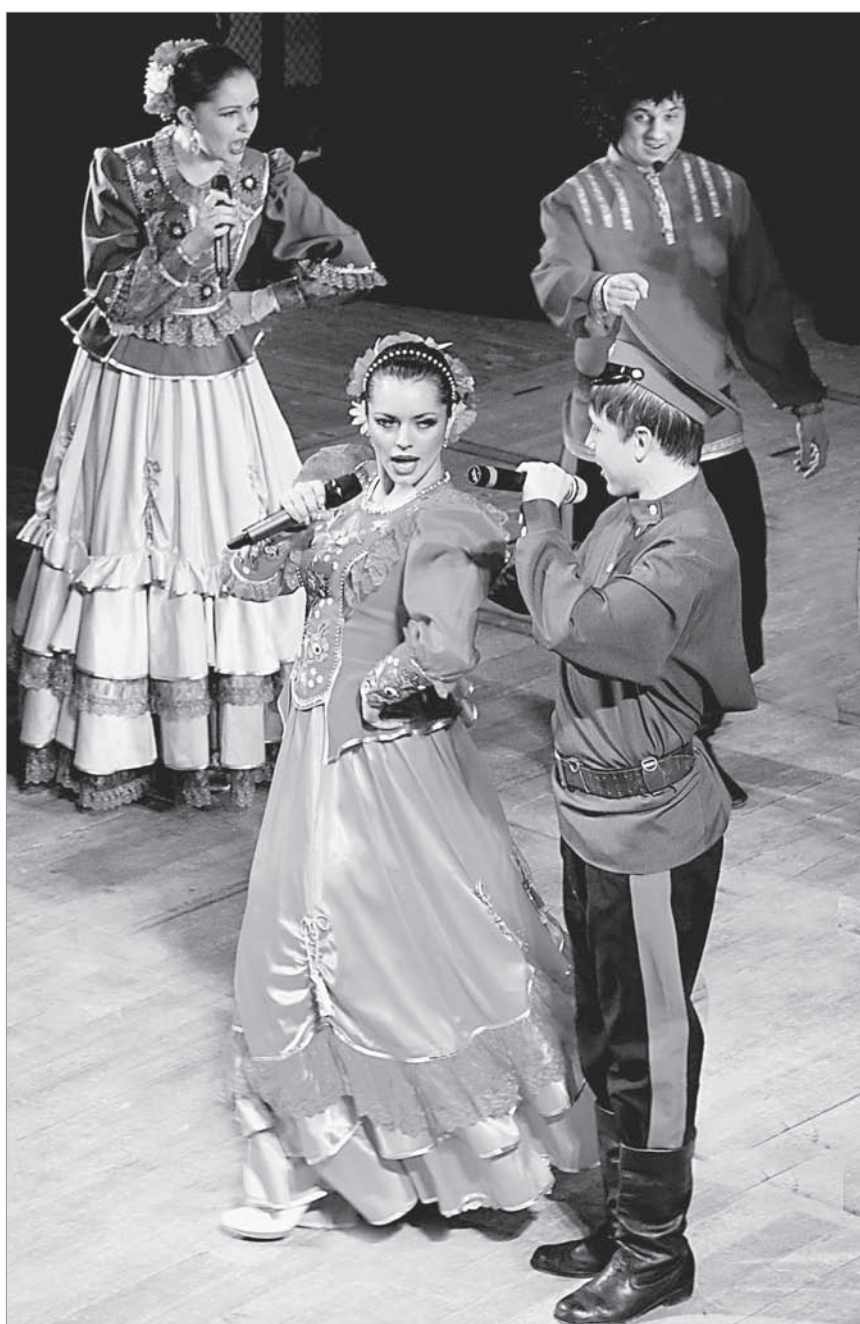
Зажигательную казачью программу краевая филармония еще повторит 14 января.

В выставочном зале Союза художников Алтайя проходят выставки «Рождественский вернисаж», в котором принимают участие мэтры алтайского изобразительного искусства и совсем молодые