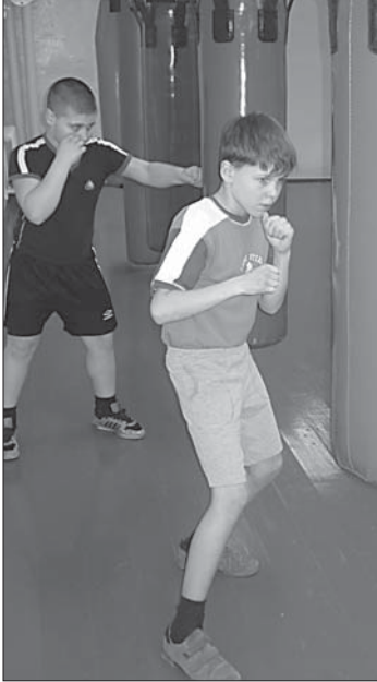
Новые группы юным боксерам пришлось по душе.