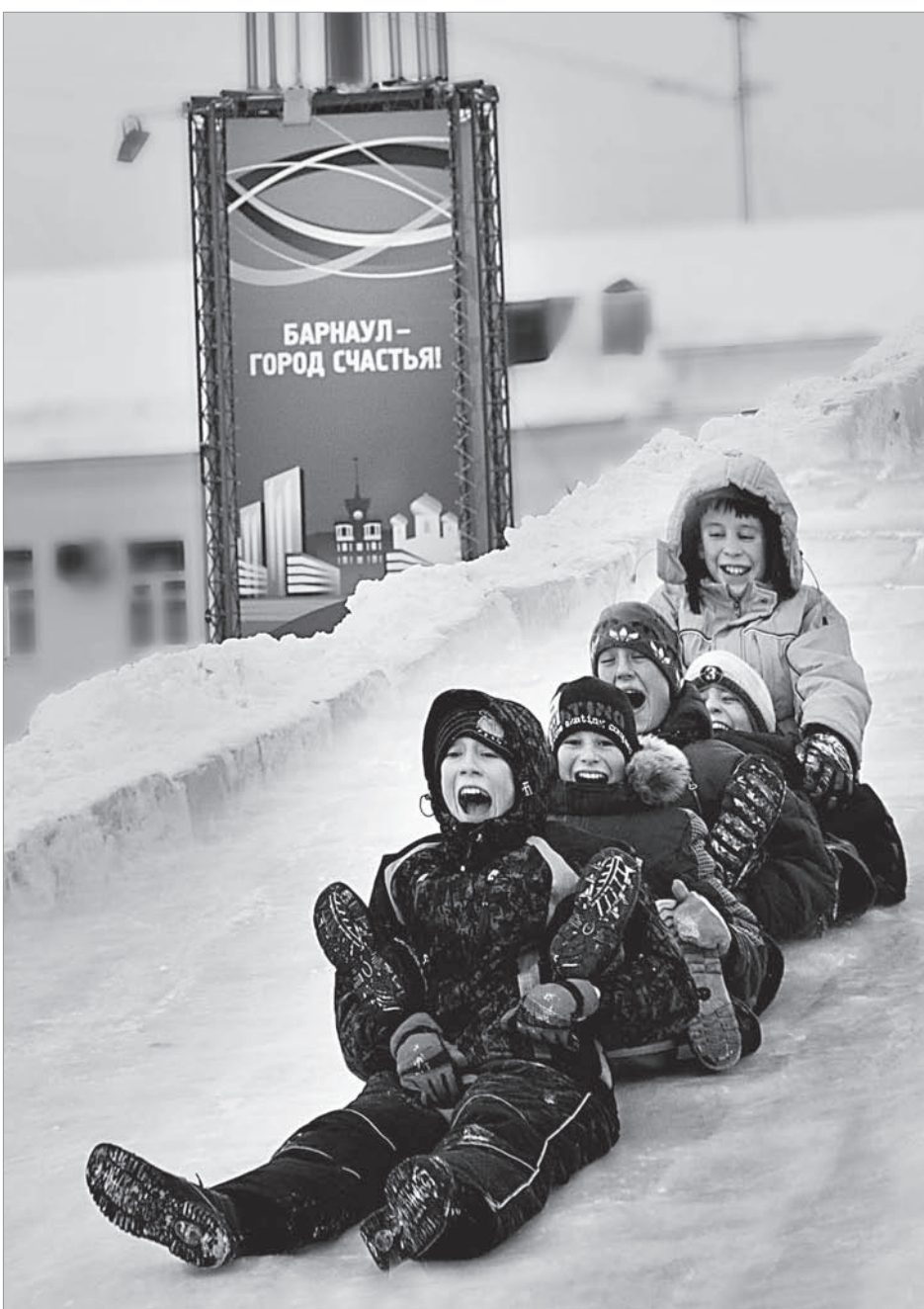
Нам на морозе жарко!

Продолжает и губернаторские ёлки – в тех районах, где они были отменены из-за непогоды. С 13 по 16 января в Бийск приедут дети из Ельцовского, Красногорского, Петропавловского, Солонешенского и, возможно, Смоленского районов. А Камень-на-Оби примет юных зрителей из Усть-Пристанского, Панкрушихинского, Баявского, Тюменцевского, Завьяловского, Крутихинского и Каменского районов.