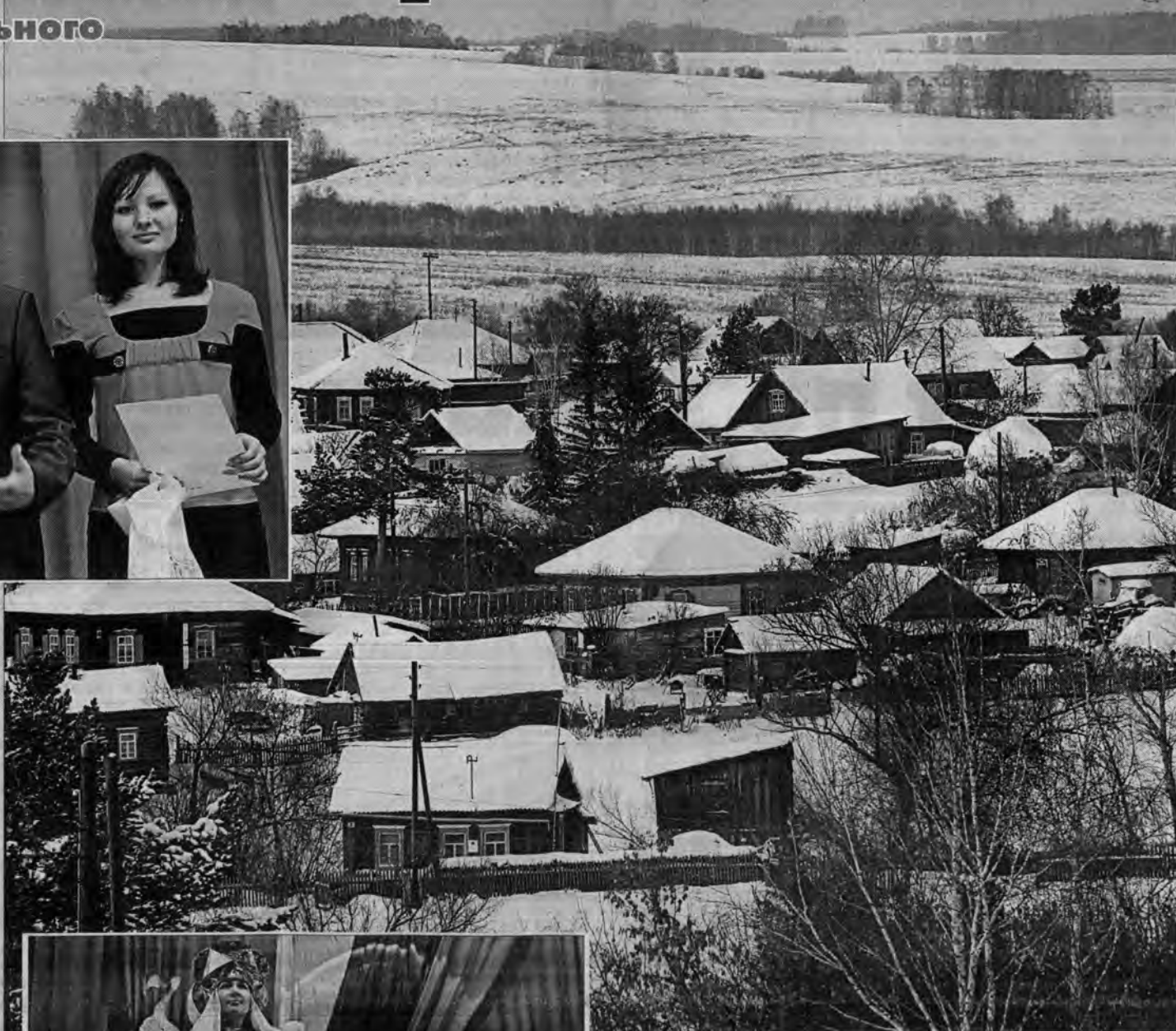
Тогуль в снегу.

ти, за девять первых месяцев текущего года в крае родилось 23 750 детей. Это на 602 больше, чем в прошлом году. В пяти городах и восьми муниципальных районах рождаемость превысила смертность. Вместе с тем в Тогульском районе сокращение численности населения за прошлый год составило 166 человек. Но ведь если так будет продолжаться, то лет через пятьдесят любые проблемы в этом муниципа-