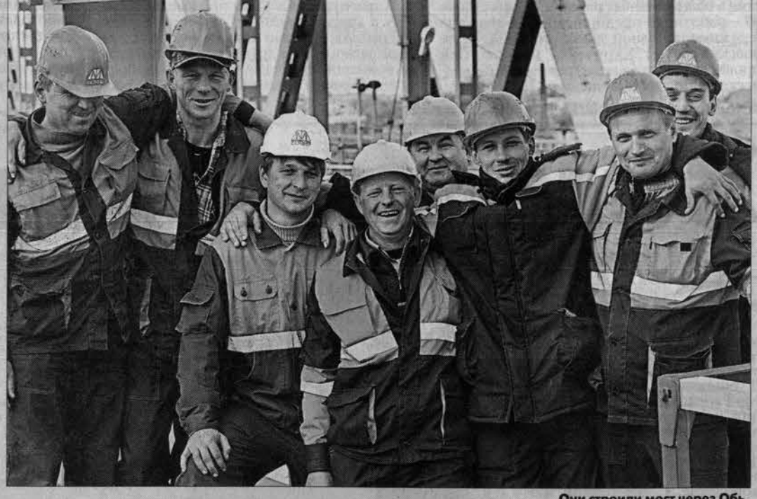
Они строили мост через Обь.

Кроме мостового перехода состоялось открытие Дома ветеранов железнодорожного транспорта в Камне-на-Оби. Дома отдыха локомотивных бригад, а также капитально реконструированного здания железнодорожного вокзала. Успехи проектировщиков, строителей и железно-