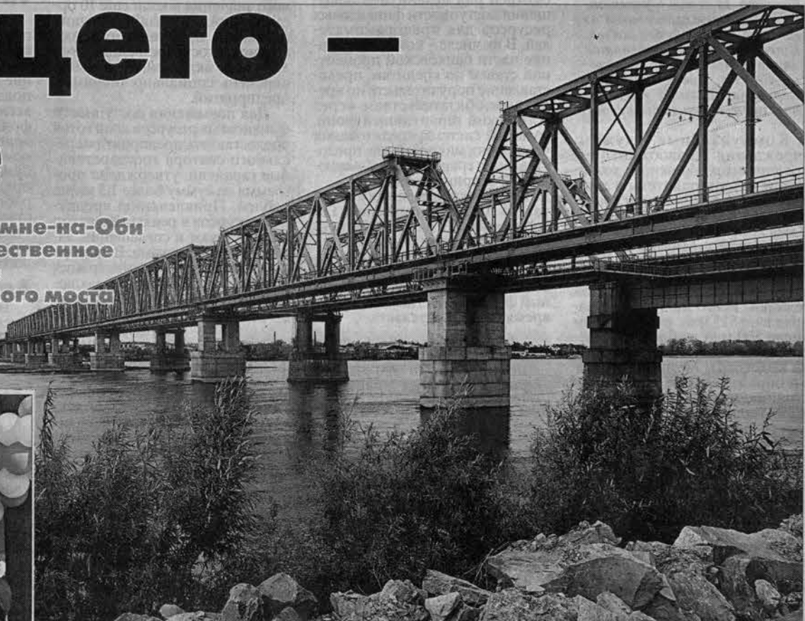
Новый мост через Обь.

25 сентября в Камне-на-Оби состоялось торжественное открытие нового железнодорожного моста через реку Обь