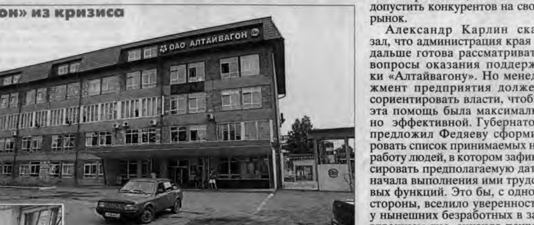
Справка «АП» ОАО «Алтайвагон» — единственный за Уралом и один из крупнейших в России заводов по производству железнодорожного грузового подвижного состава.

Бюджет не резиновый. Отметим, что краевые власти тоже в меру возможностей старались сгладить кризисные явления. Предполагается закрыть весь кассовый разрыв, чтобы выполнить производственную программу. В связи с расширением объемов производства до конца года на предприятии будут приняты около 700 человек. Прием уже начался.