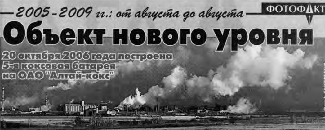
Запуск в работу второй по мощности в мире коксовой батареи — истинное событие: в постсоветский период объектов такого уровня не строили. Стрительство этого промышленного гиганта продолжалось более 20 лет. И время доказало, что крупные капиталовложения в инфраструктуру региона, вне всякого сомнения, не только подняли его инвестиционную привлекательность, но и существенно повысили «антикризисный иммунитет». Сегодня ОАО «Алтай-кокс» — в числе стабильно работающих предприятий. Инвестиционная политика предприятия на среднесрочную перспективу предполагает строительство шестой коксовой батареи.