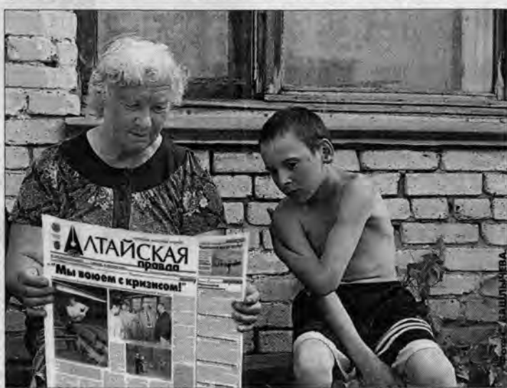
Многие не уложившись в анкетную графу, приклеивают рукописные и отпечатанные на машинке или принтере письма. Некоторые невозможно читать без слез. И даже начинаешь себя больше уважать: оказывается, тысячи людей ждут, когда выйдет газета, а многие — именно твои публикации. Звучит, может быть, излишне пафосно, но правда хочется работать лучше. Не зря говорят, что похвальное слово и кошке приятно. Кстати, критика тоже стимулирует.

Бывая на разных журналистских фестивалях, всегда слышу: "Такого большого тиража в наше время не бывает!" Потом коллеги начинают спрашивать, как удается "заставить" выпускать газету. Объясняю: "Никто никого не заставляет. Просто стараемся делать газету для читателя, а не для себя любимых, и писать объективно и оперативно обо всем...". Возражают: "Так и все тоже так же стареем, но у нас тираж явное (втрое) меньше". Отшучиваюсь: "Или плохо стараетесь, или у нас самый лучший читатель в мире". Хотя вы, уважаемые читатели, без всяких шуток, действительно для нас самые лучшие. И когда нас хвалят, и когда нас ругают. И еще спасибо за то, что откликаетесь на наши анкеты. Благодаря им мы лучше узнаем, что вас волнует, и стараемся больше писать именно об этом.