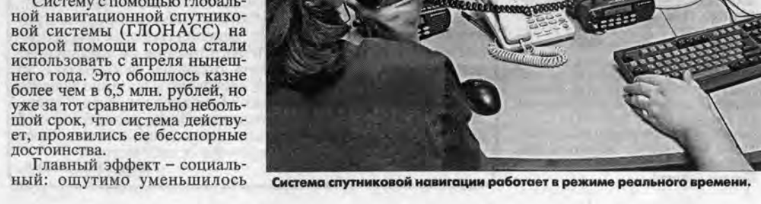
Система спутниковой навигации работает в режиме реального времени.

Систему с помощью глобальной навигационной спутниковой системы (ГЛОНАСС) на скорой помощи города стали использовать с апреля нынешнего года. Это обошлось казне более чем в 6,5 млн. рублей, но уже за тот сравнительно небольшой срок, что система действует, проявились ее бесспорные достоинства. Главный эффект — социальный: ошутимо уменьшилось время прибытия бригады скорой помощи на место вызова. Сегодня оно составляет в среднем 10,1 минуты (а еще недавно существовало достижение считались 24 минуты ожидания (врачей). Не менее впечатляющим оказался и эффект экономии: снижение бюджетных расходов на содержание автопарка. Уже сейчас достигнуто сокращение расхода горюче-смазочных материалов на 15% и составило примерно 4,5 млн. рублей, что позволяет, по мнению разработчиков, только за счет этой экономии окупить систему даже к концу текущего года. Но есть ведь еще и резервы снижения общих затрат,