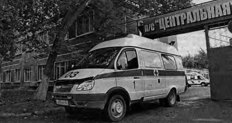
Оснащение машин "скорой помощи" современными техническими средствами позволяет врачам скорее прибыть на вызов.

Такой центр у нас будет создан, — сказал вице-губернатор, — и полагаю, что уже в этом году мы выйдем на уровень оснащения этой системой школьных детских автобусов и транспорта, осуществляющего пассажирские перевозки.