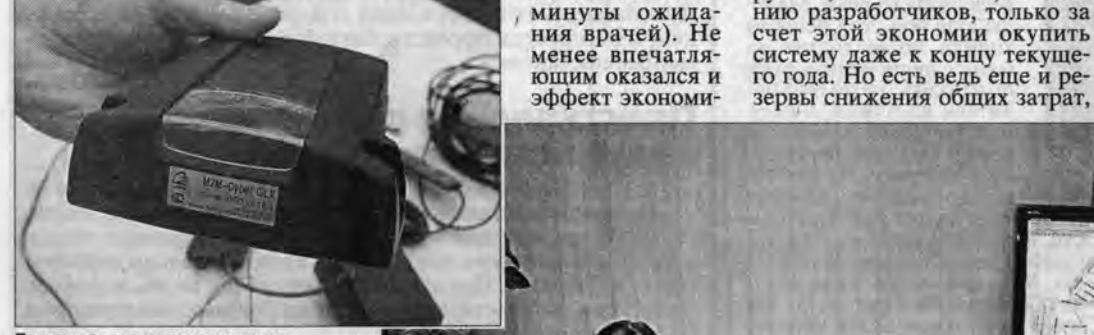
Так выглядит навигационно-спутниковый терминал. Принимая сигнал со спутника посредством jst-антенны сотовой связи, он передает информацию на сервер.

Пока эта система действует только на станции скорой помощи Барнаула и в трамвайно-троллейбусном парке, знакомиться с работой глобальной навигационной спутниковой системы (ГЛОНАСС) на скорой помощи города стали использовать с апреля нынешнего года. Это обошлось казне более чем в 6,5 млн. рублей, но уже за тот сравнительно небольшой срок, что система действует, проявились ее бесспорные достоинства.