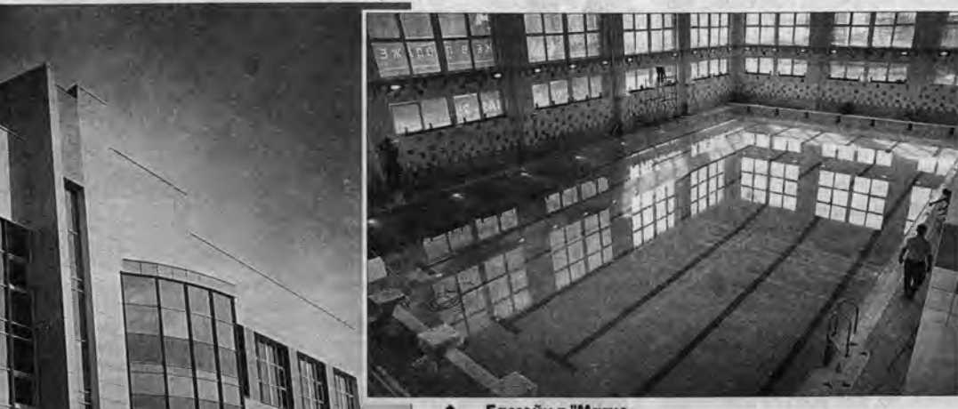
▲ Бассейн в "Магис-спорте" по уровню технической оснащенности станет лучшим в городе.

Еще на двух важных спортивных объектах — лыжероллерной трассе и биатлонном стрельбище — занимаются воспитанники училища олимпийского резерва. Реконструкция трассы началась в 2008 году. За это время выполнили монтаж биатлонных установок, построили новые трибуны и ограждения, заменили асфальт. В планах — строительство гостини-