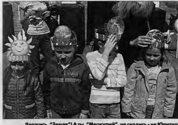
Держись, "Земля"! А ты, "Меркурий", не сердись - не Юпитер!

- Помнишь, мы были с тобой недавно в театре? Так вот, планетарий - это "астрономический театр". Там можно увидеть звезды, которые мы с тобой рассматриваем, когда гуляем по вечерам, и планеты. Об одном созвездии под названием Большая медведица, я тебе рассказывала, - обстоятельно объяснила пожилая женщина. - Да, да, да! А как она там оказалась? А чем занимается? А почему ее называют Большой? - Вот пойдем в планетарий и узнаем.