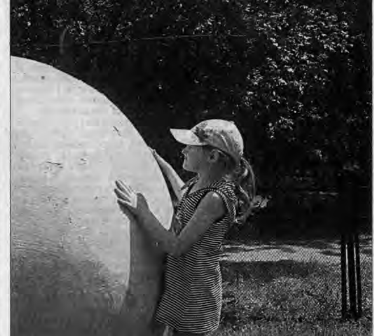
Была такая песня: "Дадим шар земной детям!"...

"Пролетарка, пролетарий, заходите в планетарий!" Этой стихотворной строкой Владимир Маяковский призывал советских людей заходить в первый московский звездный дом, открытый в 1929 году. Барнаульскому, расположенному в парке культуры и отдыха Октябрьского района, тоже лет немало, в следующем году исполнится 60. "Звездный дом" и окружающая его площадка - один из наиболее красивых уголков столицы Алтайского края. Здание, в котором находится планетарий, является памятником архитектуры Барнаула. В течение летних месяцев здесь можно увидеть много увлекательных астрономических программ: "Приключения не-