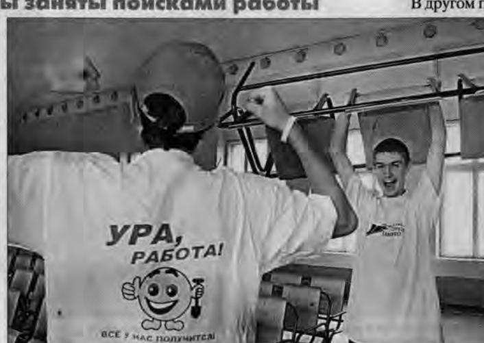
Ребята из 40-й барнаульской школы рады потрудиться на ее ремонте.

Информационно-справочные службы: — справочная служба 09 — справочная служба 333-999 — центр занятости населения, тел. 62-48-16, пр. Строителей, 40 — отдел приема населения в Ленинском и Индустриальном районах, тел. 48-59-70, ул. Повова, 68 — центр занятости населения, тел. 77-77-80, пр. Ленина, 106, к. 411.