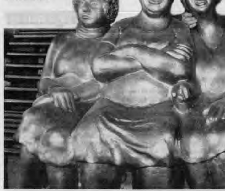
Пигмалион и его Галатея.