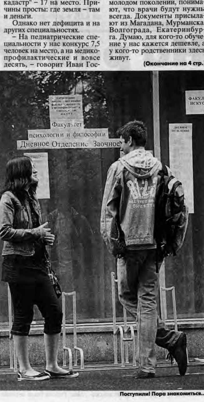
Поступили! Пора знакомиться...