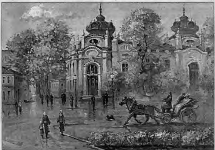
В.Конков. "В старом Бийске".

ности еще с тех времен. Почувствовал романтику Бийска, представил себя художником того, дореволюционного времени, как будто только что вышел с этюдником и начал писать современные тогда улицы и дома, - делится впечатлениями