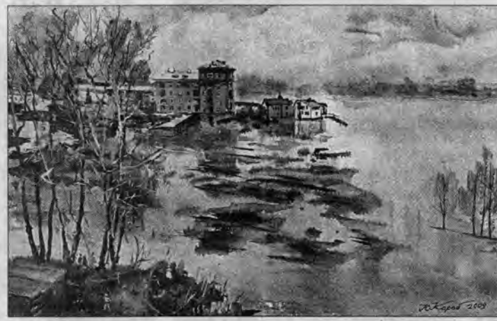
Ю.Коробейников. "Большая вода на реке Бий".

найти и ощутить красоту этого города. - Бийск "насыщен" историей. В каждом доме находится крупица какой-то загадки, сказоч-