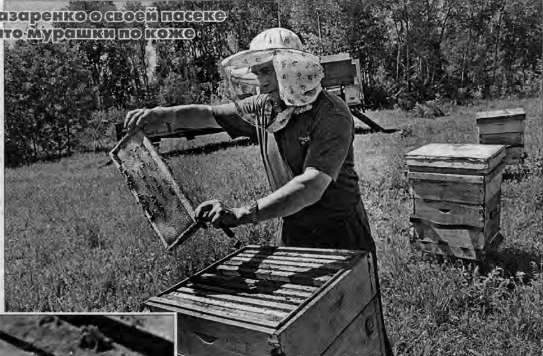
Именно в момент съемки этого кадра нашего фотокора укусила пчела.