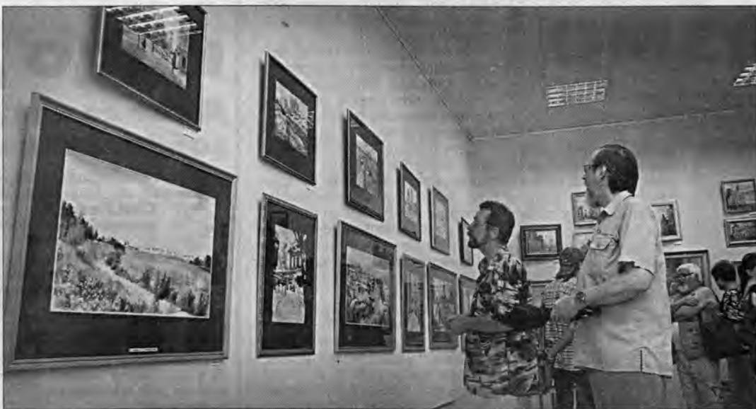
В выставочном зале.

Художник пишет и старые, и новые постройки Бийска. Сюжеты его картин полны жизни, различны по настроению, передают разнообразие эмоциональных оттенков в живописной манере. В акварельных этюдах