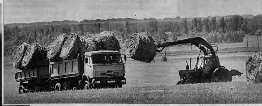
Над лугами - сена аромат.