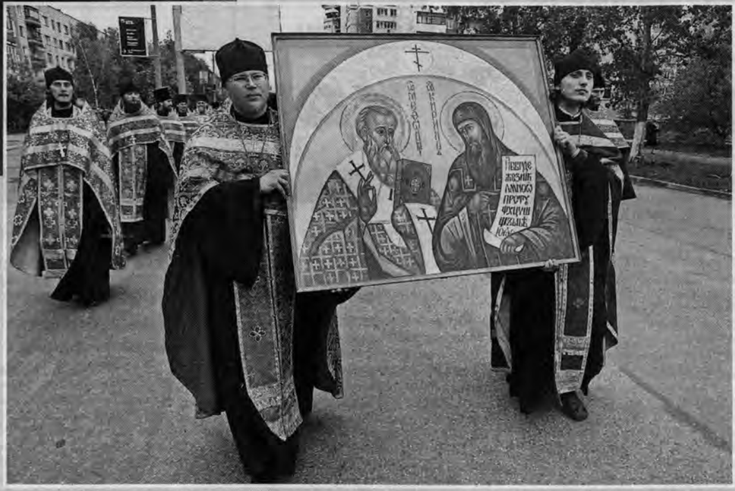
В этот день в Барнауле вспоминали святых равноапостольных братьев Кирилла и Мефодия. Крестный ход от Никольской церкви прошел по улицам города.