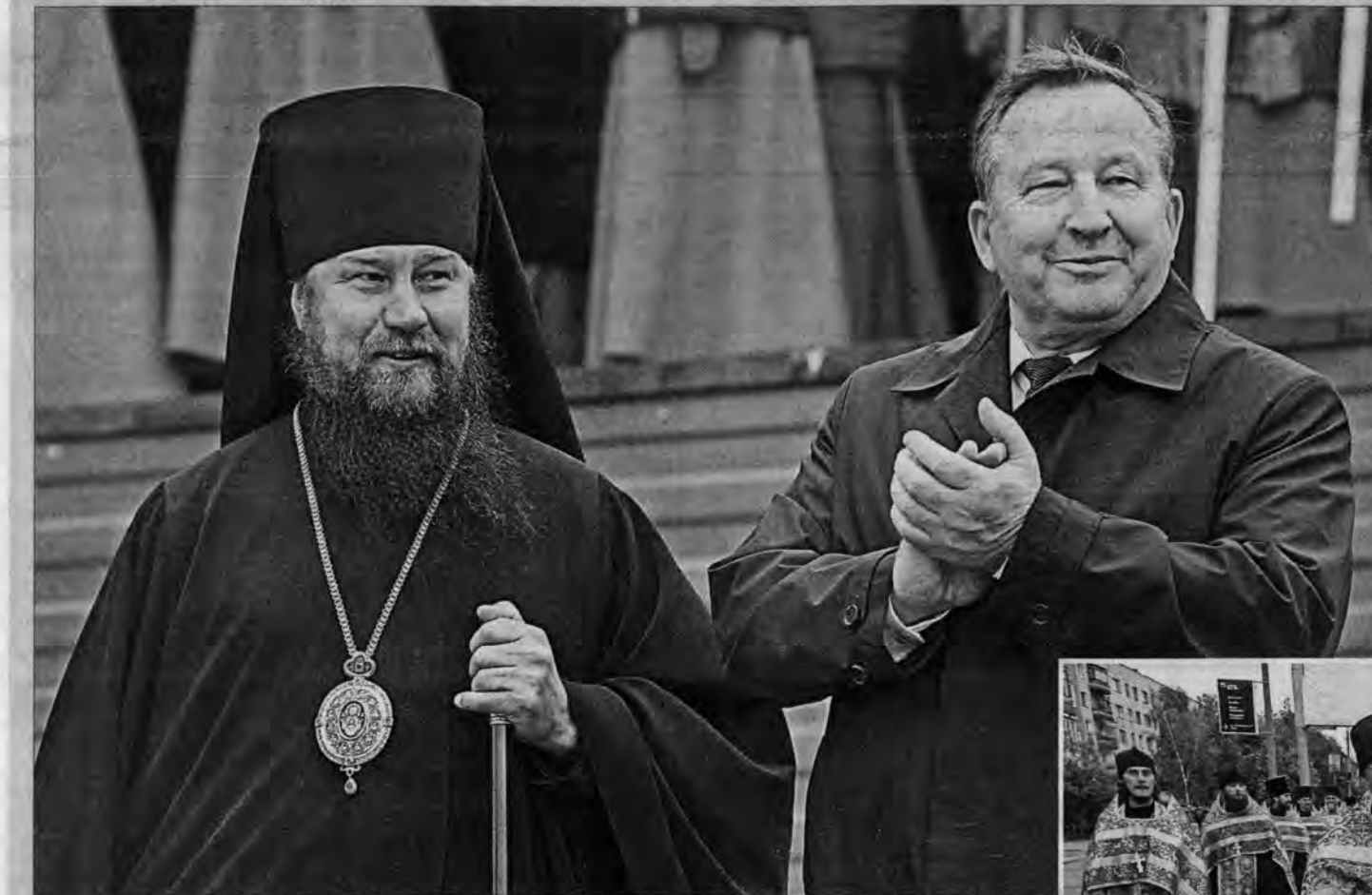
Губернатор Александр Карлин и епископ Барнаульский и Алтайский Максим поздравляли барнаульцев и гостей города с праздником.

В крае отметили День славянской письменности