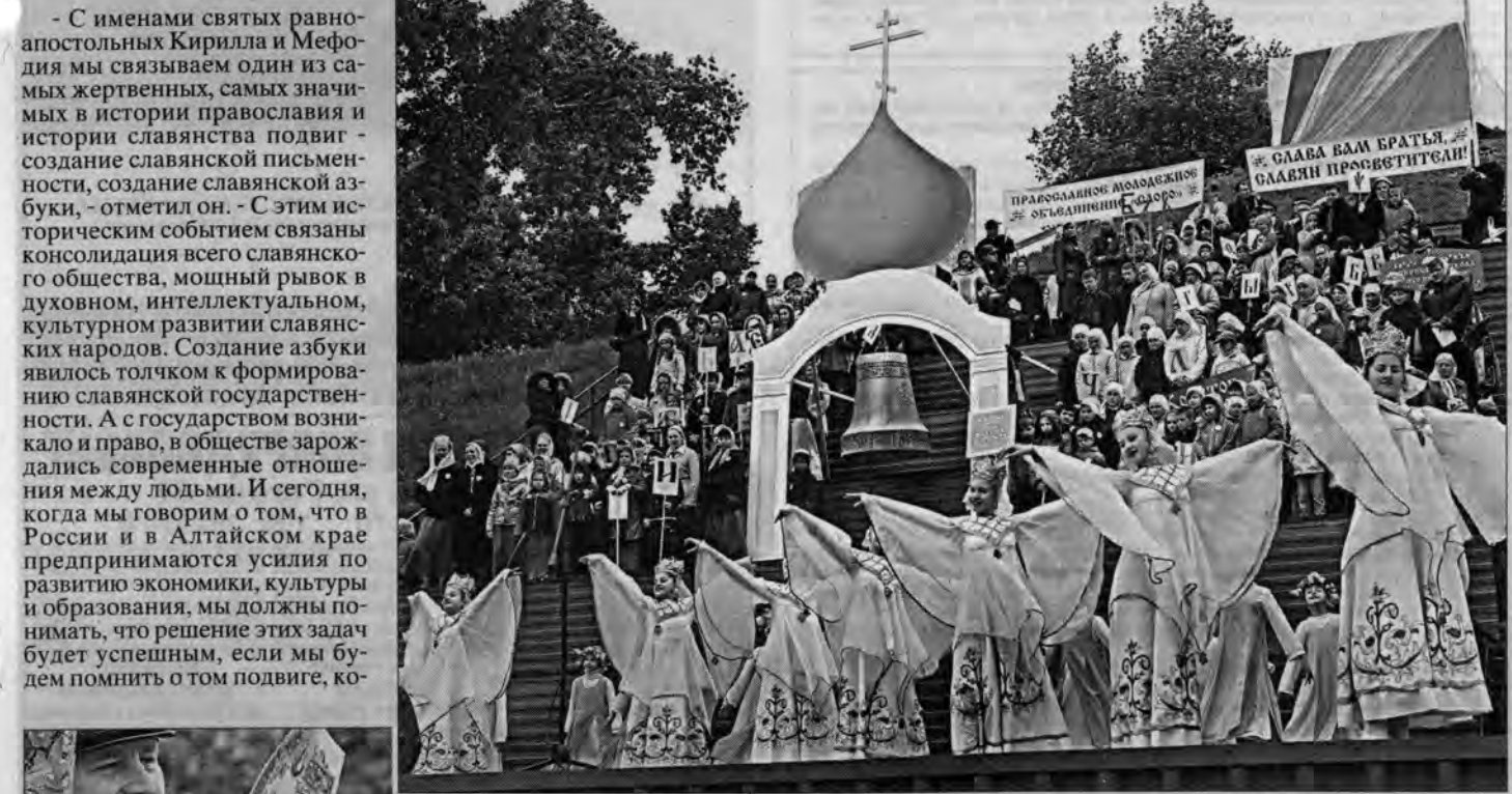
Такой праздник не мог обойтись без народных танцев и музыки!