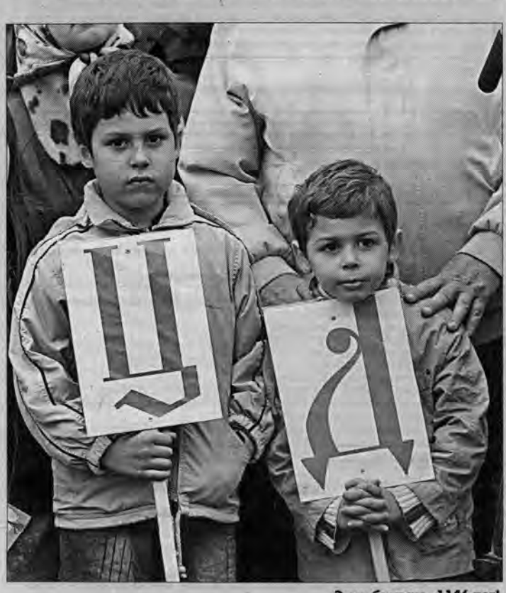
Этим буквам - 1146 лет!

Такой праздник не мог обойтись без народных танцев и музыки!