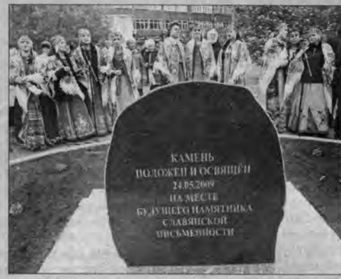
Через год на этом месте у педагогической кафедры будет воздвигнут памятник.

Многие прохожие в пасмурное воскресное утро останавливались, слыша в краевом центре звон колоколов: после литургии от Никольской церкви к зданию педагогической академии шел крестный ход. Там состоялась церемония открытия и освящения камня на месте будущего памятника славянской письменности. Символичность того, что он будет открыт именно у стен первого в крае вуза, уже 75 лет воспитывающего будущих педагогов, отметили и заместитель губернатора Николай Черепанов, и епископ Барнаульский и Алтайский Максим.