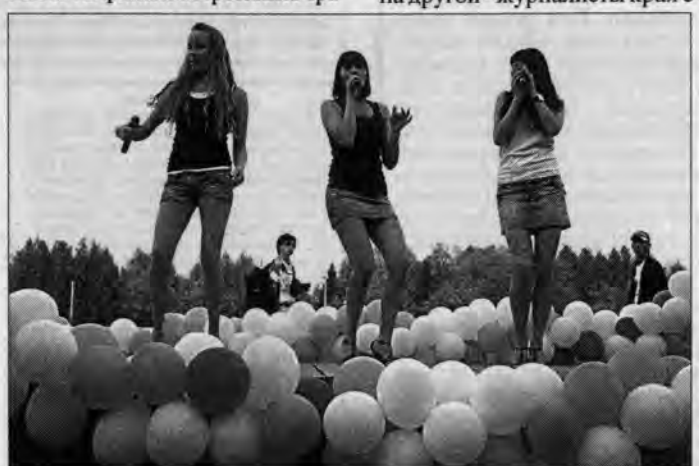
Привет от Смертина-старшего!

Перед концертной программой на одной половине поля сыграли ветераны футбола, а на другой - журналисты края с