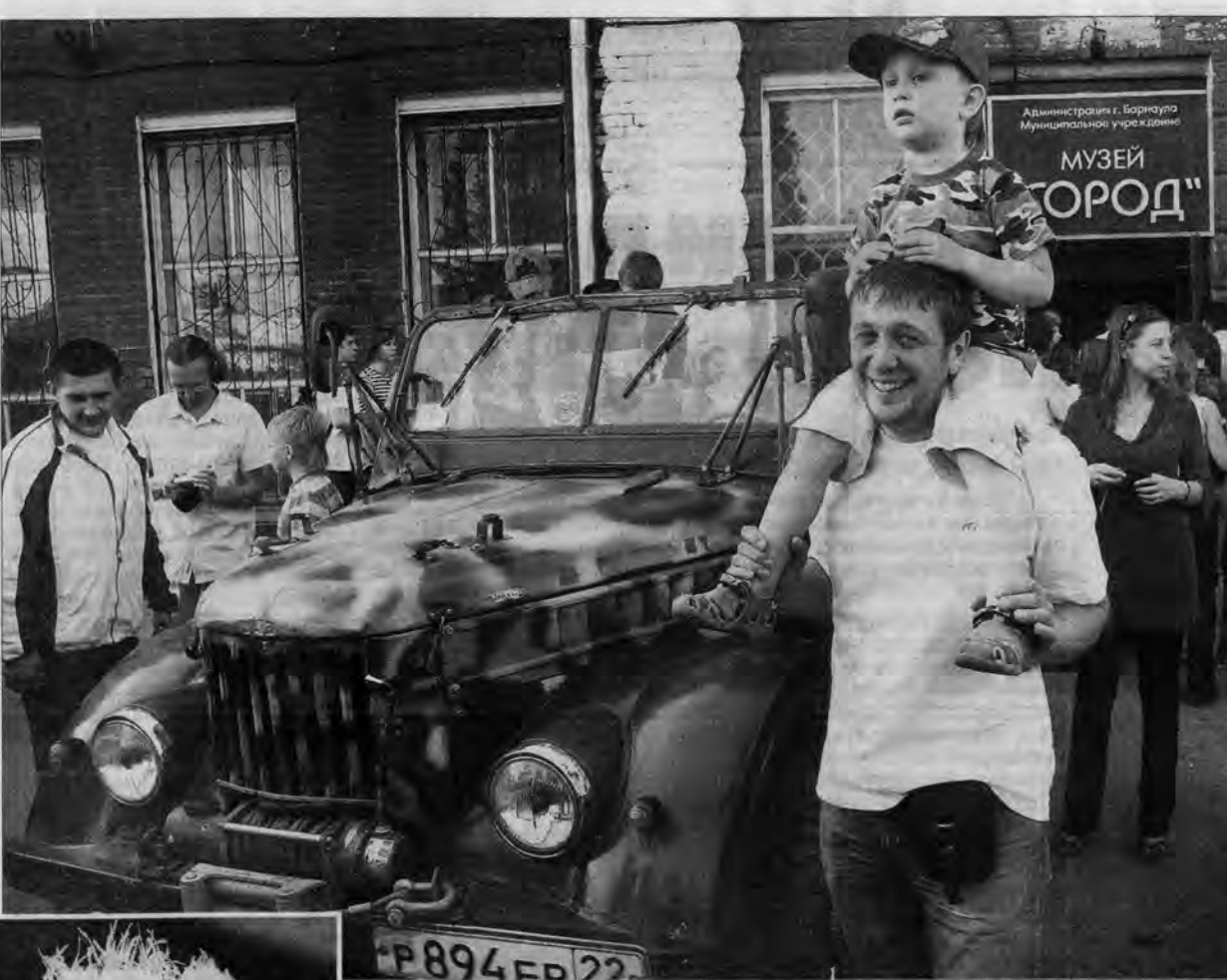
Высоко сижу, далеко гляжу, "Музейную ночь" вижу!

Публике, пришедшей к самому началу "Музейной ночи" в павильон современного искусства "Открытое небо", практически не дали опомниться: в противоположных углах первого зала сразу начались мастер-классы по коллажу (ведущая — Юлия