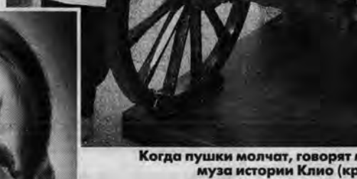
Когда пушки молчат, говорят музы. И одна из них — музыка истории Клин (краеведческий музей).

дожественной куклой и предстает не только в виде изящных девушек, но и в образах рыбаков, самураев и комичных старичков с личиками, обращенными к небу. В двух витринах, оформленных