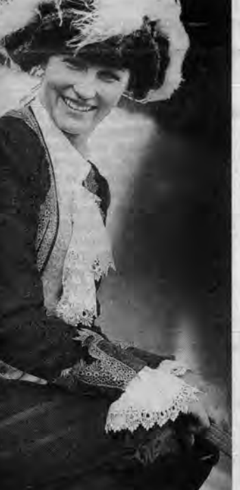
Поедем с красочной катальки!