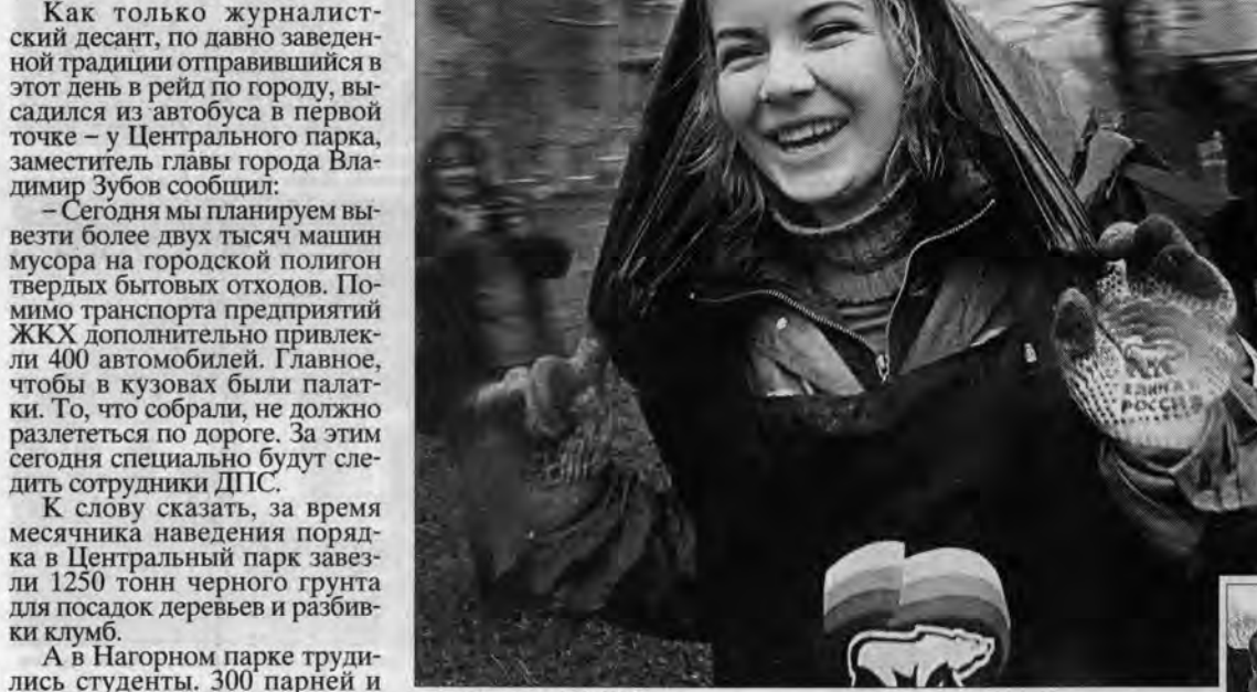
Подумаешь - дожди!

Небо расстроилось с раннего утра, заплакало тоненькими частыми ручейками. Организаторы субботника озабоченно поглядывали вверх. По народному поверью, если дождь зарядил с утра, значит, продлится до обеда. Так и случилось.