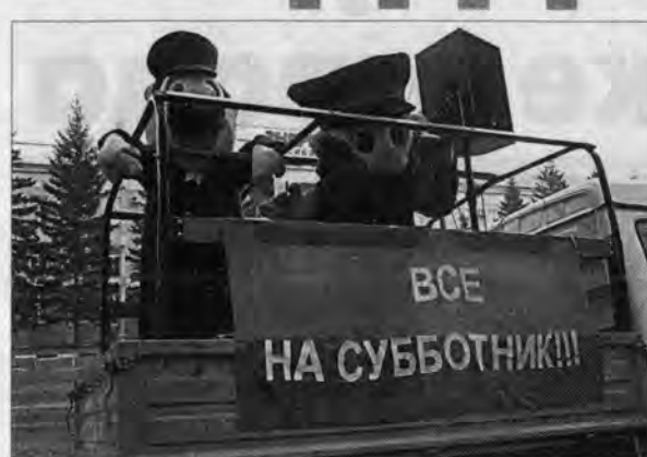
Агитбригада подбадривала участников субботника.

прошел 25 апреля в Барнауле традиционный общегородской субботник