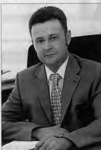
Игорь Бушмин, начальник управления Алтайского края по труду и занятости населения

Важной формой обеспечения безопасности является и аттестация рабочих мест, по итогам которой выявляются вредные и опасные производственные факторы и осуществляются мероприятия по их устранению.