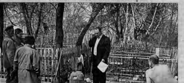
Когда мы приехали на кладбище, здесь во всю кипела стройка...

Два часа дня. Мужики в нижнем белье принимают солнечные ванны, а заодно и выкладывают кладбищенский паркет.