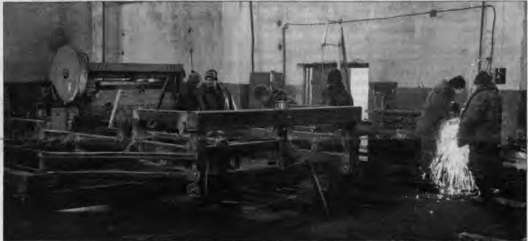
В мастерских "Агрофирмы"