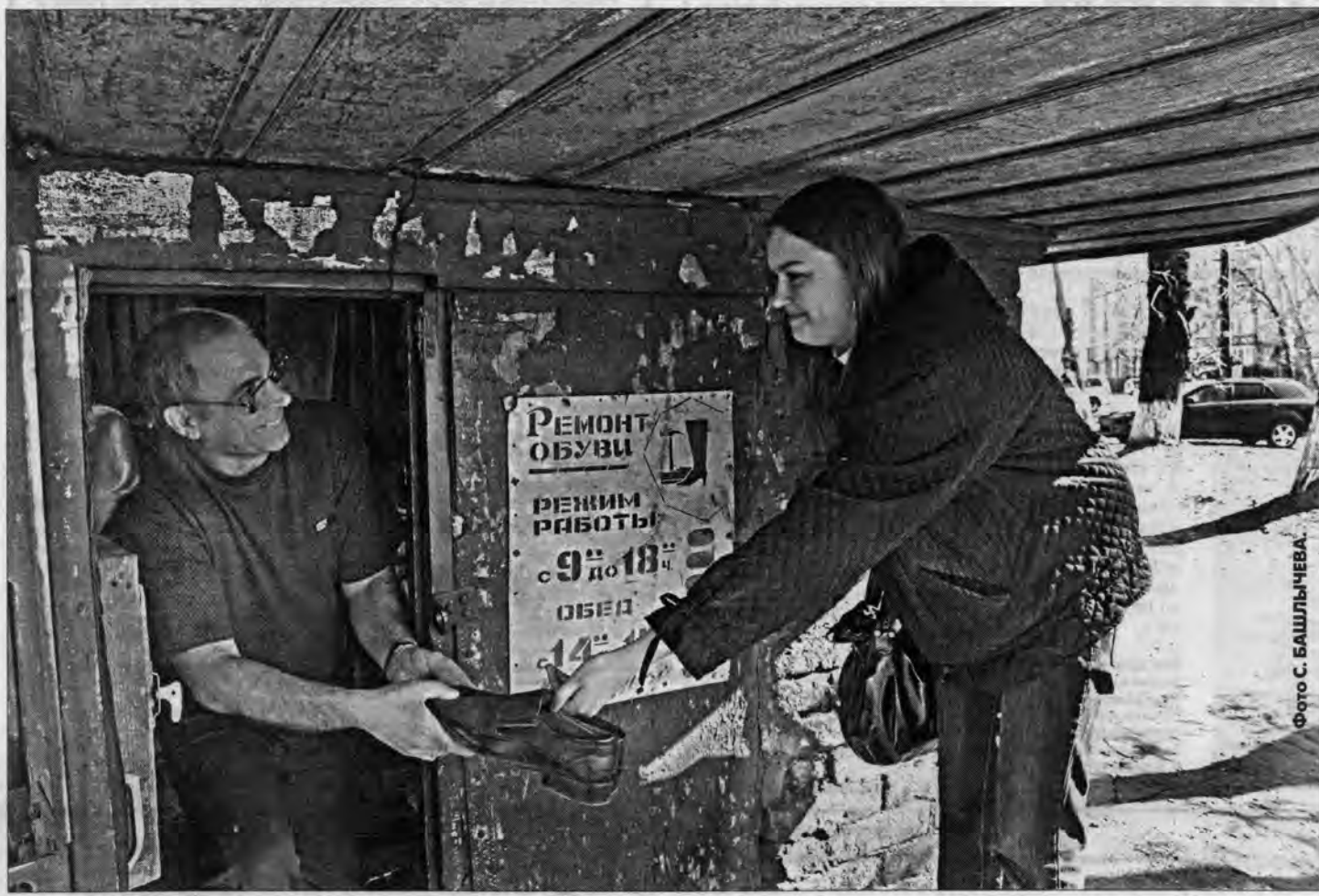
Весной на мастеров по ремонту обуви повышенный спрос.

По словам мастера, цены по сравнению с затратами на материалы и электроэнергию выросли в его мастерской незна-