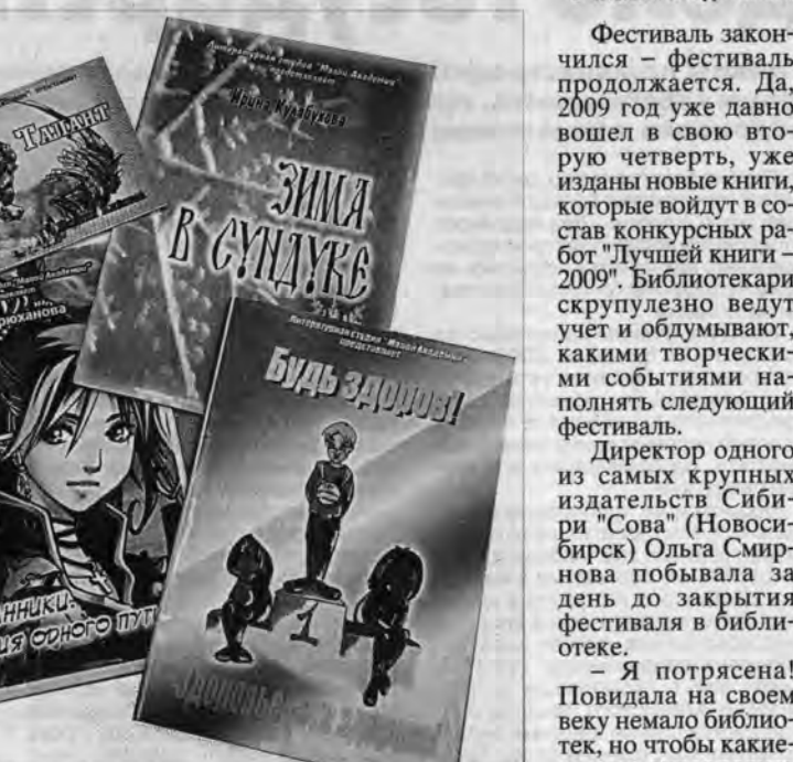
Книги юных рубцовских авторов.

тра внешкольной работы Рубцовска за серию книг авторов школьников.