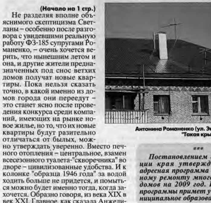
Антонина Романенко (ул. Энгельса, дом №6): "Такая крыша нам по душе"