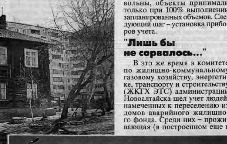
Из таких домов (вверху) будут переселять в такие (внизу).