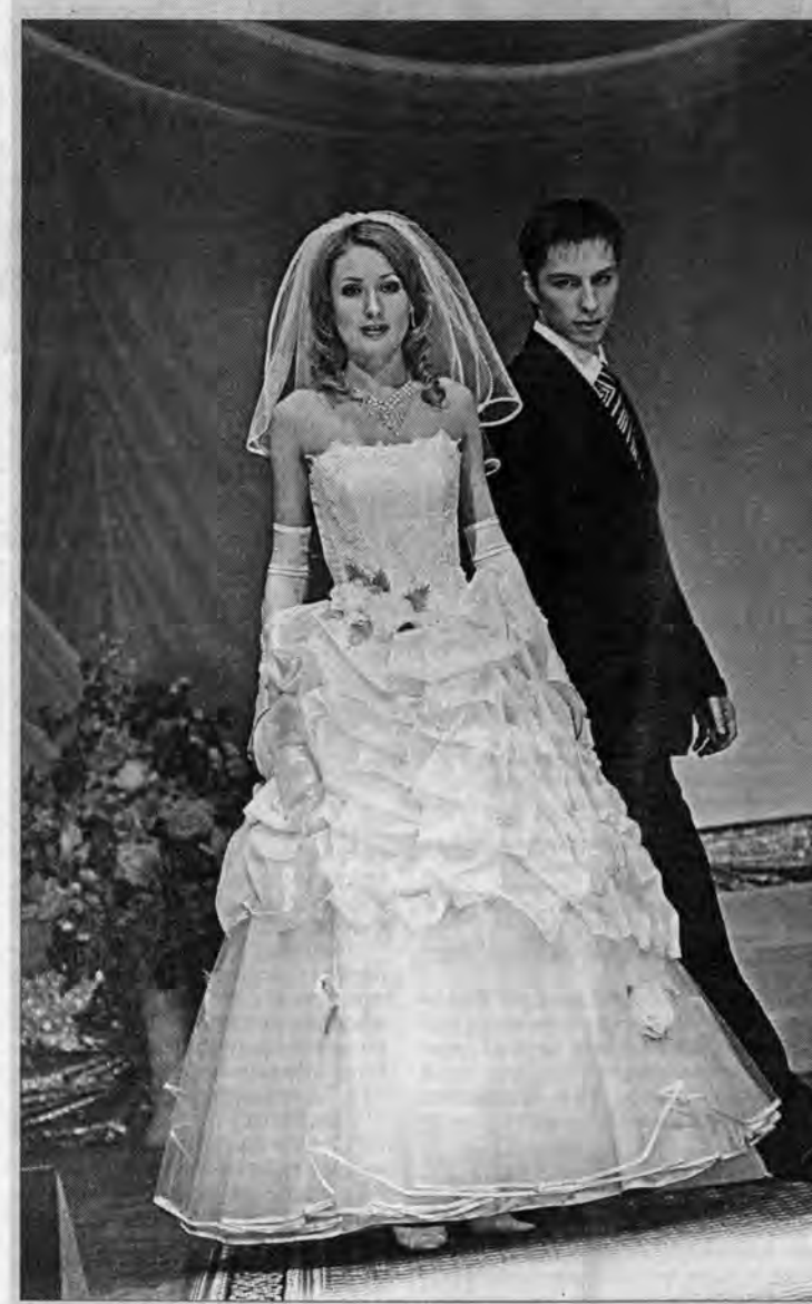
Показ новой коллекции.

Кучер и тот насвистывает: "Ах, это свадьба, свадьба... и предупреждает: - Мужики, здесь столько невест, аж в глазах рябит!"