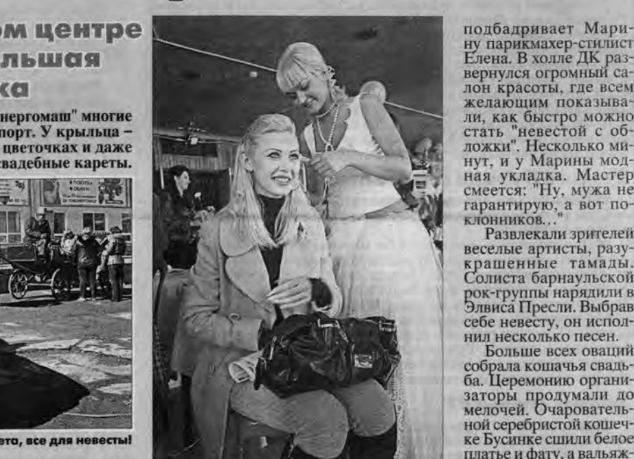
В холле ДК всем желающим мастера лучших салонов красоты Барнаула бесплатно делали прически и навели макияж. Десять минут - и все женихи у своих ног!