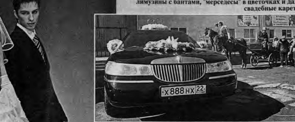
Машина или карета, все для новобрачных!

В этот день перед ДК "Сибэнергомаш" многие холостяки съели бы свой паспорт. У крыльца - лимузины с бантами, "мерседесы" в цветочках и даже свадебные кареты.