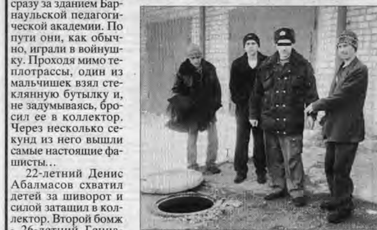
Тот самый колодезь, где преступники держали детей.

Это преступление вызвало широкий общественный резонанс не только в Алтайском крае. Следственное управление Следственного комитета при Прокуратуре РФ взяло его разработку под особый контроль. Зимой прошлого года бездомные затащили детей в теплодрассу, порезали ножом, а потом связали и подожгли. Мальчишкам просто чудом удалось освободиться и убежать от мучителей.