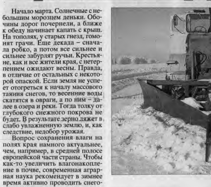
Новосенной клин СВШ-14.

Начало марта. Солнечные с небольшими морозами денки. Обочины дорог почернели, а ближе к обеду начинают капать с крыш. На тополях, у старых гнезд, гомонят грачи. Еще декада — сначала робко, а потом все сильнее и сильнее забулбят ручьи. Крестьяне, как и все жители края, с нетерпением ожидают весны. Правда, в отличие от остальных с некоторой опаской. Если земля не успеет отогреться к началу массового таяния снегов, то весенние воды скатятся в овраги, а по ним — далее в озера и реки. Тогда толку от глубокого снежного покрова не будет. В результате зерно ляжет на слабо увлажненную землю, и, как следствие, недобор урожая.