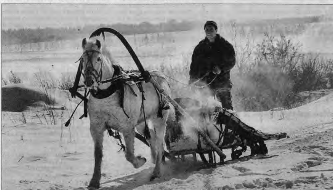
На коне хоть что удобно подвезти: клади в сани любой груз по лошадиной силе - и вперед.

В селе Батурово Шелаболихинского района хорошее отношение к лошадям. Они и в сельхозкооперативе работники, и на личных подворьях.