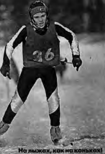
На лыжах, как на коньках!

По итогам соревнований сформирована сборная школьников от 9 до 16 лет, которая уже в эти выходные примет участие в межрегиональных соревнованиях "Приз Барановой" в Северске.