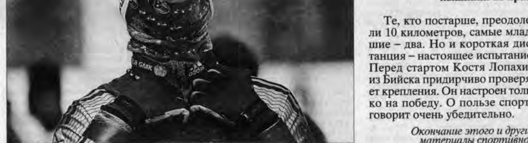
За мгновение до старта.

Читателей информировали: пресс-служба администрации края, Л. Ермолина, Н. Сохарева, Г. Полохов, К. Соменов, Ю. Савельев, И. Подиняков, К. Ливер.