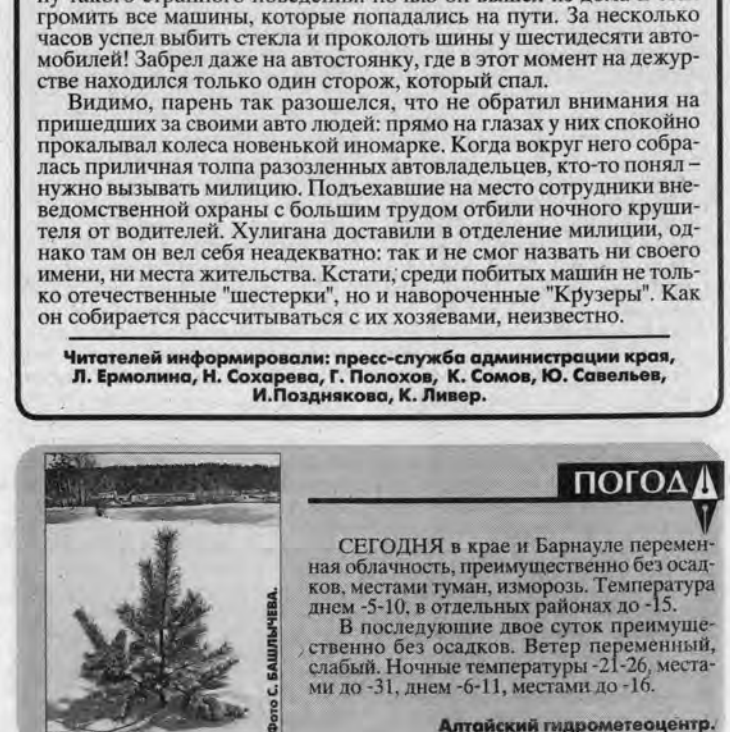
СЕГОДНЯ в крае и Барнауле переменная облачность, преимущественно без осадков. местами туман, изморозь. Температура днем -5-10, в отдельных районах до -15. В последующие двое суток преимущественно без осадков. Ветер переменный, слабый. Ночные температуры -21-26, местами до -31, днем -6-11, местами до -16. Алтайский гидрометцентр.

Читателей информировали: пресс-служба администрации края, Л. Ермолина, Н. Сохарева, Г. Полохов, К. Соменов, Ю. Савельев, И. Подиняков, К. Ливер.