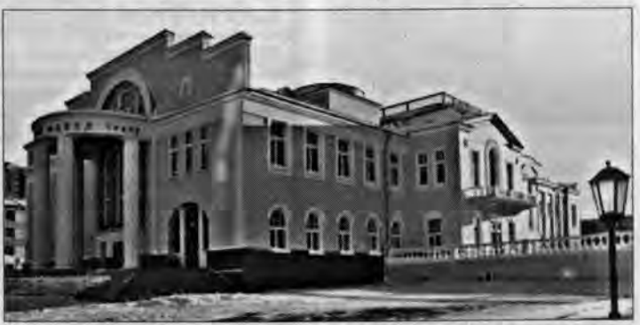
Театр «Красный факел» в Новосибирске.

На пять ужасающе морозных дней, с 11 по 15 февраля, Новосибирск превратился в один огромный театр, на сцене и в закулисье которого проходили семинары и мастер-классы Третьего всероссийского театрального форума «Театр - время перемен». На форум собрались представители более семидесяти театров Сибирского региона - не менее полусотни человек: директора, режиссеры, сценаристы, хореографы, заведующие постановочными цехами, художники по театальному костюму, по гриму, по свету, а также завленты, критики, журналисты, пишущие о театре, и драматурги. Они все приехали учиться и за пять дней узнали столько нового и необычного, сколько порой не узнаешь и за год. Главные же чувства, которые наверняка испытают каждый участник форума, окунаясь в эту крутоватую атмосферу и спектаклей, - немалая радость и нескрываемое удивление. От чего? Да от того, что, несмотря на жутковатую мировую ситуацию экономического кризиса, когда все и вся, кажется, замерло в ожидании еще более ужасных перемен, Его Величество Театр вдруг заявил о себе во весь голос и провозгласил: «Мы будем жить! И вы будете жить вместе с нами!»