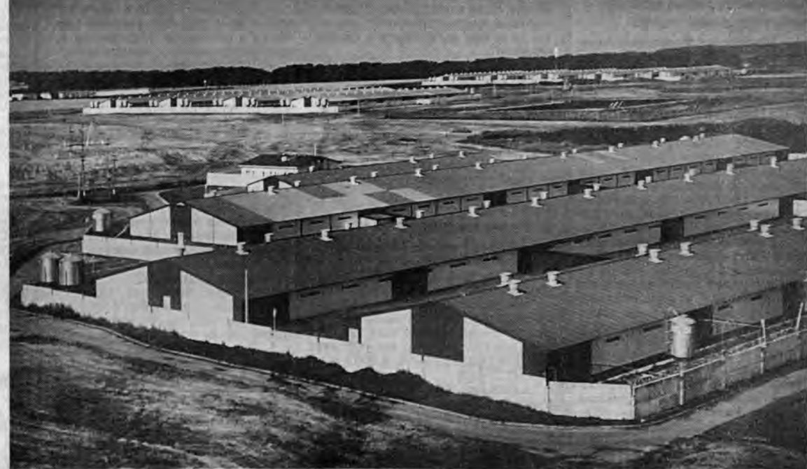
Таким будет свиноводческий комплекс ООО "Алтайский бекон".