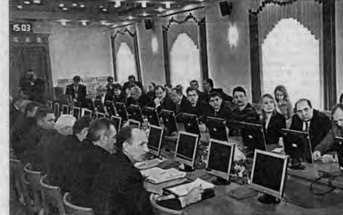
Во время презентации: белгородская делегация в зале администрации края.

Управление Алтайского края по образованию и делам молодежи объявляет о начале конкурсного отбора претендентов на получение денежного поощрения президента Российской Федерации. Принять участие в конкурсе могут учителя образовательных учреждений, преподаватели, работающие в учреждениях начального и среднего профессионального образования (если они ведут общеобразовательные предметы), со стажем педагогической работы не менее 3 лет, основным местом работы которых является образовательное учреждение. Выдвижение кандидата на получение денежного поощрения осуществляется органами самоуправления образовательного учреждения, профессиональной педагогической ассоциацией или объединением. Документы претендентов принимаются с 20 февраля по 31 марта 2009 г. по адресу: г. Барнаул, проспект Социалистический, 60. С полным текстом положения о процедуре проведения конкурса можно ознакомиться на сайте управления Алтайского края по образованию и делам молодежи www.educaltai.ru (раздел "Документы").